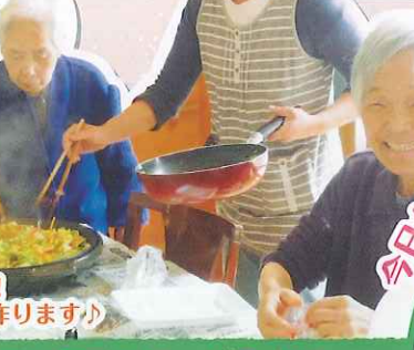
おいしそうな匂いがしてきそう!! 昼食の焼きそばを一緒に作ります