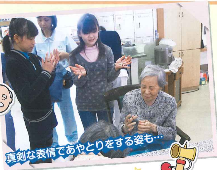
真剣な表情であやとりをする姿も...

二月二十三・二十四日の二日間、清須市立古城小学校の四年一組・ 二組のみなさんが庄内の里へ体験学習に来て下さいました。 おはじぎやお手玉・あやとりでお年寄りの方々を楽しませて下さ いました。 お年寄りの方々も懐かしそうな 表情でとても楽しい時間となり ました。