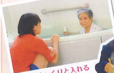
1人でゆっくりと入れるお風呂は格別です。