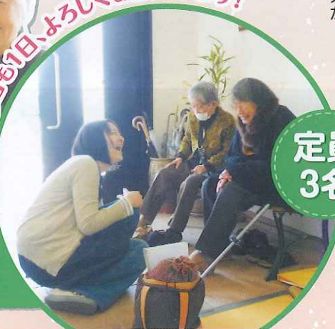
今日も1日、よろしくお願ひします!