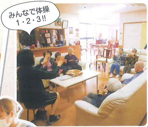
みんなで体操 1・2・3!!