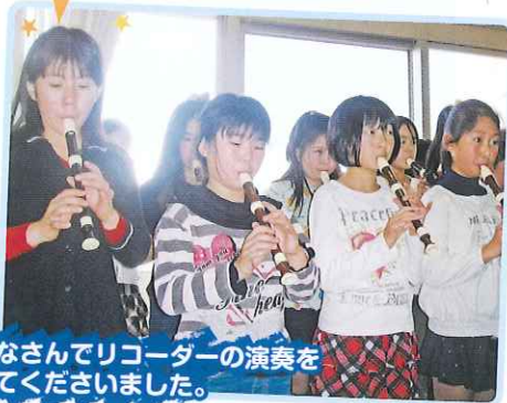
みなさんでリコーダーの演奏を してくださいました。