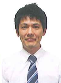
事務 利貞 鳩の丘 西沢