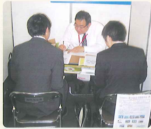
▲就職説明会(ウエルフェア平成22年5月)

学校訪問に出かけていたり、内外の就職説明会で、高齢者福祉の仕事の魅力をお伝えしています。現場のスタッフだからこそリアルに語ることができます。