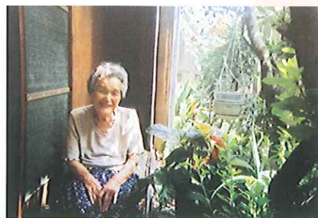
平成13年8月17日 94歳のとき、ヘルパーさんに 自宅の庭で撮っていただきました。