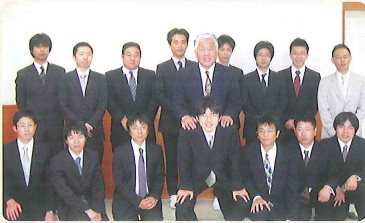
▲プロジェクトメンバー