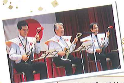
スコップ三味線の演奏でお祝いの席を盛り上げました。(庄内の里)