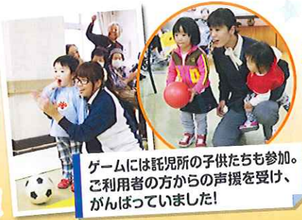
ゲームには託児所の子供たちも参加。ご利用者の方からの声援を受け、がんばっていました!