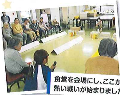
食堂を会場にし、ここから熱い戦いが始まりました!

今回、愛生苑では「交流」をテーマに、特養とデイサービス合同のボウリング大会を行いました。普段あまり接することがない方々で、はじめは皆緊張ぎみでしたが、ゲームが始まると他の方の応援をされたり、お話をされたりと、いつもと違った1日を楽しんで頂けたかと思えます。