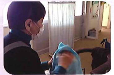
日々のボランティア風景