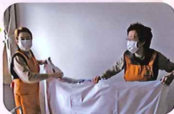
ボランティア風景

開所当時はモーニングに付き添ったり、買い物に同行するボランティアを行う。開所記念祭にはバザーを出店する等萩の里の行事に参加。平成20年頃からデイサービスでの踊り等のボランティアにも参加。