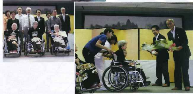
一宮市長敬老慰問

その後は記念撮影。みんなで写真撮影なんて久しぶりだと恥ずかしそうに笑ってみえたご家族の方々と、留袖に身を包み、普段よりも背筋がピンと伸びたご利用者。積み重ねて来た歳の重み、刻んできた人生の深さがそこにあったように感じました。