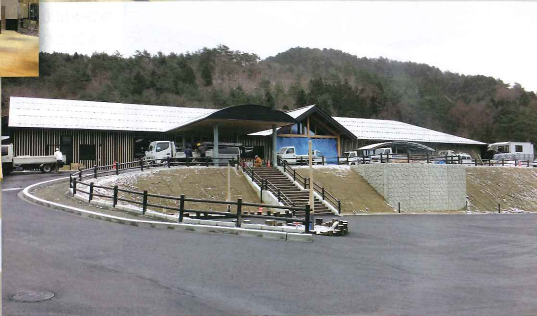
南信州 ねばねの里「なごみ」 住所 長野県下伊那郡根羽村3015番地362