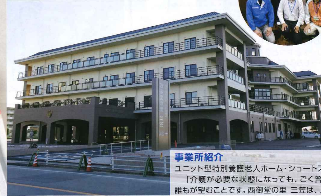
西御堂の里 三笠 住所 一宮市萩原町西御堂虫祭1番地