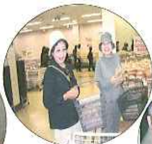
えびせんべいの里