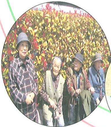
「バスはまだ？」と待っている所です。