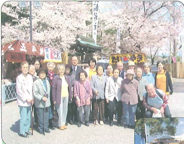
雨が突然止んだので、バスから降りて桜をバックに記念撮影。

大口町と犬山に桜を見に行きました。初日は突然強い雨に降られてしまいましたが、それでも車の中から見る桜の花は、とても艶やかで綺麗でした。また二日目はとてもいいお天気に恵まれ大きな桜の下でそれぞれに記念撮影を撮りました。両日とも、お花見弁当を持参でとても楽しく美味しいひと時を過ごすことができました。