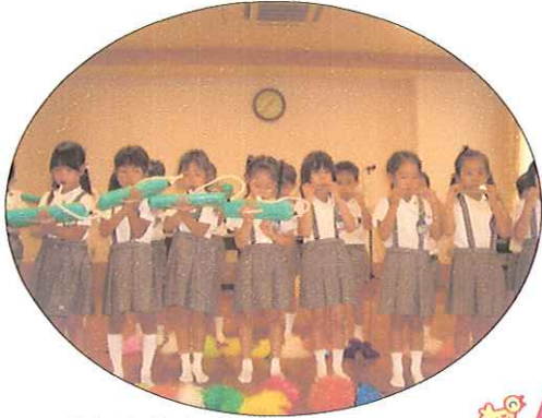
「♪きらきらぼし」 とても上手でした。