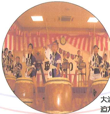
大治太鼓の皆さんによる 迫力ある演奏でした!!