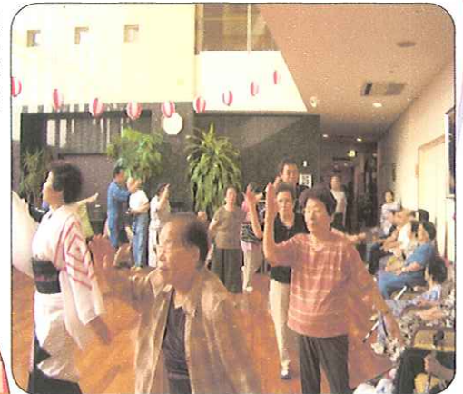
たくさんの方参加され、 賑やかな盆踊りとなりました。

今年の夏祭りも2部構成で行いました。縁日には新しいものを取り入れ、楽しんでもらいました。大に行われた夏祭りも最後は恒例のナイアガラの花火で幕を閉じました。