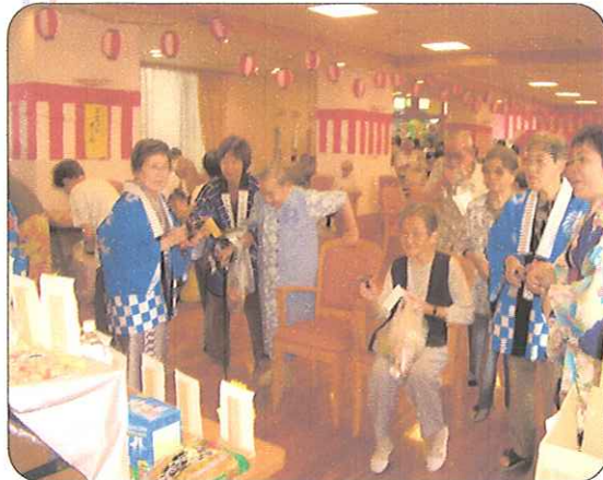
鉄砲です。 うまく当たるかな~!?

今年の夏祭りも2部構成で行いました。縁日には新しいものを取り入れ、楽しんでもらいました。大に行われた夏祭りも最後は恒例のナイアガラの花火で幕を閉じました。