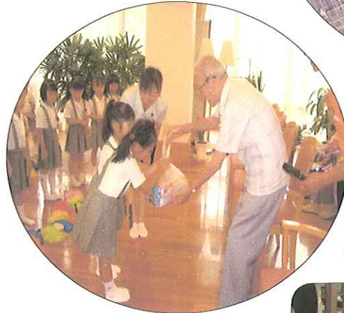
「今日はありがとう。 また来てね!」と プレゼントを渡しました。