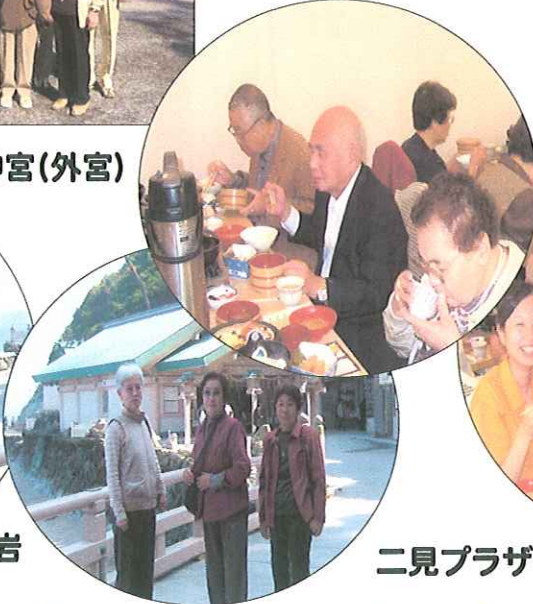
二見プラザで昼食