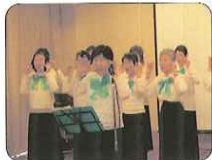
*笑顔、の手話です。 「♪おはなが わらった」

地域のコーラスグループ「ふれあいコーラス」の皆さんに手話付きで歌って頂きました。懐かしい曲と一緒に歌ったり、簡単な手話を教えて頂きました。何個覚えていますか？