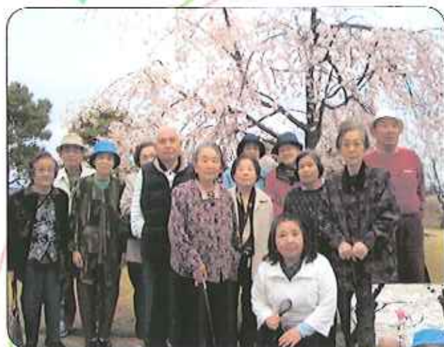
桜をバックに記念撮影