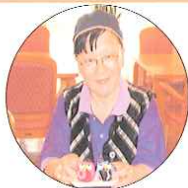
「どう？可愛いでしょう！」

同じふくろうを作っているのですが、個性豊かな表情のふくろうが出来上がりました。そして皆さん自分の“子”が一番かわいいとわが子自慢に花をさかせていました。