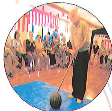
新しくスイカ割りを行いました。 上手に割れるかな??