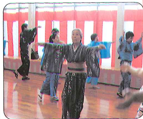
たくさんの方参加され、賑やかな盆踊りとなりました。

今年の夏祭りも2部構成で行いました。縁日では新しいものを取り入れ、楽しんでもらいました。も盛大に行われた夏祭りも最後は恒例のナイアガラの花火で幕を閉じました。