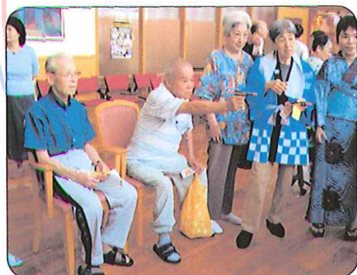
鉄砲です。 うまく当たるかな~!?