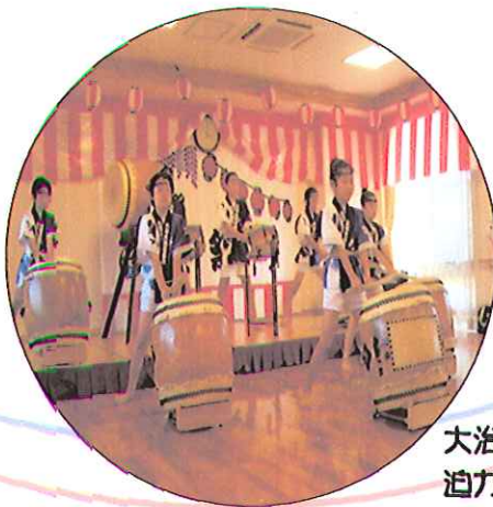
大治太鼓の皆さんによる 迫力ある演奏でした!!