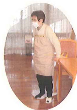
生地を踏んで、まとめるを7回繰り返します。