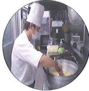
次の食事の仕込み中です。