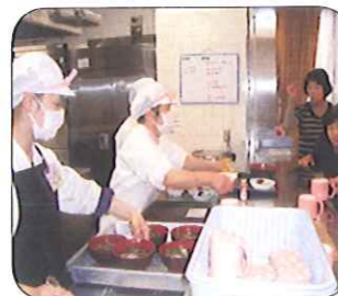
食事の配膳です。一人一人に挨拶を交わし、お膳が受け取りやすいように、気を配っています。