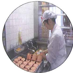
毎日、漂白につけています。