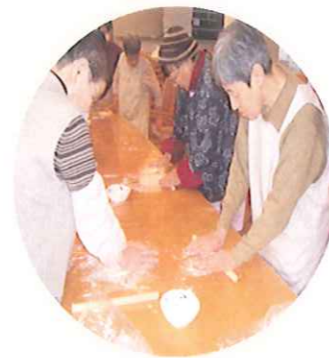
生地を厚さ3mm程度まで延ばします。