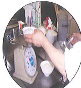
ご飯は、普通/軟飯/お粥、から選んで頂いております。各自ご飯の量も対応しています。