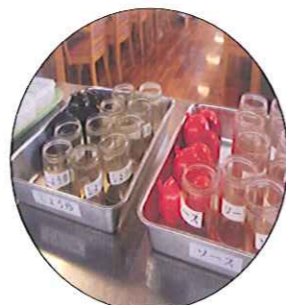
毎日容器を洗い、入れ替えをしています。

厨房さんのお仕事 厨房の皆さんが、普段どんなお仕事をされているかご存知ですか？ 今回、厨房さんの一日を取材しました。