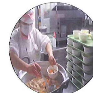
盛り付けには細心の注意を払っています。