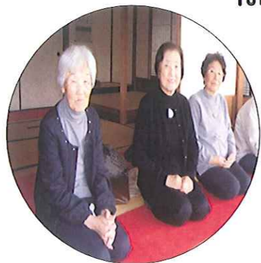
若水庵にてお抹茶を頂きました。