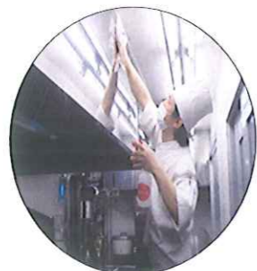
暇をみつけては、こまめに清掃しています。