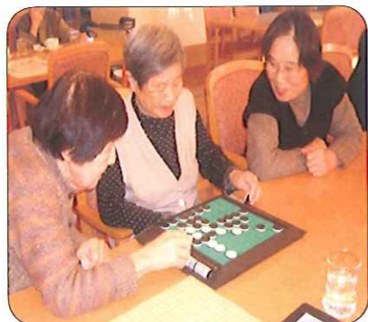
今のところ黒が優勢かな...