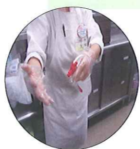
盛り付けや配膳時には、必ずアルコール消毒を行っています。