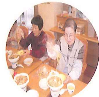
味噌煮込みうどんの完成です。美味しそうですね。