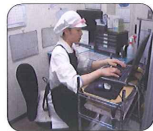
パソコンで食材の発注や献立を作成しています。