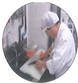
多い時で30本は切ります。