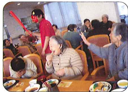
すごく楽しそうですね♪

豆まき 2月3日(金) 今日は節分です。お昼時間に豆まきを行いました。鬼の格好をした職員めがけて「鬼はー外」。豆を当てられた鬼は退散していきました。