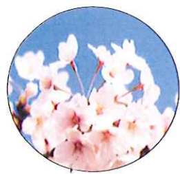
染井吉野 (シメイヨシノ) 日本全域で一番多く見られる桜です。