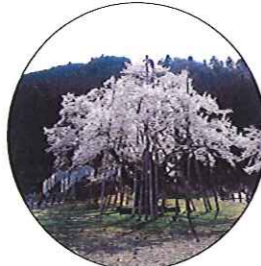
根尾谷 淡墨桜 (ネノイタニ ヨシヅメザクラ) 岐阜県本巣市 樹齢1500年以上