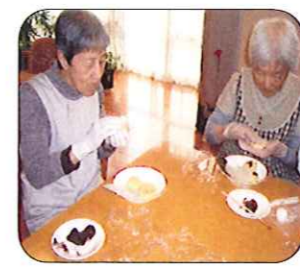
餡子を入れて生地を包んでいきます。