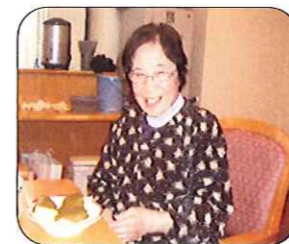
桜まんじゅうの完成です♪