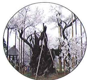
山高 神代桜 (ヤマカ シンダイザクラ) 山梨県北巨摩郡 武川村 樹齢2000年以上