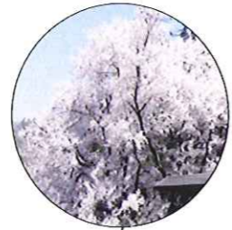
江戸彼岸桜 (エドヒガナザクラ) 花が咲いた後、葉が出ます。