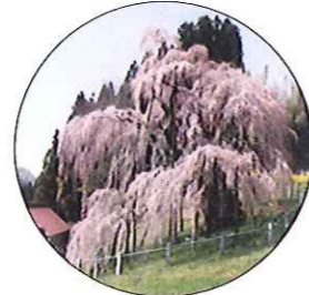
三春 滝桜 (ミハル タキザクラ) 福島県田村郡 三春町 樹齢1000年以上