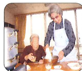
共同作業で生地を作ります。