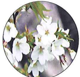
大島桜 (オオシマザクラ) 染井吉野のお母さん。桜餅を包む葉に使用されています。