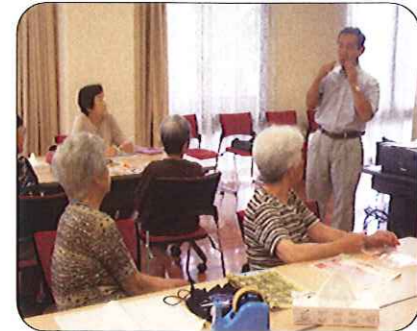
講師の先生から作り方を教わっています。