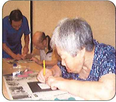
線にそって切り抜いていきます。