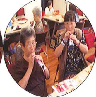
音がなりました♪人によって音色が違いますね。