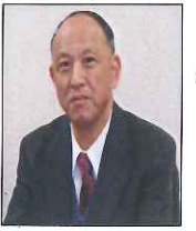
社会福祉法人愛江会 理事長