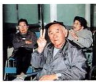
素晴らしい感動される利用者を見て、私共職員も来てよかったです。帰って

武豊市民会館ゆめたろうプラザが、昨年少しづつできあがって来るのを、送迎車の中から眺めながら、「行ってみてみたいなあ。」「中を見てみたいなあ。」の声にお応えして、見学会を計画しました。2日に分けて出かけましたが、初日は9割程の利用者が出かけ、予想以上の盛況ぶりでした。当日は、トルベイントの展示会が催されていました。とても