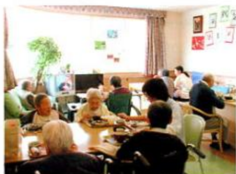
▲昼食の様子／職員も一緒に食べます。

昨年の9月1日より、渥美福寿園にてユニットケアへの取り組みを始め半年が過ぎようとしています。今までにできなかったご利用者とのふれあい、寄り添うケアができるようにということでスタートしました。ご利用者のことをよく知り、その方のペースに合わせて生活スタイルが順々にできてきました。