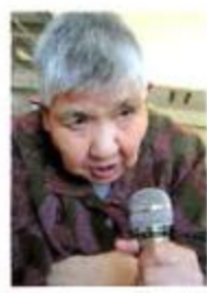
れているクラブの中で一番人気なカラオケ

クラブです。皆さん流行の曲から懐かしい曲までとても上手に歌われています。一番人気があるクラブとしての理由は、第二、第四とボランティアで先生が来てくれる事です。入所者の皆さんが知らない曲を丁寧に教えてくれたり、先生も時々歌ってくれたりしてわきあいあいと楽しんでいます。