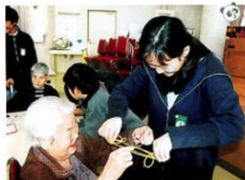
生徒さんと楽しくあやとり

1月20日、大林小学校の生徒さんが30名来園され、入所者の皆さんに歌と紙芝居を披露、けん玉やお手玉、玉すだれ等、昔の遊びを行いました。生徒さんは日頃の練習の成果を一生懸命発表された、入所者の皆さんも昔の懐かしい思い出の遊びを楽しみました。入所者のひとりには、昔の思い出話をされ、生徒さんたちほうん、うんと興味深く聞きいっていました。利用者、生徒の皆さん共に楽しい時間を過ごす事ができ、充実した一日となりました。