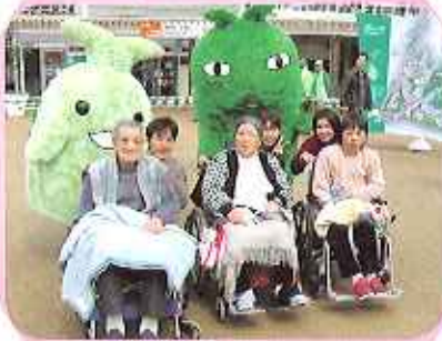
モリゾー・キッコロと撮りました!