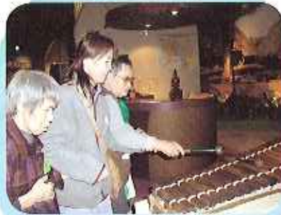
アフリカ館にてアフリカの楽器を演奏中♪