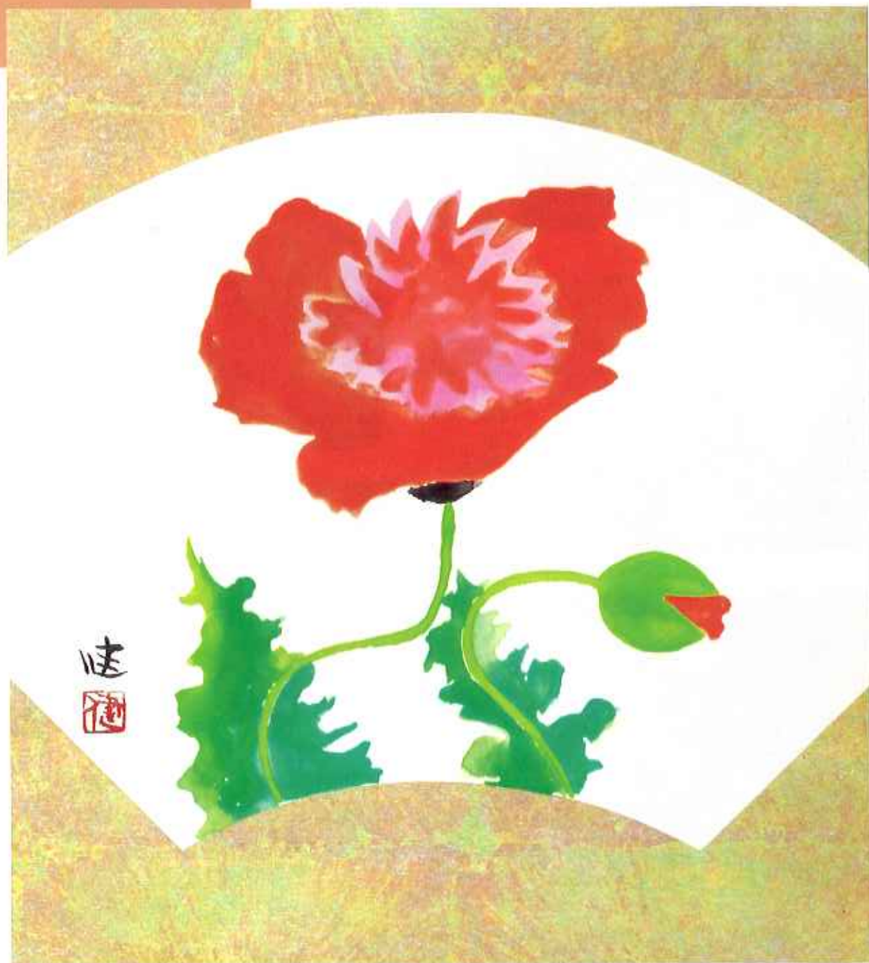
「芥子(けし)」 作：鈴木健夫さん