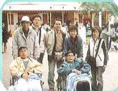
ひと足先に海外旅行気分?