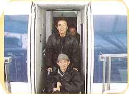
ドキドキ♥リニモ初体験