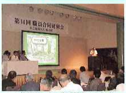
▲施設長による実践発表の様子

7月24日(日)、ホテル口航豊橋において、第14回目となる職員合同研修会が全施設252名の職員が参加し開催されました。今回の主テーマは、「民間企業に学ぶマーケティングと事業戦略」そして「ISO認証取得に向けて」の2つの講義でした。またその後、実践発表として、各施設での取り組みを施設長によるリレー方式で発表を行いました。これは昨年とリまとめました事故ヒヤリハット報告、利用者満足度調査の結果から問題点を洗い出し、改善していくということ。1年前からその取り組みが行われていました。職員にとっては各施設における課題や取り組みがよく分かり大変参考になったという意見が聞かれました。この研修を通して更なるサービスの向上につなげていけたらと思います。