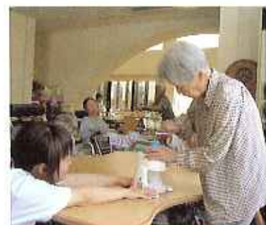
氷をかく姿は真剣そのもの!

8月に入り、まさに夏本番。昔から、夏と言えば、海とかき氷ではないでしょうか。ということで、特定施設の入居者の皆さんに楽しんで頂きました。