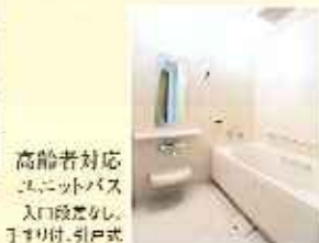
高齢者対応 モニットバス 入口段差なし 1より付、引戸式