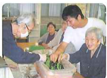
デイサービスきぬうら