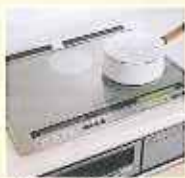
IHシステムキッチン 見出しのよい対面キッチン

5月に入居受付を開始しました「福寿」は、徐々に入居者の方の受け入れをしております。まだ若干の空室もございますので、一度、ご見学してはいかがでしょうか。お待ちしております。