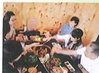
みみゆらぐ 観味悠楽

大会、ナゴヤドームシーズンシートなど……。その中に職員サークルがあります。福寿園も施設が増え、施設が違うということでも会うこともない職員もいますが、その解消策のひとつにもなっています。なによりも、職員がリフレッシュすることができ、翌日に笑顔で出勤できればと思っています。そんな職員サークルを紹介します。