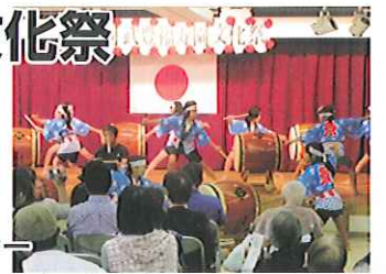
第10回武豊福寿園文化祭「和太鼓演奏」