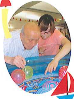
武豊福寿園デイサービスセンター