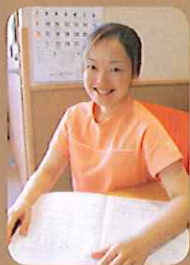
芸術大卒です。子育てをしながら趣味のカメラを楽しんでいます。占いも大好きです。