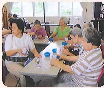
ケアハウス きぬうら