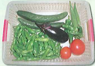
おいしそう!大満足!!