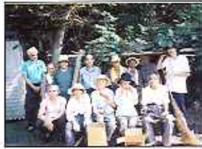
ケアハウスの畑にて