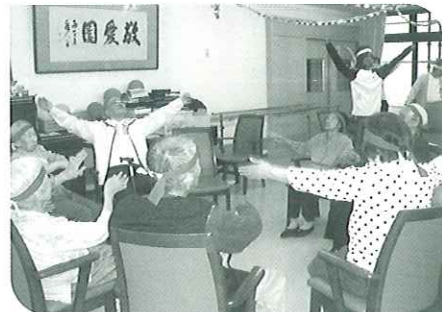
運動会前の準備体操。