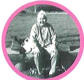
「私も写真撮って」と、とてもいい笑顔です。

9月〜11月にかけて、外出しクに出かけています。公園に行く前に、コンビニで好きなお菓子や飲み物を選んでもらい、いざ公園へ。ぽかぽかな陽気の中、まずは散策。四季折々の風景を目で楽しんでもらいました。その次は、皆さんお楽しみの「おやつタイム」自分で選んだお菓子を外で食