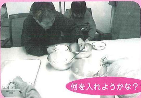
何を入れようかな??

厨房で作っていただいた、「ババロア」「ゼリー」に何種類かのトッピング用のフルーツを準備。好きなフルーツを自分で選んでもらう「おやつバイキング?」をしました。りんご・ミカン・バナナ・そして