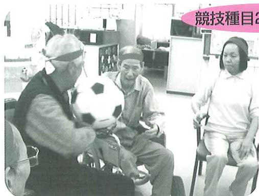
「いくぞ!」いつもは穏やかな利用者も…この時ばかりはこんなに真剣な表情。