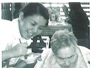
職員も一緒に笑顔になっちゃいます(^^)