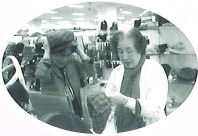
これ、私に似合うかしら?