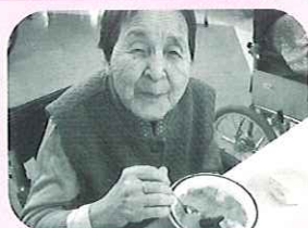
おいしくてつい笑顔(^^)