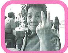
「おいしいよ」とピースサイン!

べるとまた一味違ったおいしさに自然に笑みがあふれてきます。天候の悪い日には「キャッツカフェ」へお出かけ。また、違った雰囲気皆さんドキドキ。でもメニューを見ると、表情がにこやかになり、気に入ったメニューを注文。パフェにぜんざいなど、色鮮やかなデザートがテーブルに並んだようです。