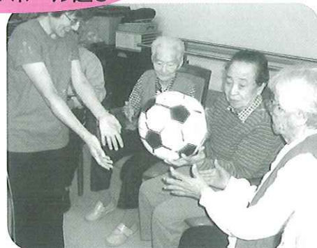
こちらはおしとやかに。でも確実に運ばれています。