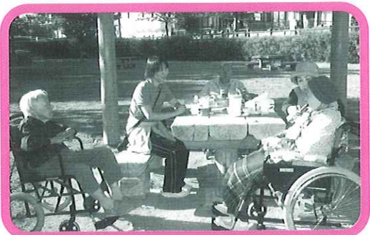
気持ちが和みますね