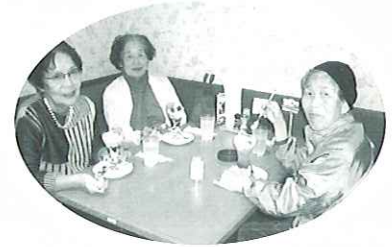
喫茶店でひと休み。あーおいしい!

毎週木曜日は施設の車で買い物へ出かけます。食品を買ったらすぐに帰りたい人や、隅々まで店内を見たい人、お茶でも飲みたい人や、隅々まで人など様々です。居室内に閉じこもってしまふ事は良いことではありません。商品を見たり、何か買おうかと考える事がよい刺激になります。また、店内を見て歩くことで、運動にもなります。せっかくなので、ゆっくりのんびりと買い物を楽しんでください。