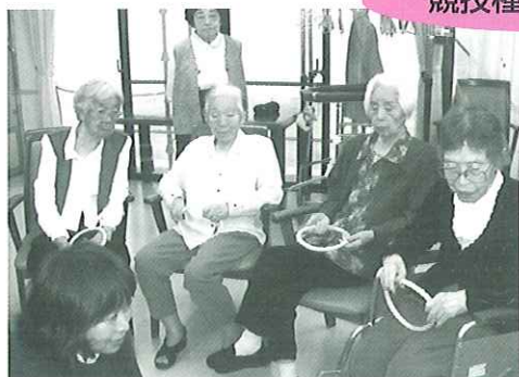
不安な表情で他の利用者の輪投げを見守っています。内心ドキドキです。