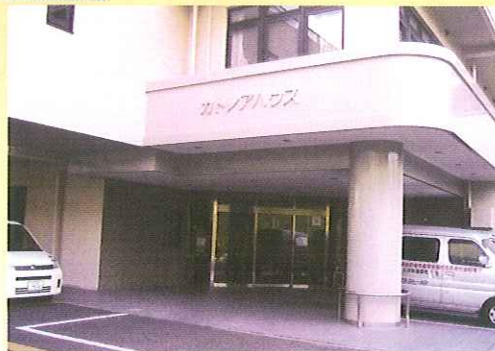
カトレアハウス入口