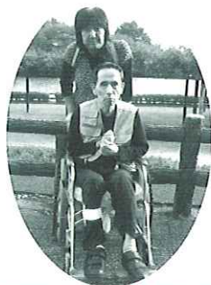
家族さんも参加して下さいました。仲良し夫婦でハイ! ポーズ