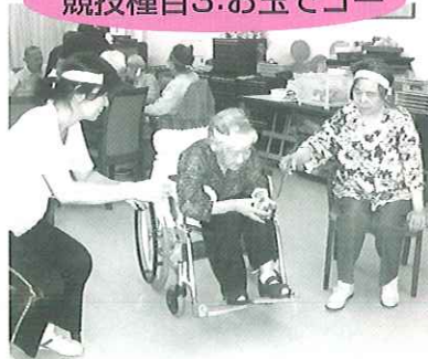
実習生さんが考えたゲームです。利用者さんには少し難しそうです。