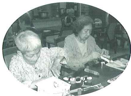
運動会の飾りつけを作っています。真剣です。

10月上旬の一週間「秋の運動会」を行いました。毎回紅白に分かれているいろいろな競技に参加していただき、それぞれ力を合わせ相手チームに負けないようにと、がんばって見えました。自分のチームの勝利が告げられるたび、大歓声が湧き上がっていました。楽しく体を動かした後は全員で秋の歌を大合唱。「とても楽しかった」と大好評の運動会でした。