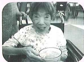
「どう?おいしそうでしょ。早く食べたい!!」