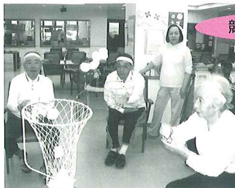
団体種目で一番盛り上がる種目の一つ。3個一緒に投げる利用者さんも…