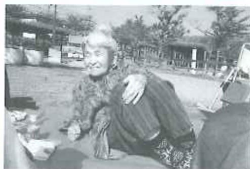
春のそよ風に吹かれ、気持ちよさそうに寛いでいますね。