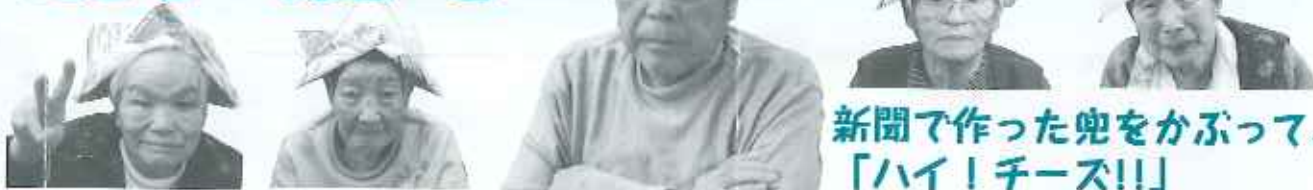
新聞で作った兜をかぶって、「ハイ！チーズ!!」