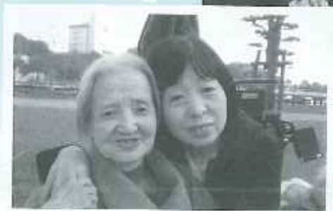
職員との2ショット写真ですが、親子みたいにみえますねえ〜(笑)