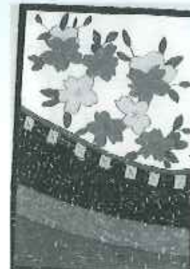
はり絵で作った花札の桜です。