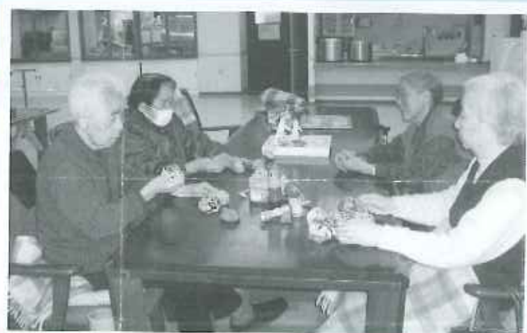
懐かしいお正月の遊び「昔はお手玉得意だったのよ?」