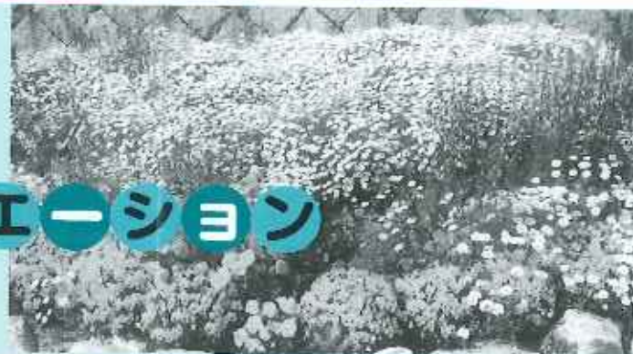
城山公園へ出かけました。春の暖かい陽気の中、藤の花や色とりどりの花々の風景を楽しんでもらいました。