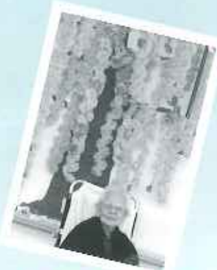
手作りのしだれ桜が満開です。