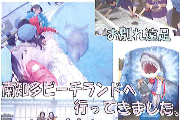
南知多ビーチランドへ行ってきました。