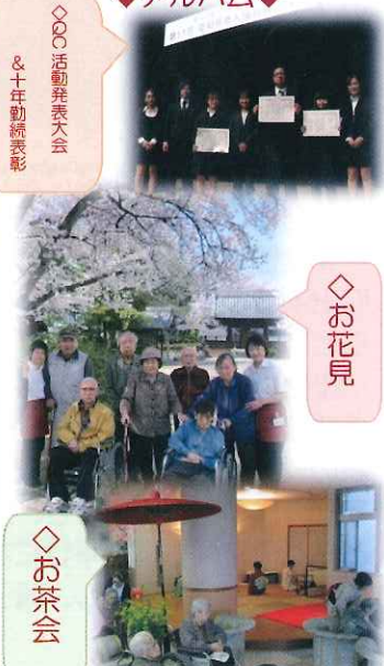
◇○○○活動発表大会 & 十年勤続表彰