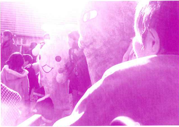
話題の人にご対面

三月十九日、愛・地球博長久手会場の内覧会にご招待頂き、前山・板山両らく楽のお年寄りが行ってきました。会場のあまりの広さ、内覧会というのに入場者数はなんと、五万六千人、常滑の人口と同じだけの人が来ていました。2〜3時間の待ち時間のために見学を断念したパピリオンもありますが、福祉優先で入館