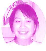
百合草 愛 1F特養