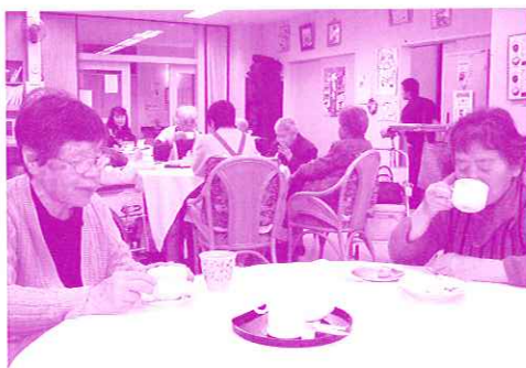
あたたかいコーヒーのひとつき

むらさきデイサービスでは、みなさんに落ち着いたひとときを過ごしていただく為に、毎月5のつく日をコーヒーデイとして、おやつ時間をコーヒーをお出ししています。