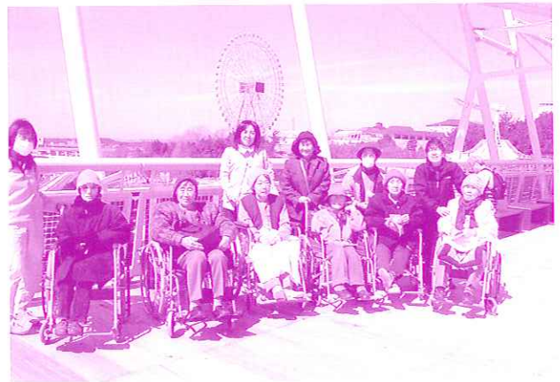
万博に行ってきたよ

させてもらったパピリオンで楽しく過ごすことができました。日立館では最先端技術で動物に触れたり、光と映像に一喜一憂。NE DOパピリオンでハイテクロボットの見学や、3Dハイビジョンシア