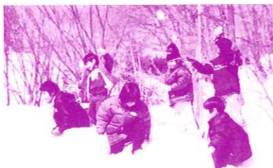
誰に投げたでしょう？

今年で2回目になる冬の雪山旅行。今年3月2日に3才から11才までの子ども16名と大人6名で、岐阜県にある高鷲まで行ってきました。3月だったので雪が残っているのか心配しましたが、ご覧の通りたくさん残っていました。道端に積もっている雪を見て「キヤー」、雪山に着くなり「キヤー」。子どものうれしそうな声を聞き、大人も「キヤー」。全員すぐに雪の中に走っていき、寝転がったり、雪だるまを作ったり。中には雪の中に足がはまり、びつくりして泣きだしてしまったり。今年も職員が子どもに遊んでもらいました。来年もまた遊んでね。