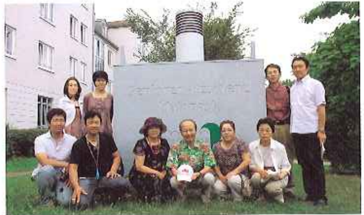
▲老人ホーム「シニア・レジデンツ・メインパーク」にて

ここは、ゲーテの生まれた町でもあり、現在も「ゲーテハウス」としてゲーテの家が残されています。