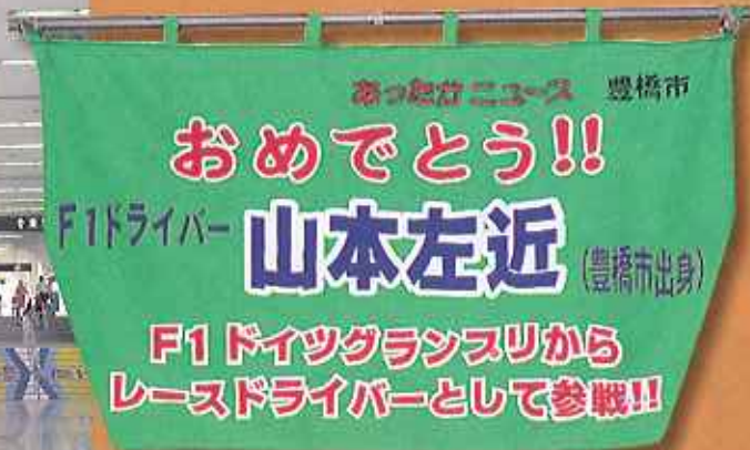
▲豊橋駅構内に飾られた山本左近選手応援フラッグ