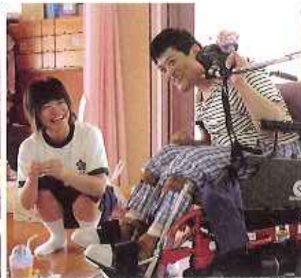
▲夏休みを利用してボランティア活動をする学生さん（珠藻荘にて）

ことを、私の言葉で伝えました。この活動を通して「ボランティアをやってみよう」という考えを持っていただくこと、そして何より、他人への思いやり」「共に生きることの大切さ」を知っていただきたいと思えます。