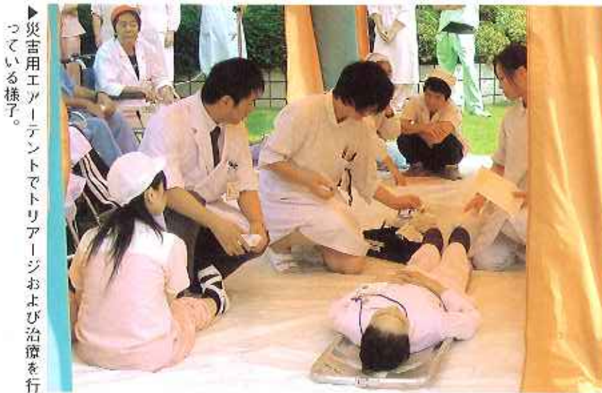
▶災害用エアートtentでトリアージおよび治療を行っている様子。