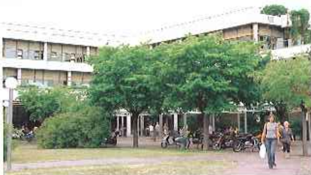
▲新市街にある医学部付属病院