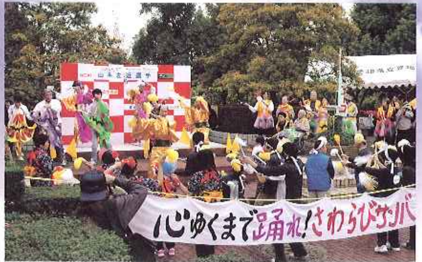
▲昨年の踊り「マツケンサンバ」の様子。子ども大人も一緒に楽しみました。