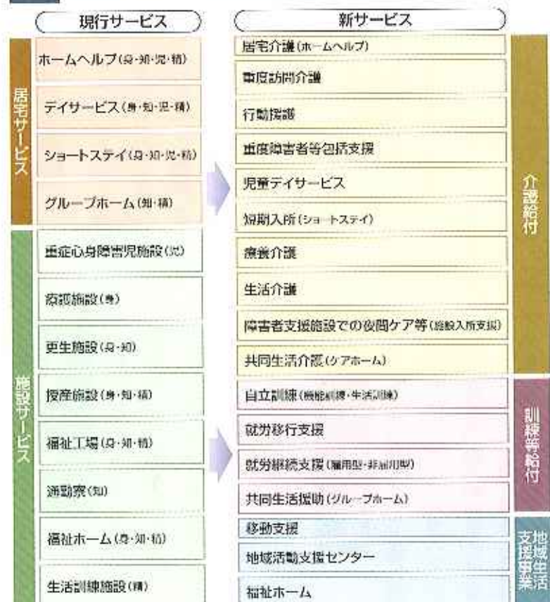
図1 ■ 福祉サービスに係る自立支援給付の体系