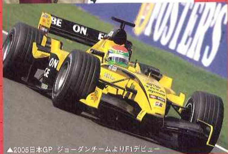
▲2005日本GP ジョーダンチームよりF1デビュー

に連れて来られ、F1ドライバーの夢を見た場所であり、またその夢をかなえた場所でもある。 左近選手は昨年、ジョーダンチームのテストドライバーとして鈴鹿サーキットでF1デビューを果たした。そして、そのときの走りはチームにとって重要なテスト結果をもたらすだけではなく、レギュラードライバーよりも早く走って見せ、関係者を驚かせた。