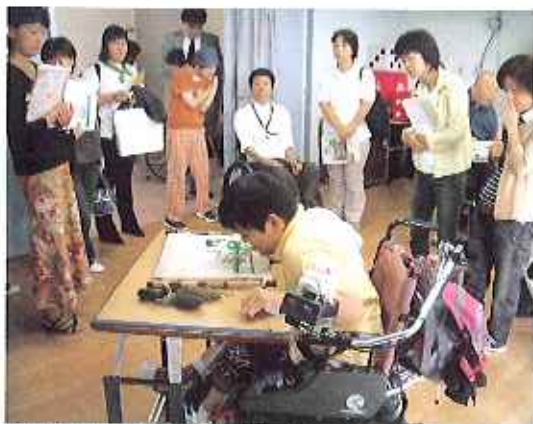
▲積極的な意見交換がされました。

また、珠藻荘の自治会ではこのような施設見学の時に「珠藻荘や障害者をより理解してもらえよう」と、自治会のメンバー白らが施設内を案内し、様々な活動を見ていただいています。今回も卓球バレーや絵画等創作活動などを見学していただきました。(右田)