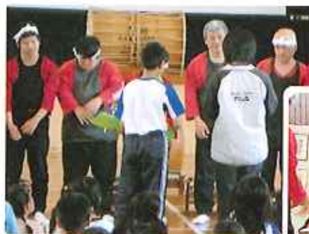
②お礼の言葉を述べる児童たち