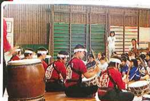
①キャラバン隊による太鼓の演奏