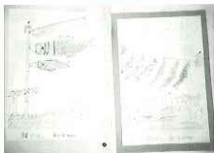
▲増田義幸さんの作品です。やさしさがにじみ出ていますね