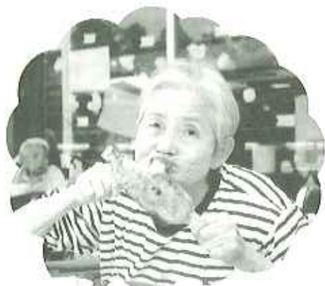
▲焼きたての五平餅はとってもおいしいね

けて、五平餅を頬張る姿があちこちで見受けられ、「本当においしい。」という声飛び交っていました。