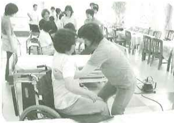
▲らくらく移乗にビックリ!

今後は、この研修を生かし、在宅における福祉用具の適切な使用方法を再度確認し、介護者も、利用者も身体を痛めない。という考えを基に、利用者皆様の自立支援に努めていきたいと思えます。