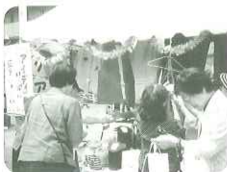
▲今年も大好評に終わりました。 お客さんかお店の前を並び 手作りの品々を手にとって買われました

好天に恵まれた五月十三日(金)、花フェスタ記念公園に出掛けました。花のミュージアムでは工夫を凝らした花飾りや、青いバラといたためずらしいものを見て、多彩な花と香りを十分に満喫。折しも当日、国内最大級の花の祭典が開幕し、秋篠宮ご夫妻の訪問もあり大変なごわいでした。「公園全体に手入れが行き届いていて美しかった。」「宮様ご夫妻を直に見た。感動した！」「満開のバラ