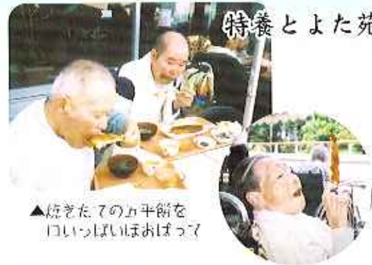
▲焼きたての粽を口いっぱいほおぼって