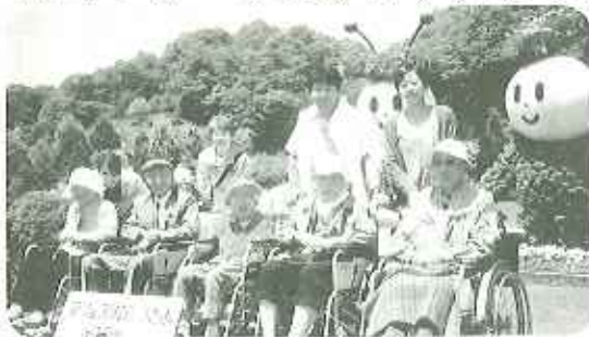
花と緑に囲まれて