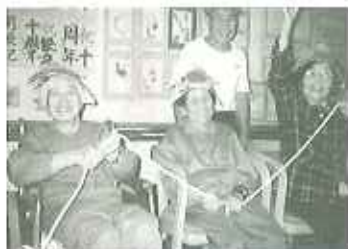
▲勝利の笑顔アでしょうか

お楽しみのゲーム大会は、「鯉の滝のぼり」です。バスタオルで作った大きな鯉の登場です。ウロコは皆さんに、作っていただきました。全員でロープを引き、どちらのチームが早く天井まで鯉を登らせるかを競争！赤かぶとと青かぶとを頭に気合が入ります。いざ、ゲームが始まると、ロープを反対に引いたり、まったり、ロープがたるんで上手く鯉が登らなかつたり、皆さん四苦八苦。その様子に大笑