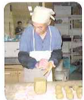
▲いつもありがとう