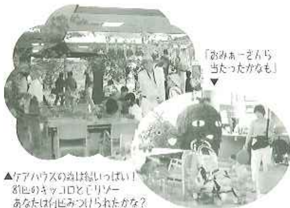
▲ケアハウスの森は緑いっぱい！ 緑色のキッコロとモリゾー あなたは何匹みつけられたかな？

五月二十八日(上)に行われた開設記念祭に、今年は少しでもケアハウス内を見て感じて戴こうと、万博にちなんだ「モリゾーとキッコロ探そみゃー！クイズ」を行いました。「自然と共生」のテーマに沿って食堂全体が利用者者と職員の手で緑いっぱい森に変身。その中にとろせましと八十一匹のモリゾーとキッコロが顔をのぞかせていました。 また、ケアハウス毎年恒例の手