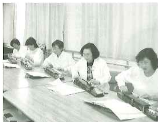
▲昔を思い出しました

利用者の方の中には、「ふるさと」を聞き、昔のことを思い出し涙ぐむ方、大正琴の音色にあわせ口ずさむ方もみえ、それぞれに演奏を楽しまれました。コスモスの皆さん、素敵な演奏をありがとうございました。