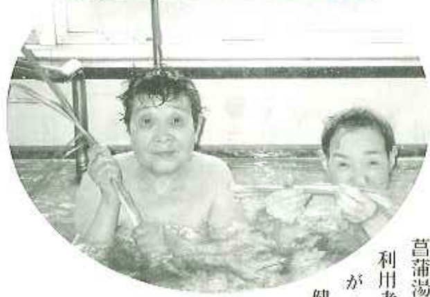
菖蒲湯の効能で、利用者の皆さんがますます健康で長生きされることを願っています。▲菖蒲湯につかっ今年も健康！