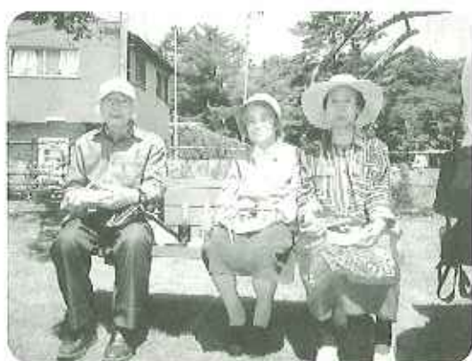
▲吉室の下で食べるお弁当は格別

現地到着後すぐにお弁当を広げ、外で食べるお弁当は美味しいね。いつもよりたくさん食べられるな。などベンチに腰かけ笑顔で会話もはずみました。午後からは、