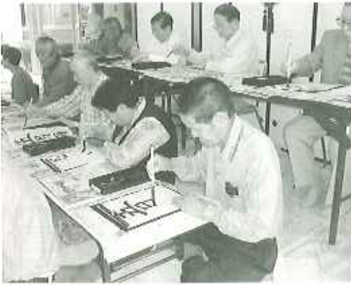
▲今日のお題は難しいなあ～