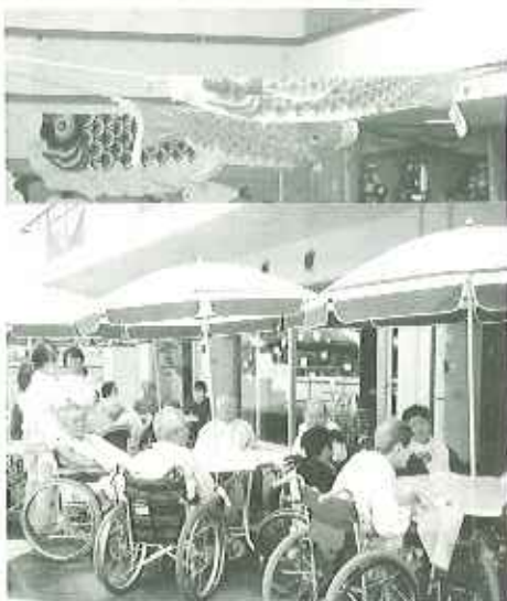
▶古き下、こいのほりも気持ちよく泳いでいます