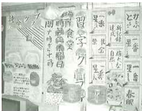
▲毎日の成果を披露!

天井に一番星! 今年は、「一番星」をテーマに取り組みました。玄関ホールの天井には利用者、職員が思い思いの一番星を作り、そこに誰にも負けない自分の一番星を書き添えて吊りました。 玄関を進む廊下の壁には星座がきらびやかに光を放ち、その横には色鮮やかに生けられた生け花クラブの作品を並べました。 また苑内には、今年もショートステイモデルルームをセットし、地域の皆様へのピールとして、