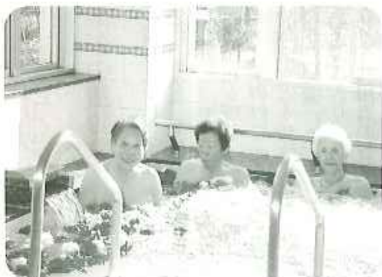
▲美肌効果バウゲン