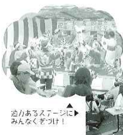
▲迫力あるステージにみんなくぎづけ!

その後、リズムプリンスの皆様によるモダンジャズバンドが行われ、生バンドの演奏を日頃なかなか聴く機会が無い利用者さんにとつては、思い出に残る演奏になったと思います。心を唄う会の皆様によるすばらしい歌声の力