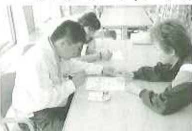
▲なかなか難しいぞ

今後、ご利用者の関心や要望をとり入れ、様々な作品作りや、お金の計算など、幅広い視点から、学習クラブを行なうてまいります。