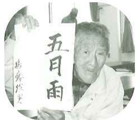
▲じょうずに書きました

方(約二十名)が参加されており、季節に合った題字を考え、季節感も感じてもらえるよう考慮しています。