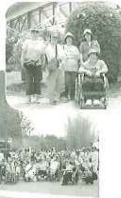
▲136名万博会場に到着！

昼食は各々が日本ゾーンのフードコート内で食べました。いつもとは違った雰囲気の中の話はとてもいい思い出になったことと思