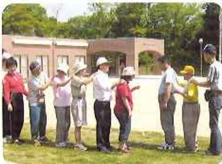
▲向いあって、じゃんけんぽん!