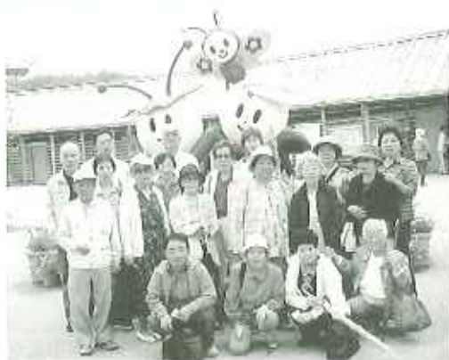
▲かわいいキャラクターど

五月十一日(木)、花フェスタ記念公園で開催中の「花フェスタ二〇〇五ぎふ」へ入居者十六名と出掛けてきました。現地に着いた途端、雨が降り出して来ましたが、屋根の設置されている所を通ったり、ロードトレイン「花ボッポ」で広い会場をゆつくりめぐるとなっていて良かったです。バラは咲き始めて残念でしたが、斜面にはたくさん花が咲き乱れていました。また、「ハンカチノキ」の並木道ではまさに木にハンカチがぶらさがっているさまをみて驚きました。花の