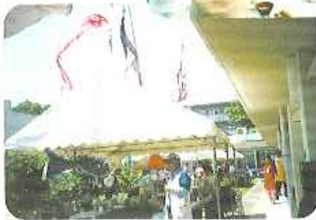
▲空高くこいのぼりが泳いでいます