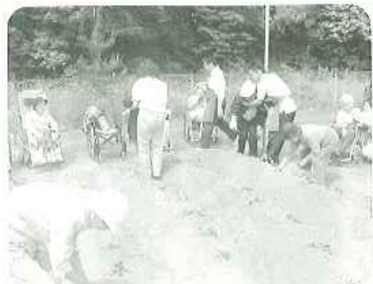
▲一生懸命苗を植えました

大きなさつま芋が収穫できることを願いながら利用者、五名が畑で、さつま芋の苗約八十本を一本心を込めて植えていきました。秋にはまた益富中PTAボランティアの方々に来ていただき一緒に収穫を行なう予定です。皆さん