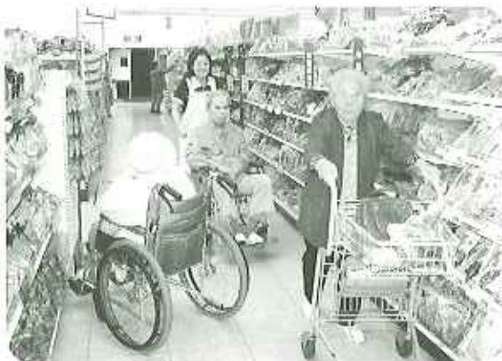
▲たくさんいい物が買えました

五月十一日(木)、十六日(金)の二日間、ジャスコ高橋店に買い物に出かけました。夏物の洋服や帽子をあれこれ試着しながら決め、百円ショップをめずらずらうに見て回られた方、おやつに晩ごはんのおかずにと沢山食材を買い込まれた方など皆さん思い思いのお買い物されました。婦りのバスではお互いの買った物について話はずみ、疲れもどこへやらの盛り上がりでした。