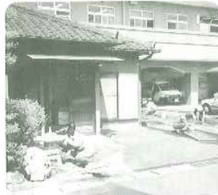
▲ピカピカに蘇りました