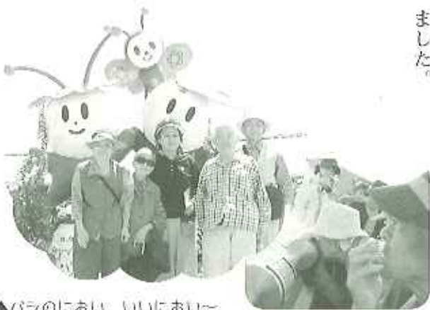
▲バラのにおい、いいにおい～