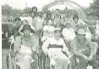
▲緑に囲まれて気持ちいい

六月一日（水）、利用者十五名、家族・ボランティア・職員を含む総勢二十八名で春日井市緑化センターへ行きました。この時期、見頃のバラが満開に咲き乱れ、様々な種類のバラを背景に写真を撮るために