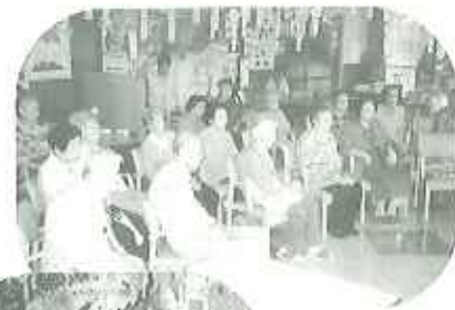
▲眼差しを めまいで 学んでい る皆さん

きたい。いつ役に立つかわからないしね。」と皆さんの健康に対する関心の強さに感嘆します。