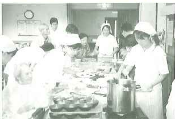
▲とれもおいしいそうまで移りしちゃう