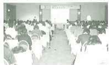
▲今回学んだことを生かしていきます

二日は分科会による研究発表で、我が春日苑から「ユニット活動」について発表を行いました。