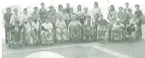
▲みんなで名古屋港水族館へ出かけました