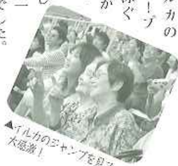
▲イルカのエジャンプを見て大感激!