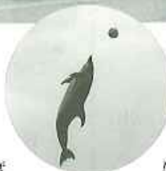
◀すばらしいジャンプカ!!

後、イルカのリョーヘーブールで泳ぐイルカがダイナミックにジャンプした瞬間、一同大感激でした。他にもフリスビーをキャッチする姿や、仲良く並んで飛び跳ねるイルカたちに、皆さん拍手喝さいで大喜び。賢く愛らしいイルカたちに、心癒されました。