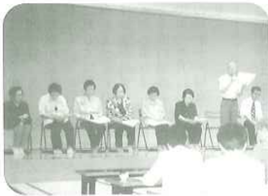
▲好きな作者を選び、思い思いに吟じました

利用者さんも出吟するコーナーがあるとのこと、皆さん緊張した様子で「ドキドキする。」「手が震える。」と話していました。いざ本番となると堂々とした態度で日頃の練習成果を充分に発揮できましたよう。発表会という目標に向けて一生懸命に練習してきた利用者者の皆さんは、発表が終わった途端に満面の笑みと、「達成した」と