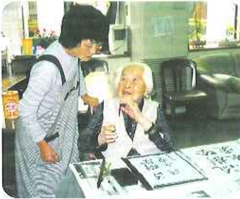
▲丁寧なご指導をいただいています

特別養護老人ホーム春緑苑には年間延べ二千人余りのボランティアさんが活動しておられます。その中でも「森の会」さんは会員数約三十名で、春緑苑最大の複合多機能ボランティアグループです。器楽を始め、ゲートボール、喫茶・生花・習字などのクラブ活動指導や、清掃、事務処理作業、その他開設記念祭など施設主催の