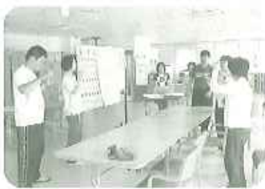
▶これからがんばります

お近くに障害をお持ちの方がおられましたら、ご紹介お願い致します。見学、質問等、どんなお待ちしています。