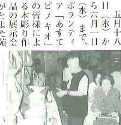
▲見とれちゃいます！

五月十八日(水)から六月一日(水)まで、ポランディア「あすてピノキオ」の皆様による木彫り作品の展示会がとよた苑デイサービスセンターで行われました。