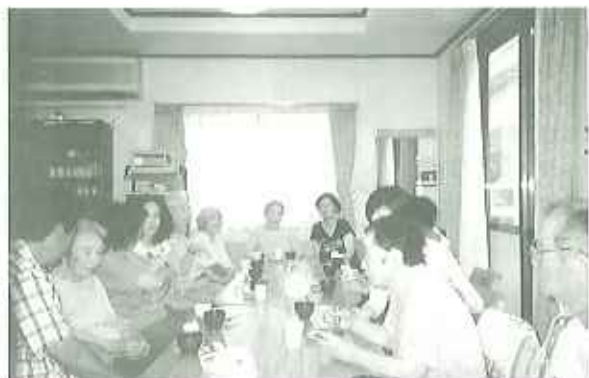
▲楽しいひとときを過ごしていただきました

第二部として、第一第二各グループホームに分かれて、茶話会を行いました。ご家族を、手作りおやつで迎えました。第一では白玉ぜんざい、第二ではプリンアラ