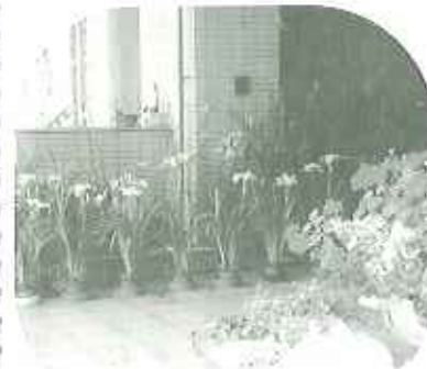
▲季節の花が お出迎え