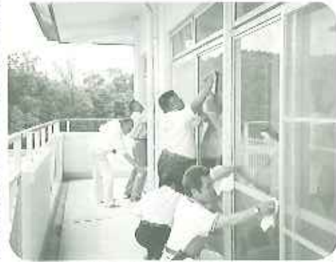
▲毎年お忙しい中ありがとうございます。これで気持ちよく過ごすことができます。