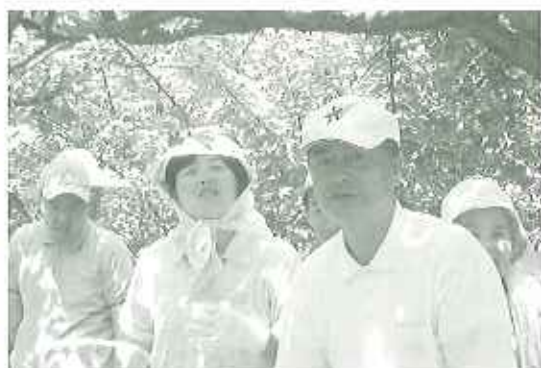
▲たくさん採ったぞ

六月十三日(月)、平芝公園へ梅狩りに行ってきました。サンホーム以外にもひまわり学園さんや無門さんなどが来ており、利用者さんは久しぶりに会えた仲間や職員と抱き合ったり、話ができたりしてとてもうれしうでした。 皆さんで豊田南ライオンズクラブの方が落としてくれた梅を夢中で拾ったり、木になっている梅を採ろうと少し高いところまで、生懸命手を伸ばして採ったり、楽しむことができました。