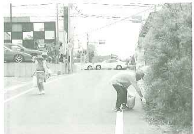
▶ゴミがたくさん落ちてるなあ