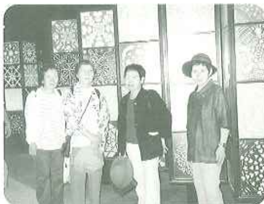
▲神秘的な世界の「大地の塔」

まずは、長久手会場とをむすぶゴンドラを日指し、瀬戸会場へ向かいました。瀬戸会場は、人込みもなく、立ち寄る所を捜しているど、「ここはメイン（会場）じゃないから行きますよ。」と先頭をきって誘導して歩く利用者さんの姿があり、利用者の方々に、日案内していただいたような気分になりました。そして、皆でゴンドラに乗り、地上からの高さに恐怖を感じながらも、名古屋市内や会