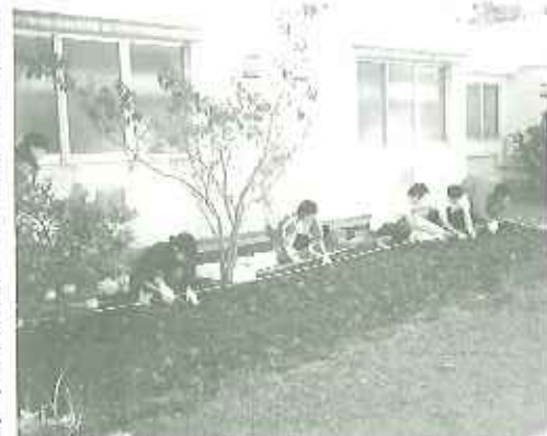
▲きれいな花に癒されま