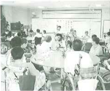
▲より楽しい生活に向けて議論を交わしました

今度は穏やかな時間が流れました。小憩の後、各テーブルから出された意見の発表や提案に対し、施設長から回答が行われました。回答に対しては利用者さんから歓迎の声が上がるものもあれば、すぐには結論が出ず、今後の課題となるものもありました。