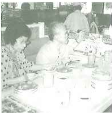
▲網れた手つきで好きなお寿司をいただきます

えびにたこにまぐろに穴子。「少しでもよいからお寿司を食べたい!」という利用者が集まり徳兵衛へいざ出陣!