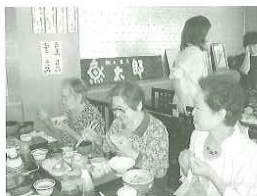
▲久しぶりの外食に大満足でした

今回のバスハイクは知多半島にある魚太郎で、ちよつと豪華なお昼ご飯となりました。あまり時間がとれず、あわただしい昼食となりましたが、大きな海老フライや刺身に皆さんご満悦。