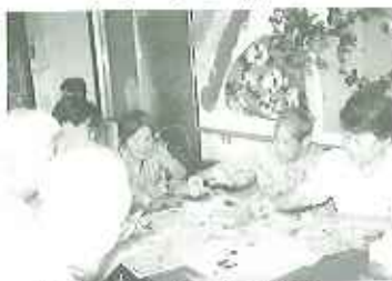
▲夏に向けてひまわり作り

この他にも利用者の方々の皆さんによる様々な作品が展示されていますので、ぜひご覧くださいませ。