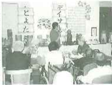
▶どれもステキな作品ばかりです

五月十八日(水)から六月一日(水)まで、ポランディア「あすてピノキオ」の皆様による木彫り作品の展示会がとよた苑デイサービスセンターで行われました。