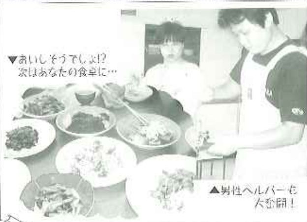
▲男性ヘルパーも大奮闘!

六月十八日(土)に坂下公民館にて調理実習を行いました。今回は、なす、ゴーヤなどの夏野菜をたっぷり使った料理やヘルシーな豆腐を使った料理を中心に、ヘルパーの苦手としたメニューも取り入れ、全十品を調理しました。これから暑くなると食欲がなくなりがち。そんなときにぜひ食べていただきたいと思う品々です。男性ヘルパーも積極的に参加し、皆さんのご希望にそえるよう、ますます腕を上げるヘルパーです。