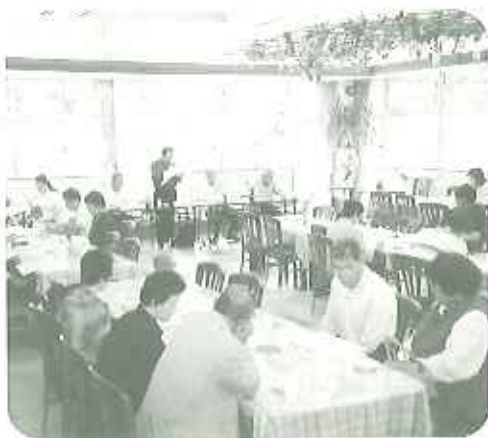
▶お忙しい中ありがとうございました。

出席いただきありがとうございます。今後ともご支援、ご協力をよろしくお願いいたします。