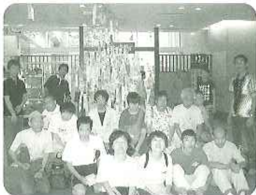
▲若いお母さん長久手温泉ござらっせ！

七月六日（水）、青空班の外出で長久手温泉「ござらっせ」に十二名の利用者さんと五名の職員で行ってきました。