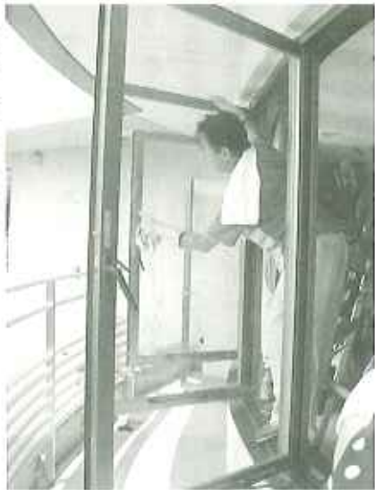
▶保護者公会长も大活躍

七月十八日(月)、海の日に、毎年恒例となっている大掃除と納涼バイキングが行われました。梅雨明け間近のうだるような暑さの中、参加していただいた四十名のご家族及び一般ボランティアの皆様、ありがとうございました。大掃除では、換気扇や網戸など、日頃手の届かない隅々まできれいにしておいただき、施設全体が一層明るさを増したように感じられました。