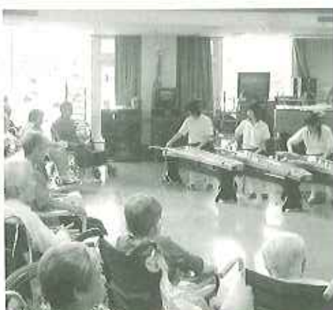
▶美しい琴の音に大満足でした