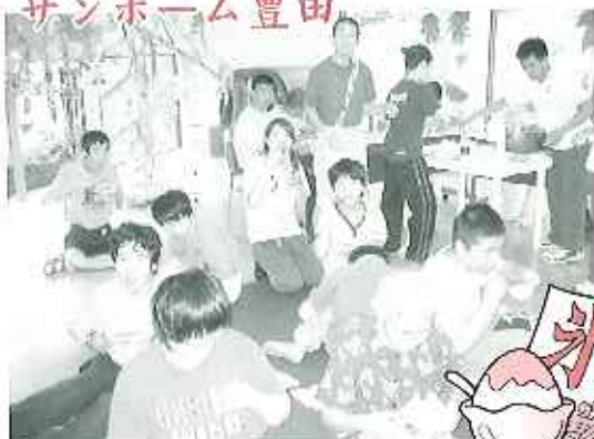
▲七夕会では歌やゲームを楽しみ、 最後にかき氷を食べました