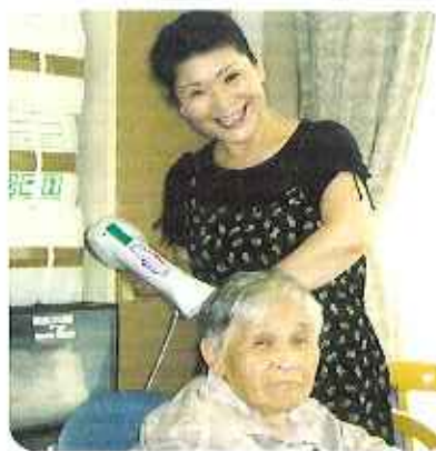
▲利用者さんも大喜び！

編集後記 とうとう暑い夏がやって参りました。体調を崩しやすい季節なので、夏バテには十分注意しましょう。夏バテを予防するには、ビタミン・ミネラルをたっぷり摂って、規則正しい生活を心がけることが大切です。 生活のリズムを守り、食生活に気をつけ、暑い夏を元気に乗り切りましょう。