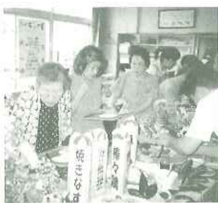
▲めずらしいメニューに興味津々

夏の天ぷらをたくさん食べた。」と満足したり…。おなかいっぱいの皆さん、たくさん食べた分、ケアハウスの夏を盛り上げていきまわしよう！