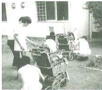
▲車椅子がピカピカに

福祉施設でボランティア活動をするのは初めてという学生さんもおられますが、福祉をより身近に感じていただく良いチャンスになればと思います。