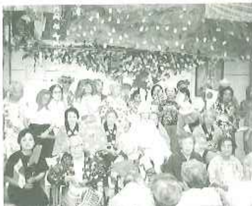
▲大役を終え、にぎやかに幹振り

今年の七夕会は… CMモデル、 「世界の国からこんにちは」で 楽しんで懐かしくみまわした