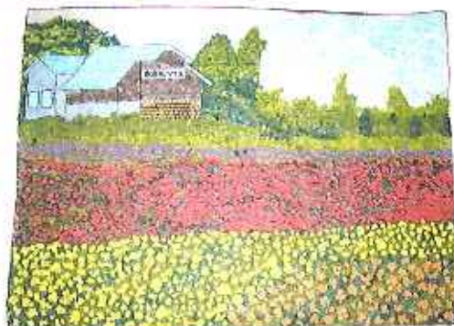
春緑苑デイサービス

利用者の皆さんは機能回復訓練の一環として、様々な作品作りに取り組んでいます。貼り絵は、共同で作られることも多く、力作揃いです！