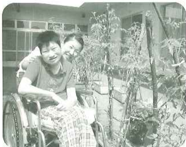
▶春日苑トマト畑にマ