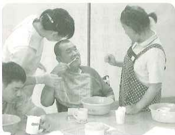
▶仕上げはブラッシング指導等、止しく仕上げてるかな?

情に変わっていました。その後、医師、歯科衛生士の方々によるブラッシング指導が行われました。染出しによって歯の汚れ具合を比較することができ、ブラッシングのやり方でこれほど、汚れがきれいに落ちるものなのだと感じるとともに、改めて、歯の大切さ、歯磨きの必要性を感じました。歯科医師会及び歯科衛生士の皆様には貴重なお時間を割いてご支援を賜り、本当にありがとうございました。