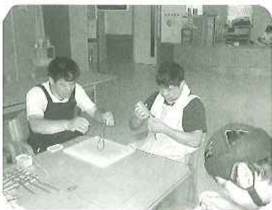
▶作るぞーかわいいコップ