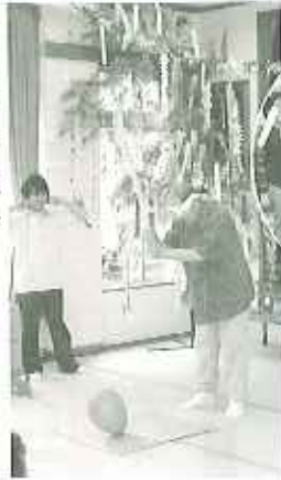
一回で割れるかな

「健康で長生きできますように」、「みんなと仲よく暮らしたい」、「おいしいものを腹いっぱい食べたい」、「長くここで暮らしたい」など利用者さんの願いはさまざま。七夕の日はお天気となり、みなさんの願いはぎゅっと届いたでしょう。また、七夕の日には風船をすい