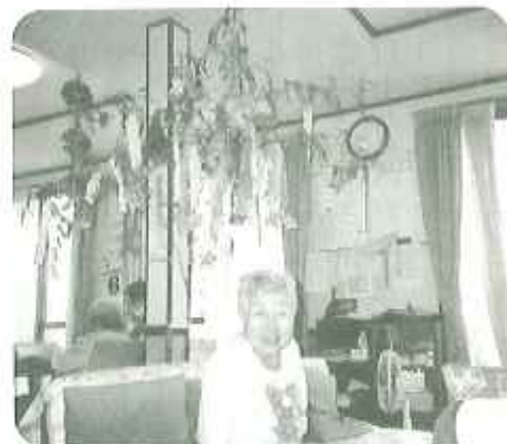
▲願いがかないますように...