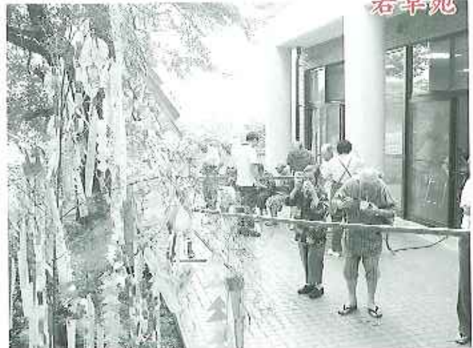
▲外での流しうめん！ 晴れてよかったね。じょうずにつかめるかな？