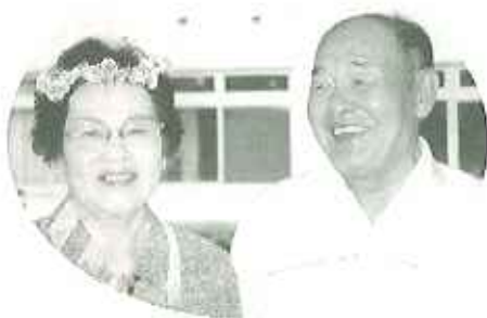
▲「はずかし〜わ〜」 「似合ってる〜」

ケアハウスでは、辞書のページや職員のデスクなど、いたるところに四つ葉のクローバーの押し葉がはさんであります。利用者のおさんが散歩へ行くたび「お土産」として持って来てくれたものです。