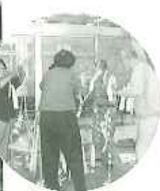
▲私の短冊は一番上につけよう...願いごとがかないますように!!!