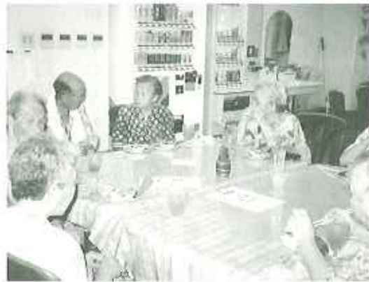
▲居酒屋「ケア」オープン!

おつまみには手作りのモロッコ風つくね・なすの揚げびたし・枝豆のセット、飲みものは自家製梅酒の注文が多く、また女性が多いため、美肌効果のある豆乳入り健康ジュースが好評でした。顔をほんのり赤らめて帰られる利用者さ