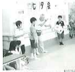
▲東山小学校の皆さんが 七夕会を 盛り上げてくれました