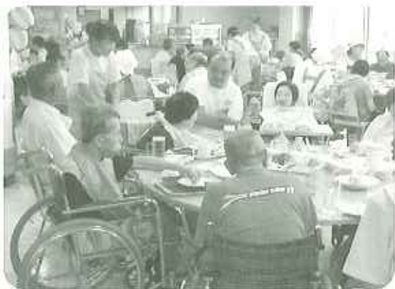
▲汗かいたあとは、みんな揃ってバイキング

大掃除が終わるといよいよ納涼バイキングで、利用者さん、職員も交わって和気あいあいの中、飲談と食事がすすんでいきました。一汗かいた後ののどをビールとジュースで潤していただき、