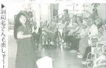
▶利用者さんも楽しんでました。