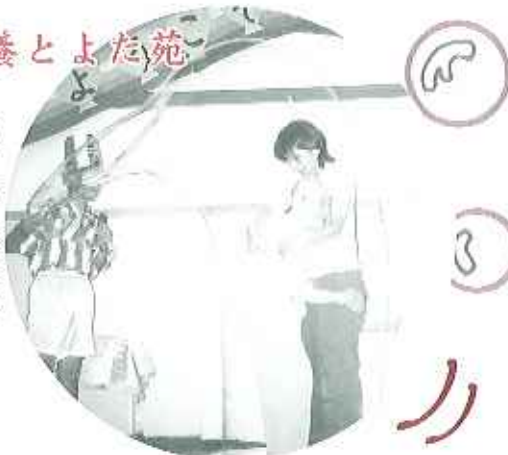
▶初！50歳にして シャボン玉の中に 入っちゃいました！