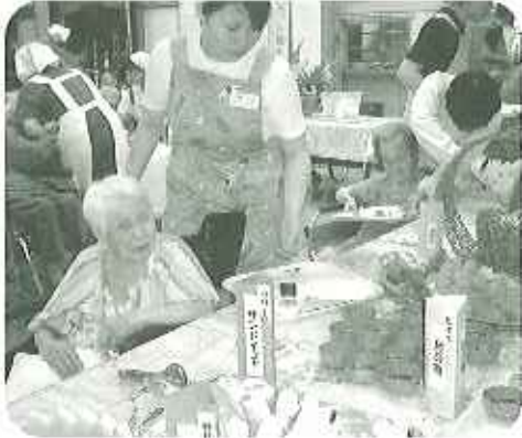
▲「どわにしよう 日移りしちゃうわ」