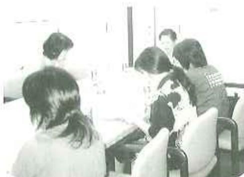
▲7月13日の介護者教室風景 みなさん真剣に参加しておられました