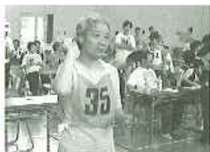
▲いけ!!!真ん中に当たった。