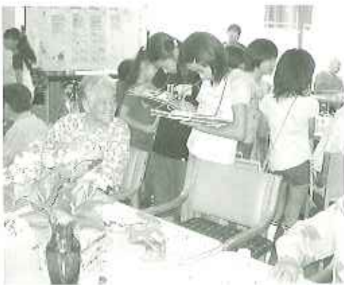
▲はじめはドキドキでした

七月二日(金)・八日(金)の両日、センター近くの梅坪小学校五年生の皆さんが来所されました。体験学習ということで、緊張がみだつたのでしょうか。おじいさん、おばあさんと一緒に暮らしたことのない子が多く、初めは戸惑う様子もみられましたが、「勉強は大変?」などと利用者さんから声をかけられると、ほっとしたように話が始まり、一転和やかな雰囲気となりました。最後には、生徒さん達が全員で合唱を披露してくれました。利用者の皆さんは「ありがとう」と拍手とともに応えていました。