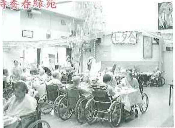
▲皆さんいつもよりちょっと豪華に お寿司を召し上がりました