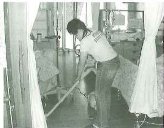
▶暑い中頑張っています

暑さに負けないためにスタミナをつけようと、七月十六日(火)、バイキングを開催しました。メニューの方は、大人気のアツアツ揚げたて大ぶらをはじめ、夏に欠かせない三色そうめん、新メニューの南豆腐腐など二十種類を超える料理が並びました。