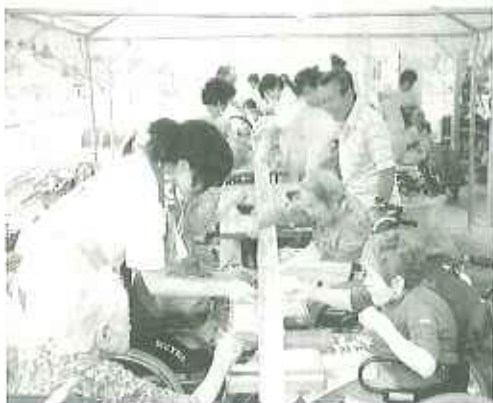
▲上手にそうめんをつかめるかなあ