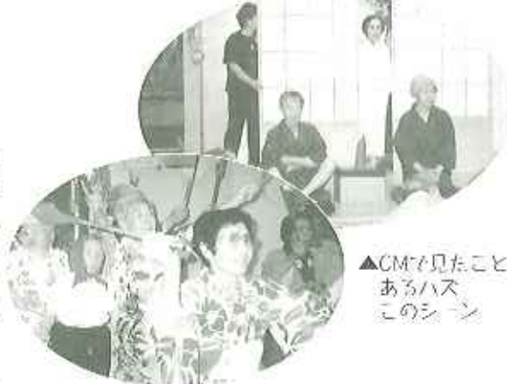
▲CMで見たことあるハズ このシーン

にないものね。」「私の格好をみてすぐ喜んでくれたの。」「こんにちは」と歌声が響き、皆さんに懐かしんでいただけました。