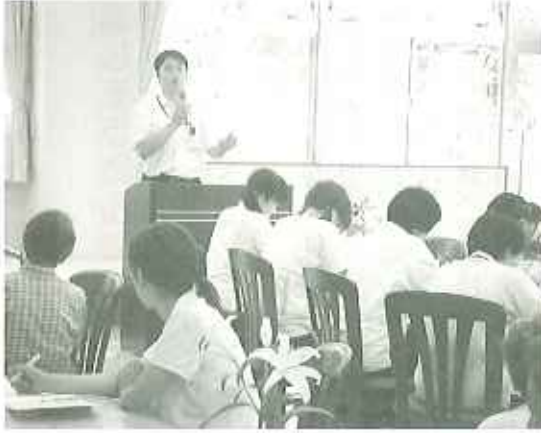
▶今回得た知識をさらに活かしていきたいと思えます。

七月十一日(月)、豊田市保健所の職員の方から感染症や食中毒などに関する衛生講習を受けました。講習中は参加者から積極的に質問が飛び交い、とても活気に溢れた講習となりました。特に夏場は菌が繁殖しやすいため、手洗いうがいを徹底し、「感染させない! 発症させない! 早期発見し治療を行う」ことに努めていきたいと思っております。