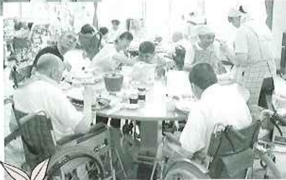
▼笹を背景にしての会食