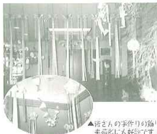
▲皆さんの手作りの飾り 来苑者に大好評です！

一日に何度もテレビで流れるCM。ユニークな最新のものから懐かしのものまでCMモデルとして発表しました。最後には万博の年にちなみ、三十五年前の大阪万博のあの曲「世界の国からこんにちは」を各国の民族衣装を身にまとい、にぎやかに踊りました。観客からの笑いと手拍子ですっかり気分は上々。出演者からは「少し失敗したけど、笑ってもらえて安心した。」「このドレス恥ずかしかった。でもこんな機会めった