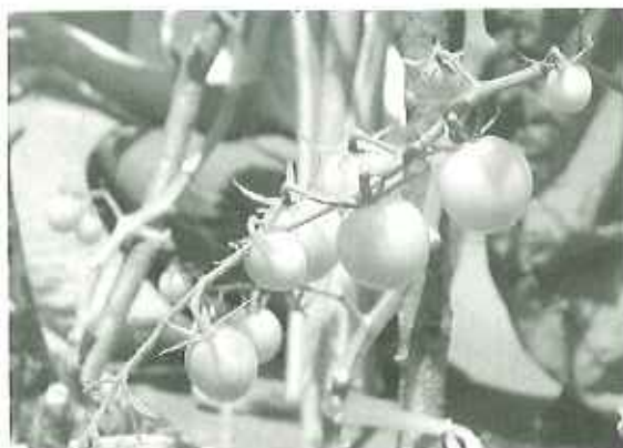
▲たわわに実ってます！

で、苗が折れてしまう心配がありました。成長に合わせて添え木をし、強い雨風にも耐えられるようにしました。他にも脇芽を摘んだり水をやったりといろいろな手入れをしています。トマトを育てることで、普段何気なく食べている野菜を、食べられるまでに育てあげる大変さも実感することができました。 今は実も大きくなり、少しずつ色づいてきています。食べられるまであと少し！