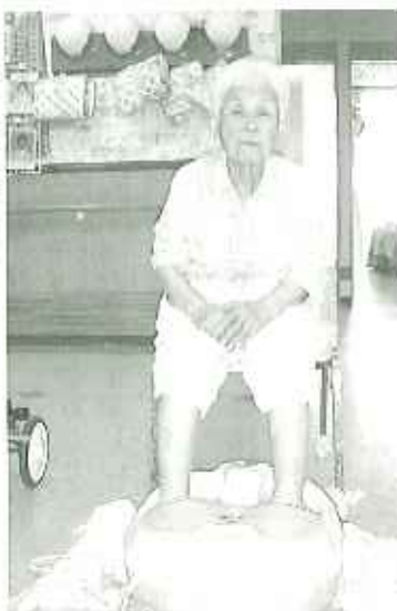
▶とっても気持ちいい!

い利用者さんを対象に足湯を楽しんでいただこうと「足湯マッサー」を行っています。 足を湯につけていただきながら職員が軽くマッサーをさせていただきます。体験された方からは、「気持ちがいい。わくみも取れたみたい。」となかなかの好評で、最近では「私もやって欲しい。」と希望される方が続出する有様です。