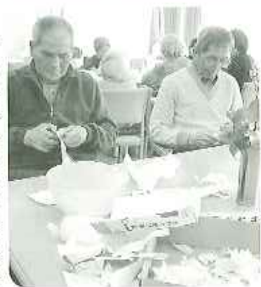
▲みなさん器用ですね

十一月に予定している文化祭への作品づくりを毎日楽しみなで行っています。まずは「紙芝居」です。「ここはどんな色にしよう...」など、皆さんでわいわいと話しながらも細かいところまで丁寧に製作しています。貼り絵を何枚も組み合わせて作る大作なので完成が本当に楽しみです。次は女性が大活躍の「パッチワーク」です。慣れた手つきでスタップも驚きます。他にも押し花・折り紙など、是非見に来てください!!