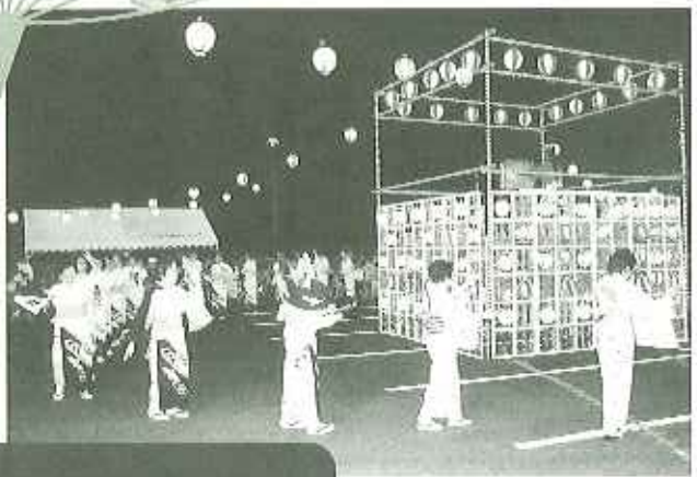
▲夏の夜更けに華やかな盆踊り