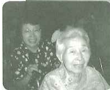
◀花飾りつけて、 さあ、お祭りへ! 利用者の皆さんも はりきって参加しました