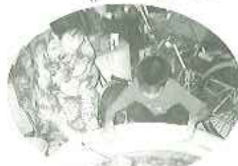
▲真剣な子どもたちを温かく見守る利用者さん