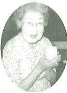
▲私のが1番……なんちゃって♡

今後、作品の抹茶茶碗、菓子器が来訪者のために使われたり、花器にお花が飾られたりと潤いのある生活ができればと思います。