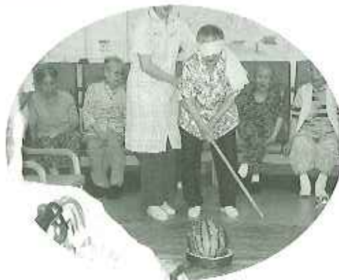
▲上手くスイカに当たりますように

今年の夏は例年より暑く、世界水泳や万博で盛り上がりつつある。デイサービスではスイカ割りでお熱していました。久しぶりに行ったスイカ割りに、利用者皆さんの「難しいわ。」「上手く割れたわ。」と苦々しい声を上げておられました。皆さん夏気分を味わえたのではないのでしょうか。