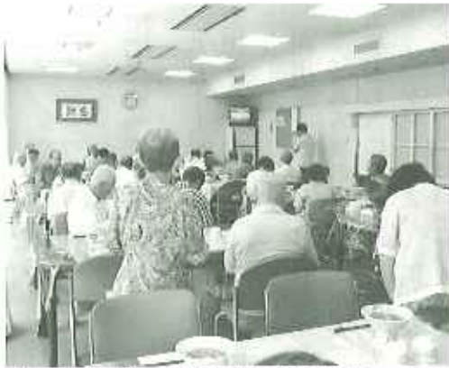
▲この平和がいつまでも続きますように...

若草苑では戦争のことを忘れないように、八月六日広島平和記念日、九日長崎原爆の日、十五日終戦記念日には必ず黙とうを捧げ、