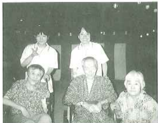
▲浴衣姿で涼しげです

また、浴衣を着た子どもたちを見ると、思わず頬をほころばせ、かわいいな、わしにもああいう時代があったなあ。」と、とても懐かしみ喜んでいらつしやいました。 地域の方々も気さくに声をかけ