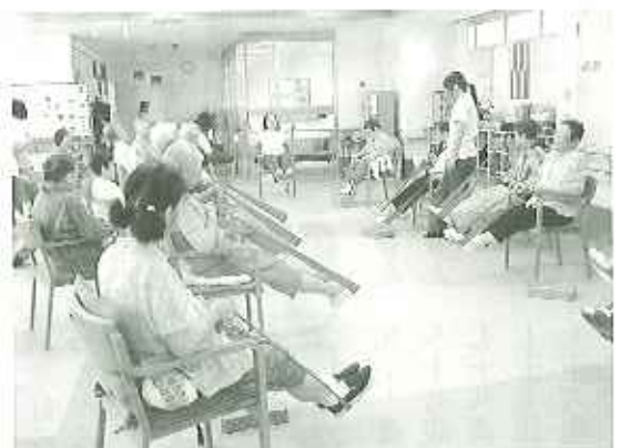
▲ゴムを伸ばして下半身をきたえます

利用者さんに感想を伺うと、「これは、いいよ。そんなに刺激もないしね。」「簡単にできるし、みんな楽しそうにやってるよね。」と好評です。 リハビリだからと肩に力を入れず、誰でも簡単に楽しくできるこのゴムリハビリを今後も継続していきます。