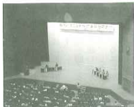
▲ユニットケア全国セミナーに参加しました

現在、とよた苑の認知症棟では、ユニットケアに少しでも近づけるべく、利用者さんを二つのグループに分け、生活していただいています。一つに分けたことで、利用者さんの新たな姿を発見できたり、それとともに体調不良の早期発見、事故防止がはかれるようになってきました。また、食事の際、一部の利用者さんには、御飯とお汁を好きな分だけ注いでいただいたり、ジュースなどを職員と一緒に作ったりしています。しかし、まだその人らしい暮らしにはほど遠いのが