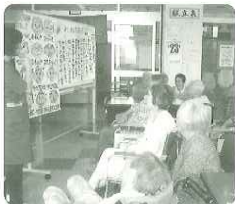
▲笑顔ももれて健口体操