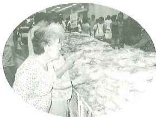
▲新鮮な「エビ」を使ったせんべいもおいしいネ!

八月十二日(金)、真夏の太陽の光りも和らぐ薄曇りの中、新鮮な魚を食べに行こう。ツアーとして知多半島、師崎方面へ出掛けました。日帰りツアーということで、まずは腹ごしらえ。新鮮魚と大きなエビフライが名物の「食堂へ」。いつもの食事の倍はありそ