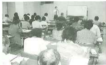
熱心に聴講される皆さん

8月22日の講座は、認知症介護の対応の仕方を症例を出しながら行いました。反響も大きく年内に再度、講座を企画しようと考えています。