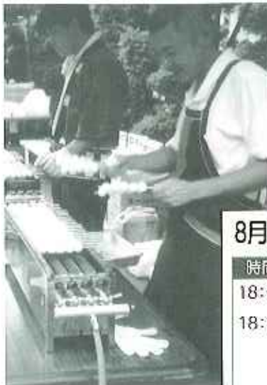
▲みたらし団子、ねぎまなど、たくさんの模擬店が開店と同時に大盛況