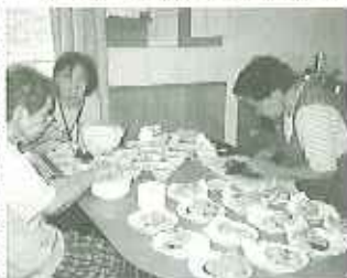
▶きれいに盛り付け出来たね

グループホームでは、朝・昼・晩の食事を、利用されている皆さんと職員が一緒に作っています。皆さん、昔とつたきねづか? とても上手に包丁を使い、野菜などを切り、調理してくださいました。また、出来上がった料理を人数分に器に分け分けするときは、皆さんで「こっちは少ないね」、「あそこは多いね。」など、協力しておかずを均等に分けてくださいました。食事時には、「みんなで作ったものは美味しいね。」と笑顔で話しながら毎食楽しく味わっております。