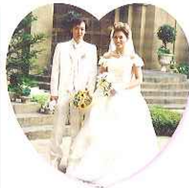
▲幸せな家庭を築いてください