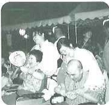
▶音楽に合わせて楽しく踊ろう♪