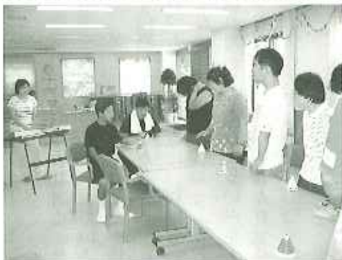
▲大きな声で歌います

ハンドベルで、「一人一音ずつ担当し、「ドレミのうた」を演奏しています。また、ポランティアで、音楽の先生を招き、手話リズム体操を指導していただいています。先生のピアノに合わせ、歌遊びを取り入れるなど、利用者の皆さんも楽しんでいます。