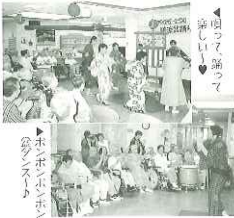
▶ホンホンホン(盆ダンス)

寄贈してくださり、リハビリの環として五月から毎日練習してきた体操と踊りを組み合わせたダンスです。ノリが良く、利用者さんと職員が一体となって楽しむことができました。