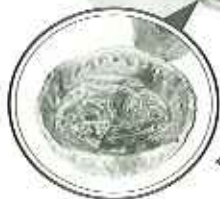
◀みことな出来映え!!