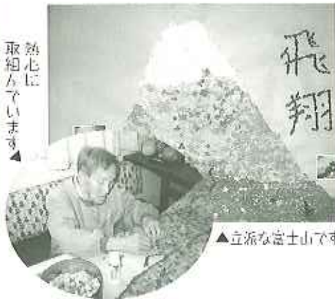
▲立派な富士山です