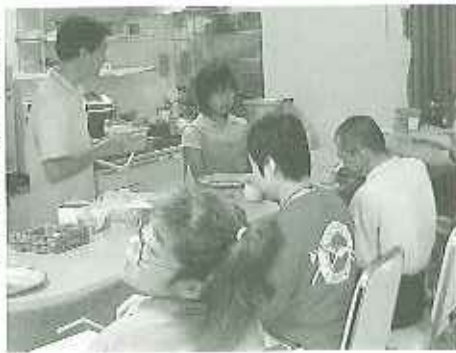
▶喫茶「かすが」毎日営業

私は八月二十六日に春日苑でボランティアをしました。私は去年も春日えんへボランティアをしに行きましたが、ことしは去年より、いろいろなことを体けんしました。みんなにコーヒーを作ってもらったり、パソコンでお仕事もしました。去年もやった、ゴロパレーにもさんかしました。去年とあいかわらず、みんな強かったです。来年も行きます。