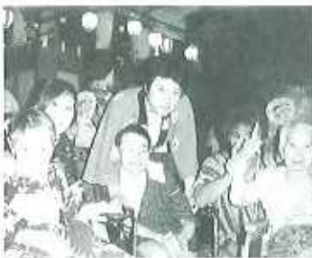
◀お祭り、楽しんできました!