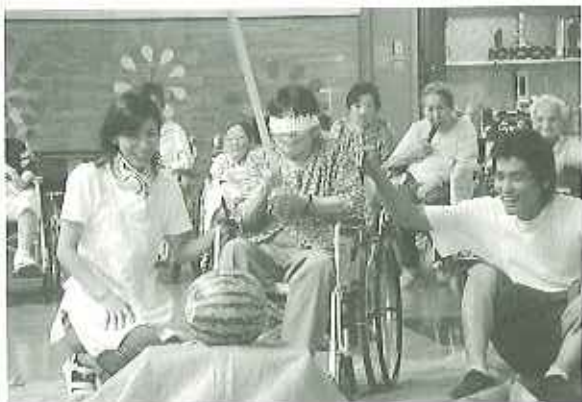
▲スイカをめがけてエイヤー!!

その後、割ったスイカをおいしそうに召しあがられ、「上手にすいかが割れてよかったよ。」と満足そうな表情を見受けることができました。