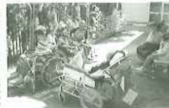
▲外の空気は気持ちいい〜

今年度から、利用者の皆さんに、健康作り、気分転換をしていただくため、外気浴を午前の水分補給の時間を利用して行っています。