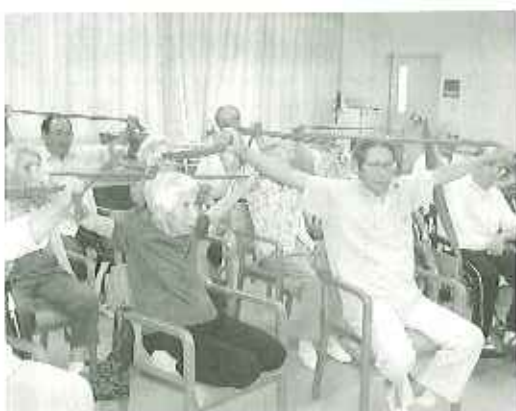
▲今ハヤリのゴムリハビリで腕の運動

腕の上げ下げ、足の曲げ伸ばしを中心に約五分から、十分ほどの運動ですが、実際に行ってみると、これがなかなか腕や足にほどよい疲れをもたらします。