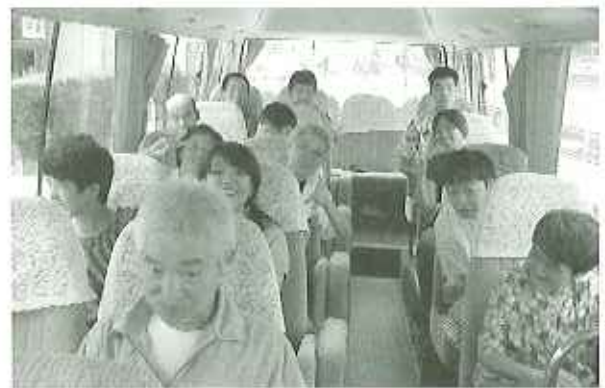
▲買い物ヘレッツゴー!