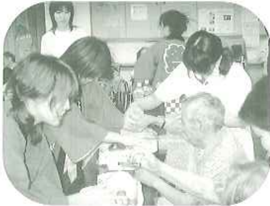
▲涼しくっておいしいかき氷をつくるぞ!