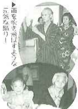
▲五平餅にみたくし、いただきます! (元気な踊り!)

八月二十一日(日)、雨降りの合間をぬって養和荘の盆踊り大会へ。室内でにぎやかに盆踊りが繰り広げられ、誘われるように踊りに入って行きました。皆さん「雨が降っても来て良かった」と喜ばれていました。