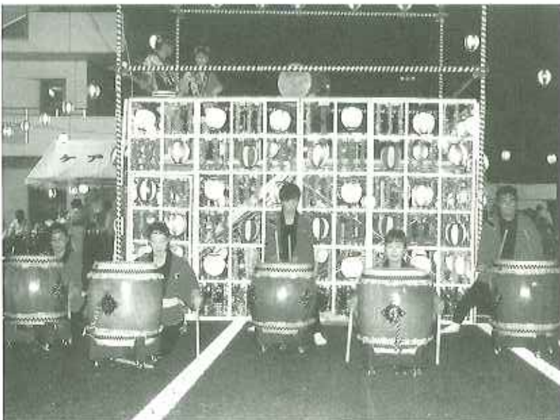
▲「鼓蝶」の皆様によるすばらしい演奏で大いに盛りあがりました