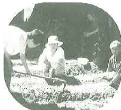
▲ホクホクのじゃがバター...収穫するのが待ち遠しい!