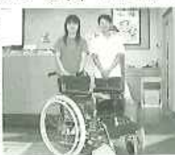
▶ポウリングスにマ記念撮影

八月二十六日(金)、春日苑に新しい車椅子が届きました。春日井サティ四階のポウリング場「ポウリングス」様から寄贈いただきました。来客時や外出時など様々な場面で活用させていただきます。