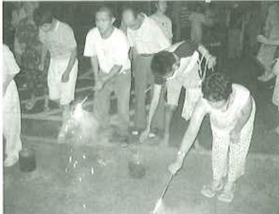
▶やっばり夏は花火だね

利用者の皆さんも、夜祭りのメインである夏の風物詩「花火」を大変楽しみにしており、早くからグラウンドに集まり、開始を待っていました。ついに花火が始まると、皆さん、その美しさにうっとりした様子で、「きれいだね。」などと話しながら一夜を楽しみました。