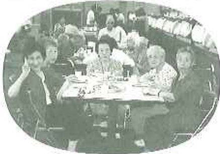
▲外で食べるごちそうの味は格別だね!

前日までの夕立模様と打って変わって、八月九日(火)は一日中晴天に恵まれました。涼気が深い始める夕方六時にビアガーデンを開店。隣接のショールームの屋上にちようちんをぶら下げ、カラオケを持ち込み、ジョッキ片手に乾杯!