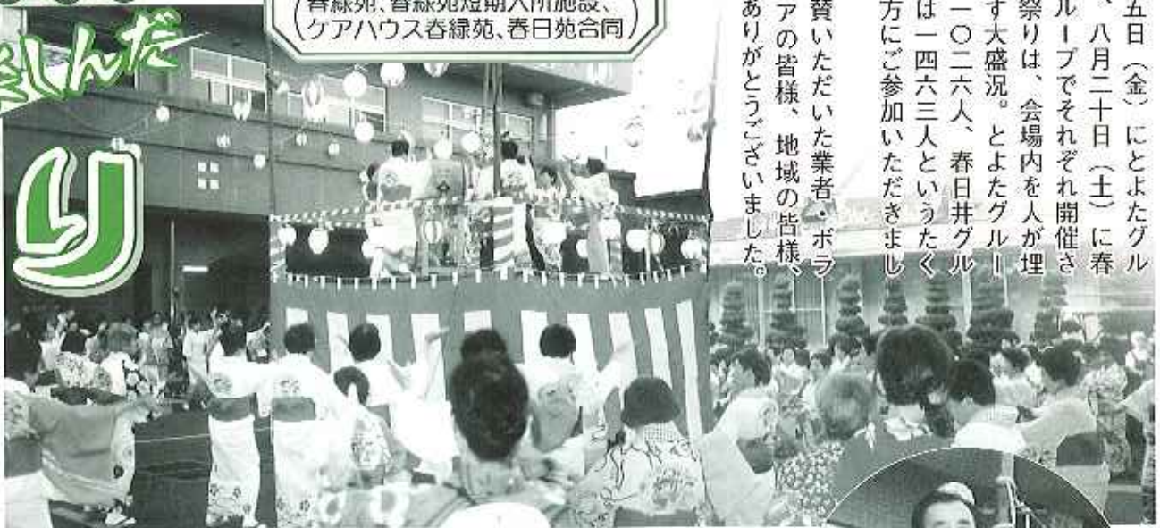
▲やぐらを回んで盆踊り。マツケンサンバ、春日井よいとこなどで盛り上がりました!

八月五日(金)にとよたグループで、八月二十日(土)に春日井グループでそれぞれ開催された夏祭りは、会場内を人が埋めつくす大盛況。とよたグループでは一〇二六六人、春日井グループでは一四六三人というたくさんの方にご参加いただきました。 ご協賛いただいた業者・ボランティアの皆様、地域の皆様、本当にありがとうございます。