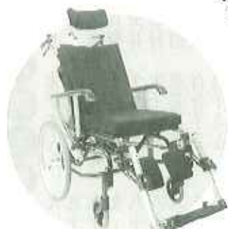
月額レンタル料は 300円〜800円程度です

はもろろん精神的な自立度の向上にもつながります。これからは行楽のシーズンです。車椅子を使って行楽地を訪れてはいかがでしょう。