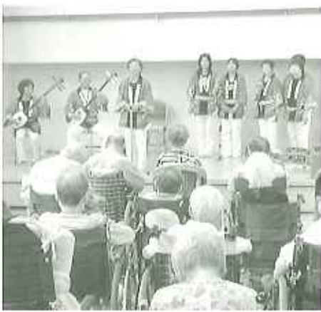
▶いい演奏を聞かせていただきました。皆さん大満足でした