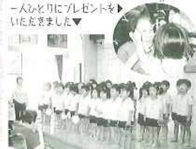
一人ひとりにプレゼントをいただきました▼

その後、利用者さん一人ひとりに首飾りをプレゼントしていただきました。利用者の皆さんは園児たちと握手をしたり、元気で長生きしてね。と声をかけていたのだいたりで、ホール全体が「和み」の環に包まれた感じでした。園児の皆さん、来年も元気をください。ありがとうございました。