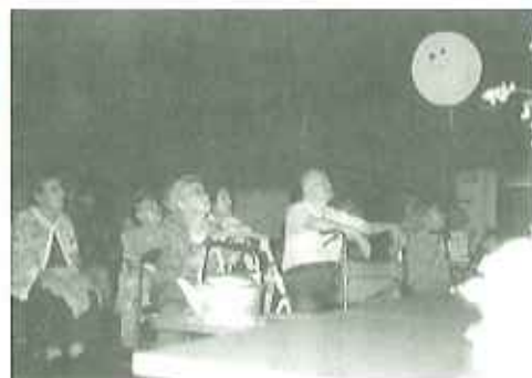
▲来年は本物を見ましようね

満月が見られなくて残念でしたが、打上花火は特等席で観賞。また一つ思い出が増えました。