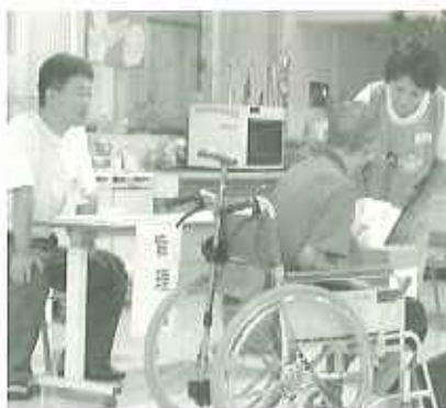
▲「よりよい世の中に…」想いを込めて投票