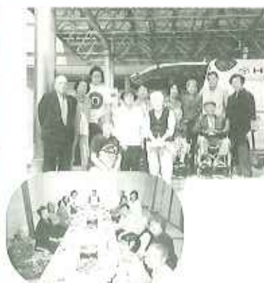
▲たくさんのご馳走いただきました!