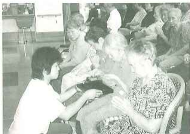
▶213名のご冥福をお祈りいたします

利用者の皆さんは、読経の後の法話を真剣に聞き入り、「良い話をたくさん聞くことができたよ。」と感銘を受けたとともに故人の思い出を偲びました。