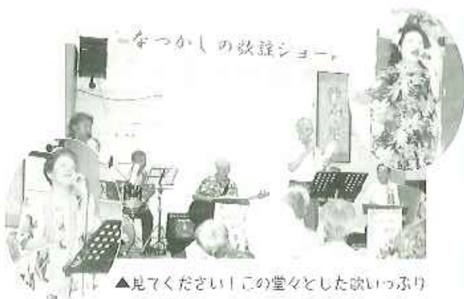
▲見てください!この堂々とした歌いっぷり

「こんなにエビを食べちゃった。」 「今日は久しぶりに楽しい一日だったわ。」と皆さん満ち足りた様子でした。