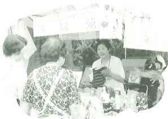
▲売り子にも方が入ります

暑さの残る九月十日(日)に行われた福祉のつどいに、今年もケアハウスから恒例の手作り品バザーを出店。利用者さんの個性豊かな作品が店頭にところ狭しと並