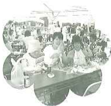
▲フックフルト、手作りのパン、ピース細工などたくさんのお店を巡りました