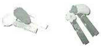
▶かわいいクリップ作りました

利用者さんが力をあわせ、百四十ものかわいいクリップを作りあげることができました。サンホーム全体がお祝いムードに包まれ、利用者の方皆さんからは「おめでとう」、「幸せになってね」などの言葉が送られました。