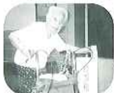
▲大切な一票にしたいです

今回、一人の棄権者も無く、利用者さん全員が投票されました。皆さんの一票一票が生かされる政治を期待します。