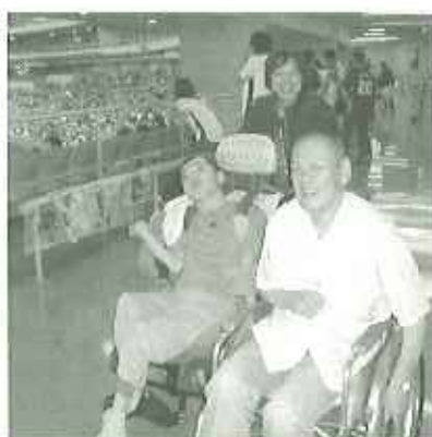
▲やってきましたナゴヤドーム!

春日苑で積極的に取り組んでいることの一つに、利用者の皆さんの外出支援があります。今回はそ