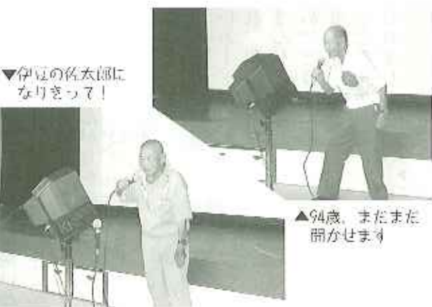
▼伊豆の名太郎になりきって!

敬老会は、式典で九名の方が敬老祝い金をいただき、十三名の方がお祝いの品をいただきました。その後は昼食会。皆さんで鮎兼様からの敬老慰問の桶寿司をいただきました。鮎兼様には、毎年敬老会の日にお寿司の慰問をいただいております。今年で二十九年目となります。利用者さんはお寿司が大好き。「ありがたいね。」「おいしいね。」「ねたがこんなに大きいよ!」と会話をしながら楽しい昼食会となりました。