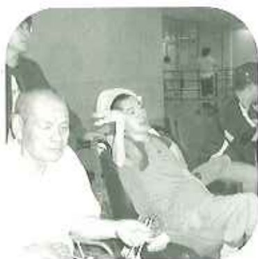
▲ホームラン!応援する一人にも表情が...