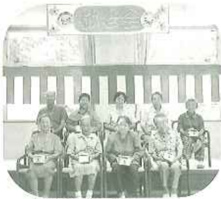
▲最高齢、節田の方 これからもお元気です!

六十代〜九十代の広い年齢層の利用者さんは日指すところもいろいろ。「さんは、なんでもやってみなくちゃ損しちゃう!」と敬老会では社交ダンスに挑戦。また、午後のお茶会では「あとのはのんび