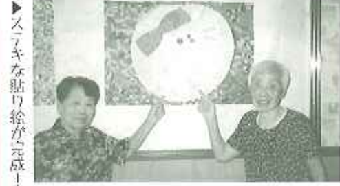
▶スミキな貼り絵が完成!

「秋」をテーマに、午前・午後の時間を利用して十五夜の貼り絵づくりを行いました。皆さんは、十五夜には、萩の花やすずき