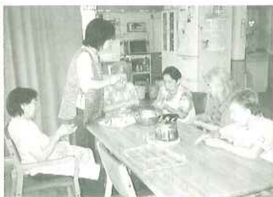
▲キレイに丸く出来たかな？