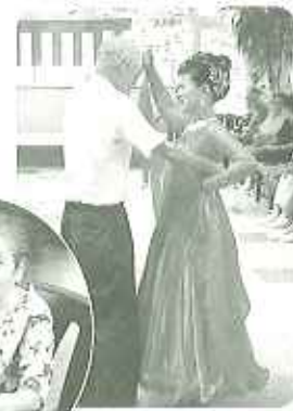
▲ドキドキの初ダンス♡