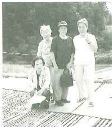
▶川の流れを聞きながら...

て来ました。「やなほとでも風情があつていいわね。」「揚げたて、焼きたての鮎づくし料理で最高においしかった。」などの言葉も聞かれ大変喜ばれました。