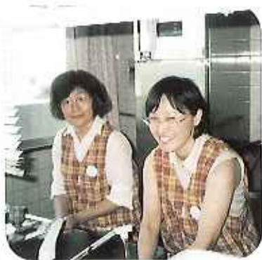
▲準備から片付けまで

だいております。喫茶店を開き、美味しいコーヒーや紅茶を入れていただくだけでなく、歌やリズムの遊びなど取り入れてサービス精神旺盛です。 「仲間女」と書き、「グルメ」と読みます。「グルメ」という言葉からも分かるように、皆さんは、料理教室の仲間で、「せっかくなので知り合った仲間で何か社会や人のためにできることはないか」と話し合い、活動が始まったそうです。 当施設へは開設からのお付き合いです。長く続くコツは「やらせていただく」と云う気持ちで、「参加は無理強いせず来れる人だけ」。「楽しく楽しく」、「人生の先輩の高齢者から勉強させていただく」という気持ちで「だそうです」。 そうは言っても、そう簡単にしかも長くできるものではありません。ショートステイ・同感謝感謝です。