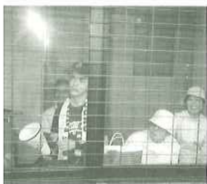
▲勝利を願って応援!

九月二十八日(水)、小牧市民球場にて民老協野球大会が開催されました。今年も僕は応援に行かせていただきました。春日苑から五人の職員さんが選手として活躍されました。 チーム名は、ブラックキャッツ春緑苑です。投・打とも、バランスが良く16対0で圧勝でした。これからも優勝めざし