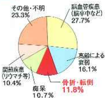
「国民生活基礎調査」(平成13年より)