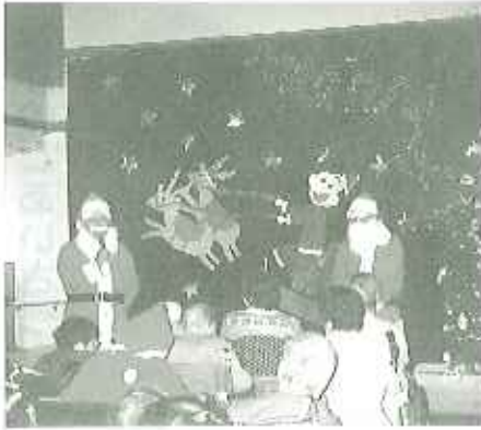
▲サンタクロース登場!

皆さん大変満足されたようで、「楽しかった」、「プレゼントがもらえてうれしかった」などとても喜んでいらっしゃいました。皆さんに大変楽しんでいただけたクリスマス会となりました。