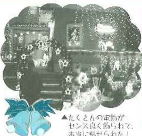
▲たくさんの電飾がセンス良く飾られて、本当に魅せられた!