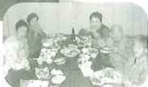
すらすらどわかか食べようかな? いただきます!