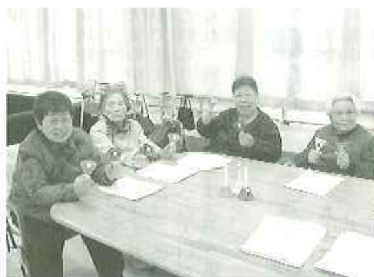
▲いいリハビリです

おられる様子です。 また、ハンドベルの愛好者も増え、皆さん日々練習に励んでおられます。