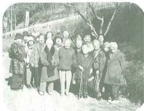
▲「下山・赤森の里」にて