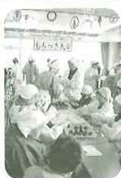
▲旧れた手つきで次々に大福が出来上がります

十二月十五日(木)、毎年恒例のもちつき大会を行いました。「つきたてのおもちは格別だわ!」と、大好きなあんやきな粉をたっぷり付けて、皆さんいつも以上の食がすすんでいました。