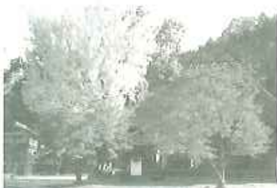
▲とてもいい天気でした きれいですね〜♡

行き先は松平東照宮と六所神社です。今年は色づきもよく利用者さんからの声も「とてもきれいだった」、「行ってきて良かった」という、うれしい声を聞くことができました。車中もちよっとした遠足気分笑顔と笑い声がいっぱいでした。