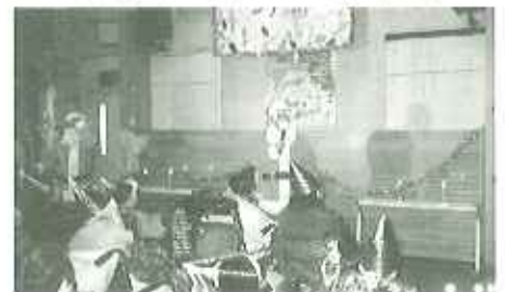
▲様々なプレゼントありがとうございました

は、演芸 慰問で春 日苑多日 的ホール で、①高 蔵寺教会 少年・少 女聖歌隊 のかわい いお子さ んたちによるクリスマスメロデー ソングの合唱と、花束のプレゼ ント贈呈。②、ワクトンと愉快な 仲間たち、の皆様による軽快なウ クレレ演奏。③小牧市の北里ハ モニカクラブの皆様による素暗ら しい演奏。皆さんがとても楽しめ た一日となりました。