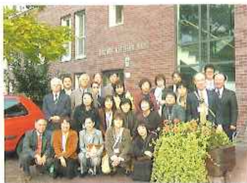
▲特養「ピシヨッフ・ケッテラーハウス」前にて

ベルギーを後に、空路にて最後の訪問国、ドイツはベルリンを訪れた。午前は障害者施設「アクチオン・バイトブリック」、午後は特別養護老人ホーム「ピシヨッフ・ケッテラーハウス」を視察。ドイツの場合は、介護給付対象者は、年齢に関係なく介護が必要となった時点で受給者となり得る（ただし保険料の納付済みが前提条件）。保険料は一律で、月収の一七％で雇用企業と折半。加入者の年齢は二十歳以上で、受給権者は加入者全員で、被介護者の配偶者及び子供も保険料負担なしで介護給付を受けることができる。その