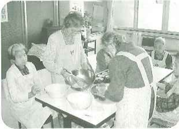
▶できあがり楽しみだね！

料理教室の内容はとても充実しております。ショートケーキやチーズケーキ、杏仁豆腐やごまプリン、五平餅など、なんと五十種類以上のレシピができてあげりました。また、皆とったきねづかともい