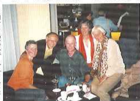
▶旧友との再会、ベルリンにて

しかしドイツにおいても財政的に相当逼迫しており、介護保険においても相当な赤字となっている。今回訪問した各施設においても、日本における介護保険の行方を相当な関心を持って見守っていることが伺えた。