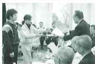
▲会館会長から、賞状と賞金が授与されました。

十二月十三日(火)、冬型の気圧配置が続く中、第三回法人福祉QC大会を春緑苑地域交流センターにて開催しました。理事・評議員の方など十七名の審査員を招き、百五十名の職員が参加。法人の各施設から代表の十・サークルが活動の成果を発表し、最後に、先日第十六回全国福祉