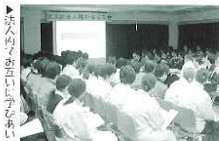
十二月十三日(火)、冬型の気圧配置が続く中、第三回法人福祉QC大会を春緑苑地域交流センターにて開催しました。理事・評議員の方など十七名の審査員を招き、百五十名の職員が参加。法人の各施設から代表の十・サークルが活動の成果を発表し、最後に、先日第十六回全国福祉