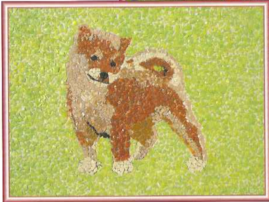
▲春日苑 利用者共同作品