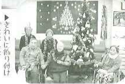
▶きれいに飾り付けできました