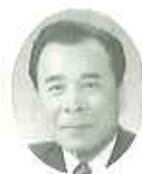
春日井市長 鵜飼 一郎