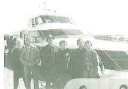
ノテリーに乗って あつという間に到着