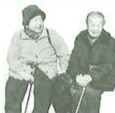
ムード満点の雰囲気の中、盛大にクラッカーを鳴らし会長サンタをお出迎え。テーブルにキャンドル、室内にはツリーとイルミネーションで飾られ、西洋のお祝いにあまりなじみのない方も特別な雰囲気を楽しみました。

十二月八日(木)利用者さん十七名と共に、下山のもみじ街道へ出かけました。もみじ狩りには少々遅いとは思いましたが、未だしっかりと紅葉した葉が、木もありました。一週間前に降った残雪もありましたが穏や