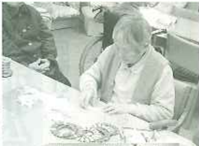
▶オーナメント作りには精が出ます