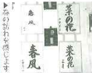
春の訪れを感じます

ボールエクササイズ運動 「おもしろそう」 まだまだ寒さが残る三月中旬、ショートステイでは習字を行いました。 「昼といえば...?」というテーマで、皆さん筆を手に取り、真剣な表情で春を連想させる言葉をそれぞれ思い思いに書かれていました。「菜の花」「よもぎ」「桜餅」と美味しそうな言葉が並びました。会の一場面です。「菜の花はやっぱりおひたしにするのがおいしいわよね。」などと、利用者皆さん同士の会話も弾み、和やかなムードが漂う中、