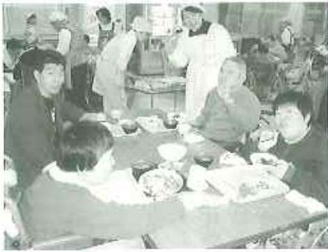
▲いつも楽しい会食