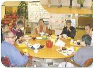
▲演芸会と会食でにぎやかに盛り上がりよした

三月三日（金）、桃の節句に各施設でひなまつり会を催しました。 様々な演芸会やゲームなどを行い、華やかな行事になりました。