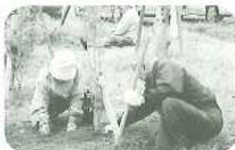
▲お庭の手入れもおこたれません

今年、詩吟、カラオケ、大正琴に加えて、キーボードクラブも日頃の成果を発表します。また、例年通りケアハウス食堂で、手作り和菓子(漆雪ゼリー)を添えての野点と、傍らでは日々作っている作品の販売