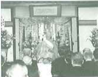
▲皆様のご冥福をお祈りいたします

三月二十一日(火)、春の彼岸法要にあたり、月例祭と併せて慰霊法要を営み、開設以来の三百七名の物故者の方のご冥福をお祈り申し上げます。