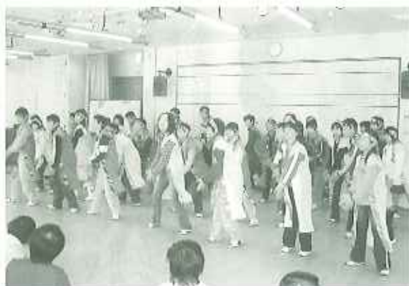
▲マツケンリンパでオレ〜