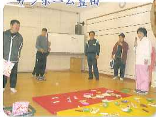
▲お投げゲームおかしなゲット!