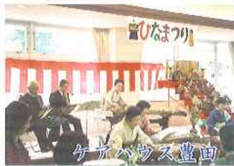
▲尺八と琴の音色で雰囲気あるねー