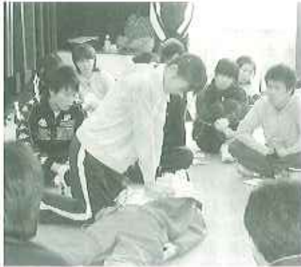
▲救急対応についても実習しました