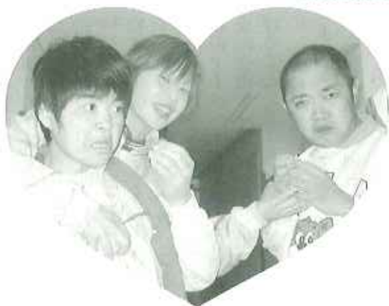
▶美味しく召し上がれ!

十四日の当日は、お菓子をもらった女性利用者さんにも笑顔が見え、おいしく食べることができました。