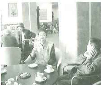
▲笑いのたえない喫茶です

へさくら さくら 弥生の空は 見渡す限り かすみか雲か 匂いぞ出する いざや いざや 見に行かん♪