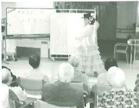
▶お聴やかな踊りです

初めて見るフラメンコに、利用者の皆さんは目を輝かせ、心躍る素敵なおひとときを過ごされました。