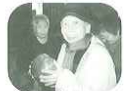
▲「願いの石」は願い事叶えてくれるかな

り旅行を楽しませ、帰路につきました。後日「すばらしい景色と静かな環境の中での温泉、ゆせんの里みのり乃湯、露