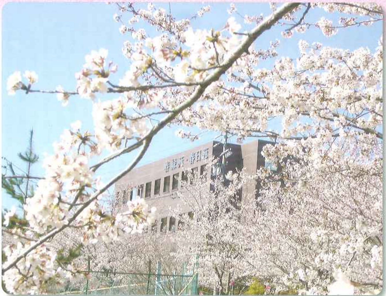
満開の桜と陽だまりにつつまれて（平成18年4月）