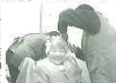
▶ピンな髪型になるか楽しみ

ででかけて行かれ、めいめいに、自分の気に入った髪型にしていたできました。親切で感じの良い美容師さんに、皆さん満足げな様子でした。