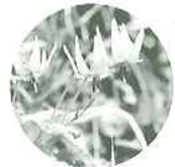
▲薄紫色で上品な花 カタクリ

ピンク色に染まり、今がとっても 見頃！めずらしいカタクリも数輪 咲いており、一同感激。ポカポ カ暖かくて花も一気に咲いたよう だった。「カタクリの花初めて 見たよ！」植物園はこれから見 頃。また行きましょうね。