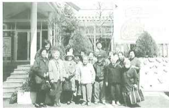
▲天然温泉 四季のふる里にて

り旅行を楽しませ、帰路につきました。後日「すばらしい景色と静かな環境の中での温泉、ゆせんの里みのり乃湯、露