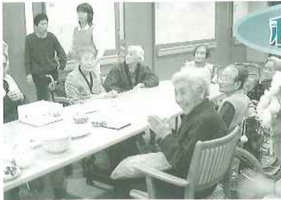
▶ユニットのリビング風景