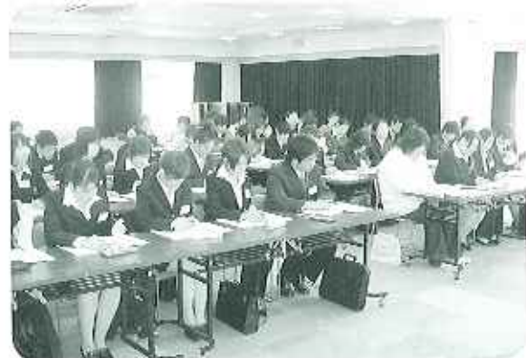
▲2月10日、オリエンテーションに?

二月十日(金)～三月三十一日(金)にかけて、春緑苑地域交流センター及び配属先施設にて、新規採用者実務研修を行いました。 まず、現場指導者を講師とした講義・演習、外部から講師を招いての講義で基礎を学び、さらに、実際の配属施設での介護実習により、プロとして働くための実践的な技術を学びました。具体的な研修プログラムは、次ページのとおりです。