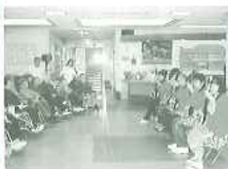
▲3月18日、高京玉すだねなどの芸を披露していただきました