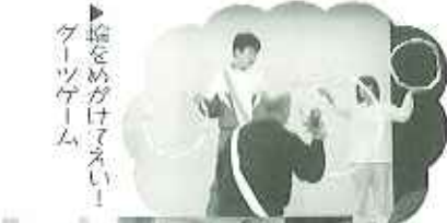
▶輪をめぐってアスレィ！ クイズゲーム