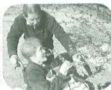
▶ついに花に触れたくなりました

緒に観て歩いて楽しかった」、「梅の香りがいっぱい、花を見上げながら、よく歩いたなあ。」と春の息吹を感じながら、いつもより張りきっていました。