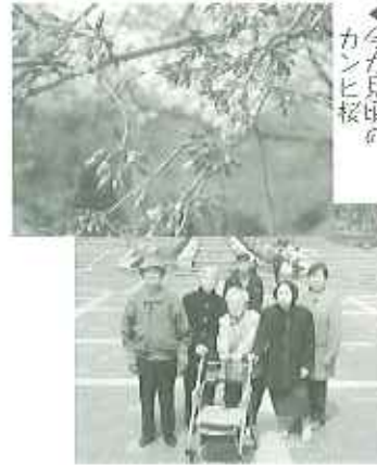
▲今が見頃の カンヒ桜