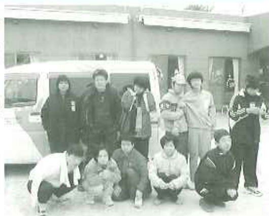
▶今年もよろしくねっ!!

野見デイサービスセンターが始まり、一年が経ちました。開所からの利用者さんに、「この一年はどうだったかと尋ねると、「いろんなことが経験できて良かった」、「喫茶店に行けて嬉しかった」などと話してくださいました。」 これからも、利用者さんの要望や気持ちを大切に、一年日も、さらに充実して過ごしていただきたいです。