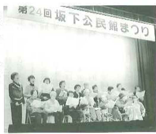
▶観客を魅了する歌パフォーマンス