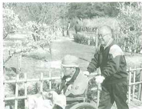
▶春の香りでいっぱいです

三月十一日（土）、十五日（水）で、施設近くの平芝公園へ、梅見物に出かけました。利用者皆さんは「ここの公園は、いろんな種類の梅があつて、赤、白、ピンクときれいだわ。今日は梅祭りなので、大勢の人と一