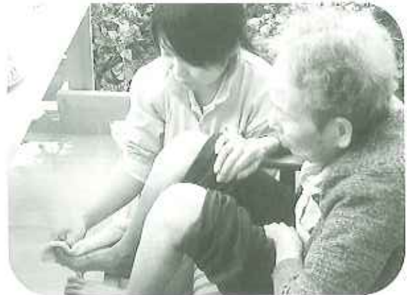
◀足湯で体をホカホカ

最初は今までの生活と違う環境の中で多少、戸惑いを隠せない方もおられましたが、次第に新しい