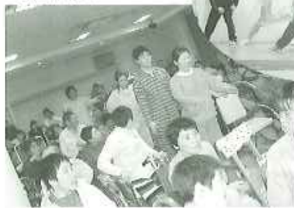
▲衣装、踊りetc...様々な演目が披露されました