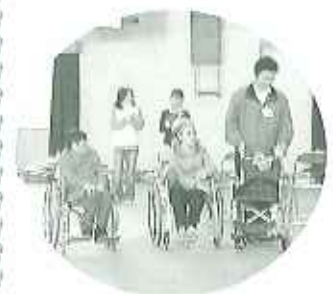
▲大切に使用させていただきます