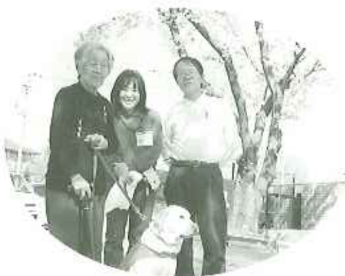
▲かわいいワンちゃん!

四月七日(金)、毎月訪問して くださる豊田市動物愛護ボランティアの訪問活動犬六頭と飼い主の 皆さんが、慰問に来てくださいま した。