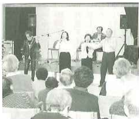
▲すばらしい歌声でした