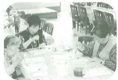
▲では、実際にやってみましょう!

四月二十四日(月)、福祉招待券をいただき、利用者さん四名で名古屋ささしまライブまで木下大サーカスを見に出かけました。参加された方の感動を紹介し