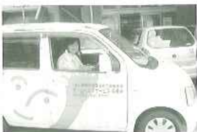
▶今日も元気に活動に「いっぴきま〜す」

また、利用者さんがご自分だけではできない仕事を留意して待っていていらつしやった時に、お手伝いをする、と、凄く喜んでくださいます。 これから、少しでも多く、利用者さんの笑顔が見られるように頑張ります。