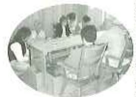
▲足湯にもお座りいただけます

職員一同、この新しい地に根付いた施設として、地域の方々に喜んでいただけるようなサービスを提供できるよう頑張っています。