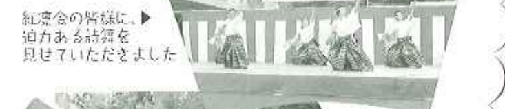
紅湊会の皆様は、 迫力ある詩舞を 見せていただきました