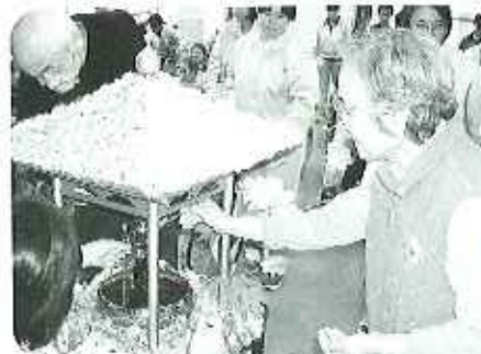
四月二十一日(金)お祝池様に甘茶をかけた誕生をお祝いしよす