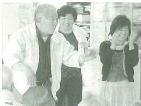
▲また是非来てください!

今回の慰問は、デイサービスをご利用された方の紹介で実現しました。次回も楽しみにしています。