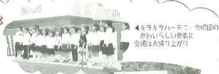
◀キラキラハーモニーク合唱団の かわいらしい発表に 会場は大盛り上がり