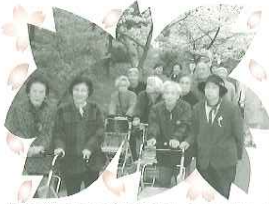
▲桜の花がちょうちんの夜りに照らされてとってもきれいだった！