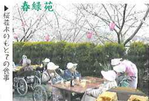
桜花木のもとの食事