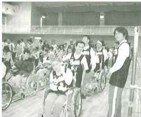
▲リフックスして入場行進

四月二十五日(火)、志段味スポーツランドにて、県内九施設が集まって、ゴロバレーの交流試合