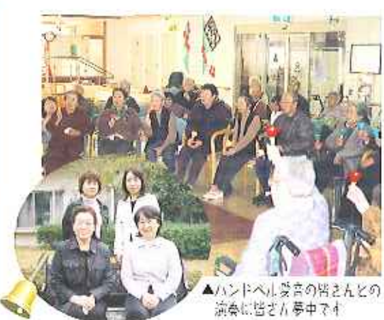
▲ハンドベル愛音の皆さんとの演奏に皆さん夢中です

編集後記 新緑眩しいこの季節、一年でもっとも活力に溢れ、外を歩いているだけでうきうきしてきます。また、当法人では、四月二十九日(上)に豊田地区、五月二十七日(上)に春日井地区の開設記念祭を開催し、地域との交流をはかっています。今年度も、この広報紙を通して法人・各施設の生々しい様子をお伝えしてまいります。