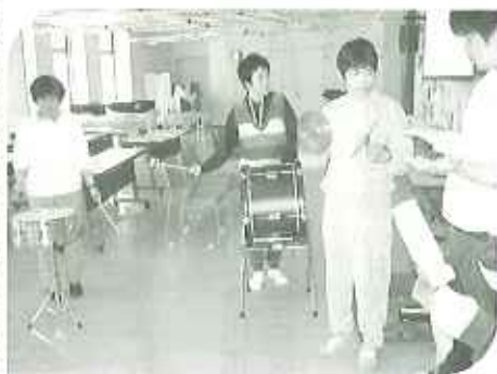
▲みんなで楽しく演奏しています

造形クラブで作製した作品は、サンホーム玄関や開設記念祭、福祉フェスティバル会場にて販売を予定しています。