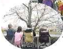
やっぱり桜はいいですね～

四月になり、桜の下で食事をしたり、名所へ出かけて行ったりと各施設でお花見を楽しみました。