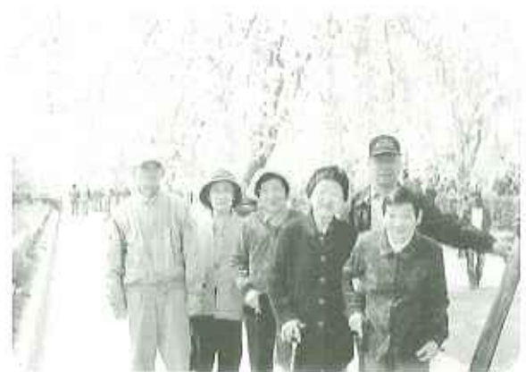
▲「今年もきれいな桜花がたよ〜」と皆さん思わず「ウッウッ」