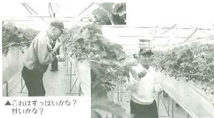
▲これはすっぱいかな？ 甘いかな？

ハウスの中は苺の甘ずっぱい匂 いでいっぱい。苺狩りといえば、 普通は座って食べるところが多い のですが、こちらは立ったままに 苺狩りができるため、座るときに