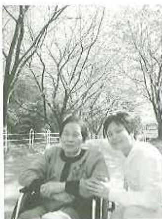
▶満開の桜がきれいです

川の岸辺では、淡いピンク色に染められた桜が一気に咲き揃い、それは見事でした。道中、桜並木が現れるたびに歓声が上がります。きれいだね。と会話も盛り上がりながら「なにも考えず美しい桜を見る、その幸せを感じています。桜を見て怒る人はいませんね。と穏やかな気分になっていく方、幹の太い古木に感銘を受け、後日絵を描いた方などがいらつしやいました。美しい桜に誘われて、程よい運動にもなりました。爽やかな春風が吹き抜ける中で見た満開の桜が利用者さんのそれぞれの心の中にきつと残っている