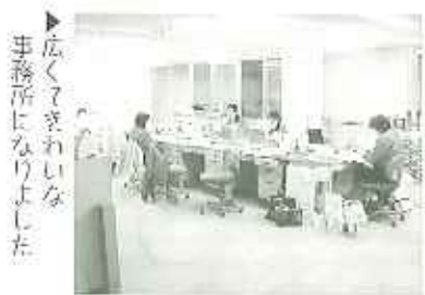
▶広くまわいな事務所になりました

二月から、とよた苑本館の一角、これまで駐車場に使っていたピロティの改装が行われ、四月に新しい事務所が完成しました。