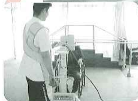
四月二十七日(木)レントゲン撮影健康チェック