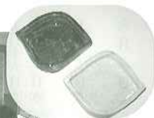
▲完成品！ 力作ぞういぞう

また、開設記念祭、福祉フェスティバルなど、大勢の人の前でその成果を発表し、自信を身につけています。ぜひ見に来てください。