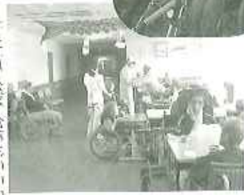
▶たまには大勢で食事もいいね

また、利用者の皆さんには一人ひとり、家で使い慣れた湯のみを持ってきていただいています。その湯のみを見せてくださって「これいいでしょ、きれいな絵柄が気に入っているの。」と微笑みながら教えてくださる方もいらっしゃいます。ご本人の気に入った湯のみで飲むお茶は格別おいしいというごことも教えていただきました。苑での生活は新しいことばかりですが、思い出のある昔からの愛用品を使っていただくことで、「ホッ」とするひと時ができていますように思います。