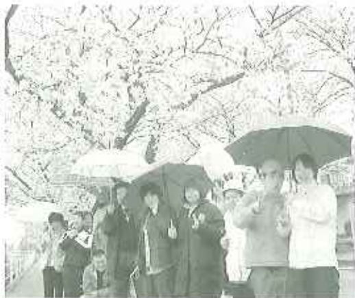
▶桜満開を満喫しました

野見デイサービスには、四月から新しい利用者さんが四名増えました。そこで、四月五日（水）に新しい利用者さんの歓迎会を開催して、花見外出に出かけました。あいにく天候は雨でしたが、鞍ヶ池公園の桜を車内から見物しました。利用者さんも桜が満開に咲いているのを見て、「きれいだね！」と喜んでいました。昼食に益富交流館の大ホールで花見弁当を食べ、楽しい外出になりました。