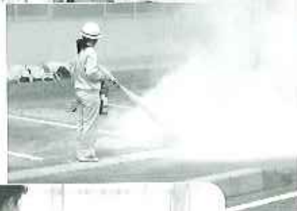
四月二十五日(火)消火訓練万が一に備えます