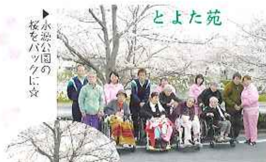
水郷公園の桜をバックに☆