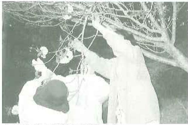
▲今年もかわいい桜をいただきました

名古屋港水族館にて、イルカ・シャチのショーを見学しました。皆さん水中での優雅な芸に目を奪われ、水面からのダイナミックな大ジャンプには思わず歓声と拍手で応援されました。普段は物静かな利用者さんのはしゃぐ姿に、同行した職員も新鮮な驚きを受けました。