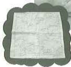
▶もみじ模様の花ふきん