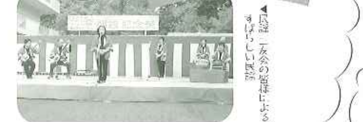
◀民謡三友会の皆様による、 素晴らしい民謡