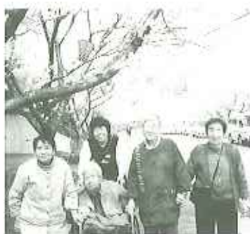
▲お散歩も、心もリフレッシュ

四月に入り、太陽の日差しが、こころよく感じるようになりました。あたたかな春の日の午後、近