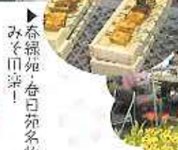
春緑苑 春日苑名物のみそ田楽!