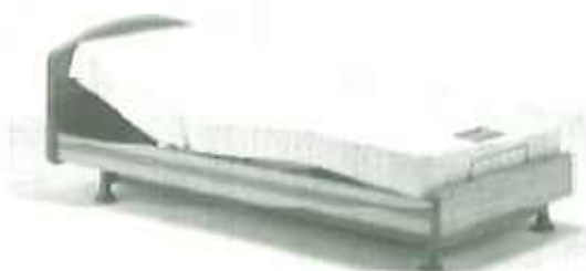
▲介護保険適用のベッドにバージョンアップ!