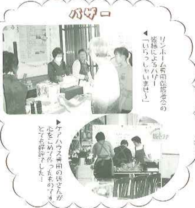
◀リンホーム豊田保護者会の 皆様によるハッピー 「いちごっしやいませ」