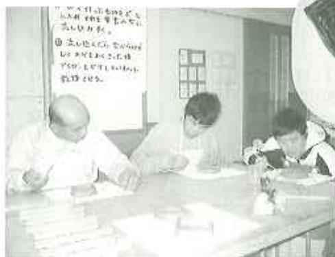
▲上手に焼けますように