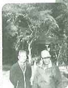
▲きれいな紅葉でした