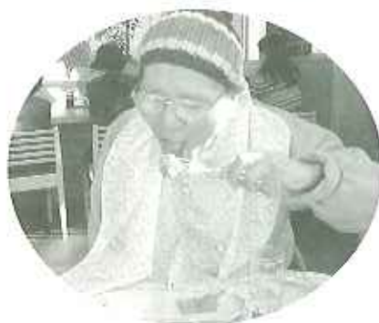
▲大きいエビフライを頑張った。「うまいなあー」

11月21日(火)、利用者さん6名職員5名で、中部国際空港セントレアへバスハイクに出掛けました。まずは、まるは食堂を名物「ジャンボエビフライ」で腹ごしらえ。