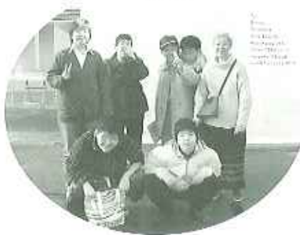
▲たくさん作品を見てきたよ！

12月10日(日)に利用者さん5名と職員3名で豊田市美術館にて開催されている障害者作品展に行ってきました。