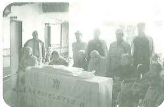
▲12月30日(日) 春日井ライオンズクラブ様よりお餅をいただきました 早速利用者の皆さんとおしくいただきました