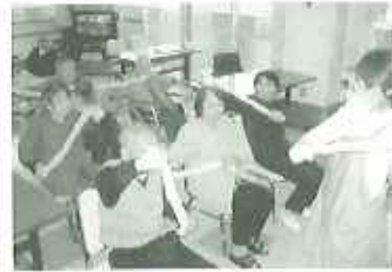
▲タオルを持って左右にねじる運動

外の空気も、段々と冷たく感じられてきました。ショートステイでは処遇の一環として、タオルを使って誰でも簡単にできる「タオル体操」を行ってみました。 どこにでもあるフェイスタオルをぐるぐると縦にねじり、両端を持ちながら体を動かしていきませう。身体を上下左右に動かすだけでなく、手に巻きつけるなどすると、手首や関節