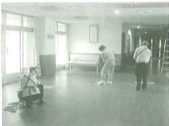
▶多くのご家族の力をお借りし、日々きれいになりました。

などを掃除していただきました。利用者の皆さんも「娘に部屋をきれいにしてもらったの。」と楽しんで話してくださったり、「大掃除をして新年を迎えられるのは、気持ちがいいものですね。」とおっしゃったりしていました。 ご家族の皆様、本当にお疲れ様でした。ご協力いただきありがとうございます。