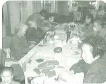
▲どんな門松が出来るかな? 制作中...

お菓子の空箱を利用して、丸めて緑色にぬって竹に見立てます。折り紙を切って丸めて松を作り、金の扇と梅をつけて完成です。それぞれ個性のある作品ができました。これぞ「上手くてきたから、これでいい年を迎えられるといいなく」と笑顔があふれました。