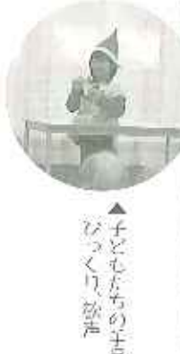
▲子どもたちの手品になっくり、歓声