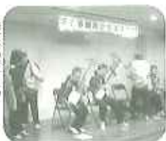
♪演奏の皆さんの 姿が素敵でした。