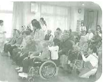
▲「かあさん、お話をたたまましよう…」と笑いながら肩たたき

上がり、驚かれています。また、子どもたちが利用者さんの中に入り、肩たたきをしたり、おやつ時間を一緒に過ごしたりしました。