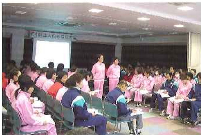
▲大勢の人が詰めかけ、発表の前に緊張した会場

12月15日(金)、第4回法人QC大会を春緑苑地域交流センターにて行いました。理事・監事・施設長の皆さん(14人)に審査をお願いし、法人各施設の職員総勢121人が参加しました。 QC活動とは、職場内の小グループで行う品質管理活動のことです。各職場の改善と活性化を図り、質の高いサービスを提供できるシステム構築を目的として行います。 今回の大会では、各施設の代表13チームが日頃の活動の成果を発表し、「転ばぬ先は杖、それとも脚?」というテーマで多角的に転