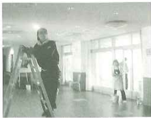
▲1つ1つ丁寧に磨いていただき、エアコンもピカピカになりました。

午前中は、2階から4階の各ユニットの窓ガラスやエアコン、手すりなど、細かな普段なかなか掃除