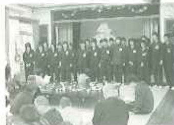
▲いつ聞いても「ふるさと」はいい歌だね

れました。鼻れということもあり、大変助かりました。午後からは利用者さんとのふれあい。折り紙、あやとりなどで楽しく遊んだ後、生徒さん全員で「ふるさと」を合唱してくださいました。利用者さんから「アンコール」の声があると、生徒さんたちはちょっとビックリ、それでも皆さんで話し合ってもう一曲披露してくださいました。