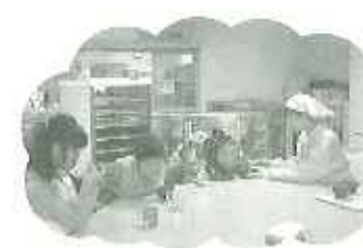
▲あつあつのお雑煮に舌鼓