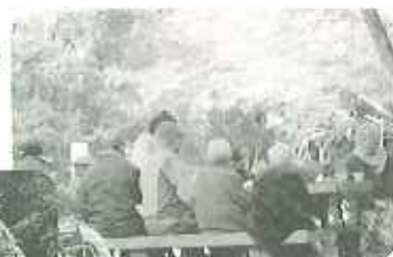
美味しいまんじゅうでした