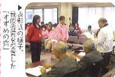
▶表彰式の様子。最優秀賞を受賞した「すずめの宿」