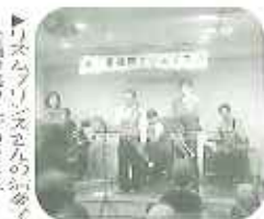
クリスマス会場の様子 会場は盛り上がりました。