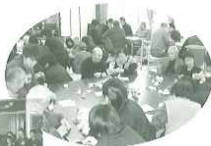
▲「昔はよく折り紙したよ」と会話がはずみます