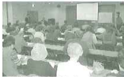
▲真剣に聞き入る参加者の方々

講義では、医師の立場としてこれまでの経験を交えながら、わかりやすく腰や膝の痛みのメカニズムや病気の予防などについて解説していたので、皆さん満足されることも、気を引き締め直すきっかけになりました。