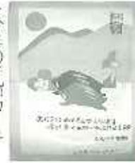
今年の年賀カード