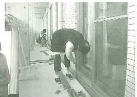
▲1年でこんなにゴミがたまるんだな～