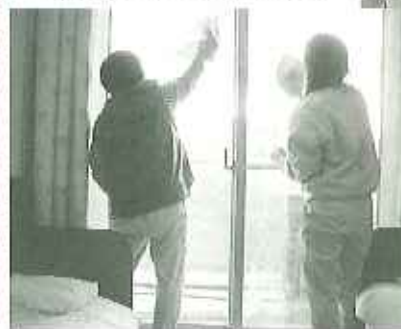
▼窓をみがいて、こんなにきれいになったよ！

会場へ入ると自分の作品がどこに展示されているのかみんなを探しました。それぞれの作品を見つけると「私のあったよ！」と笑顔で報告してくれました。