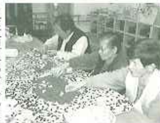
▶夜に口うるかしら?