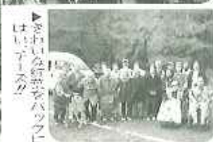
▲きれいな紅葉をバックにはいクリスマス