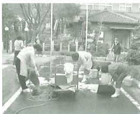
▲67名の保護者の皆様のご協力をいただきました

12月16日(土)、保護者会の皆様 のご協力で年末の大掃除を行いま した。年2回の恒例の大掃除とい