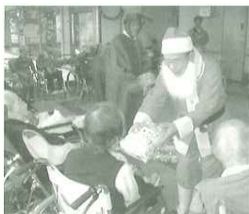
▶サンタからのプレゼントに皆さん大喜び

出し物、キャンドルサービスなど内容盛りだくさんのクリスマス会となり、皆さん「大変楽しかった。」「またやりたいね。」と感想をいただきました。