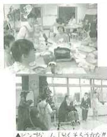
▲ピンゴム「早くそろつかない!」