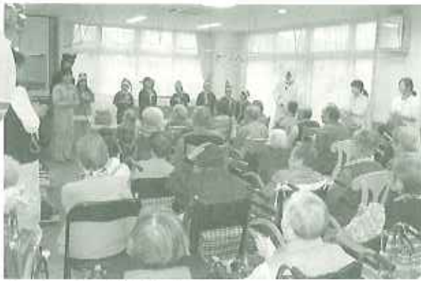
▲アルゴリズム体操を披露

日頃練習している手品や、歌、今流行っているアルゴリズム体操などを披露、手品では、ハンカチの色が変わったりすると、利用者さんから「わぁー」という歓声が