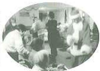
♪トトロの中を歩きました。