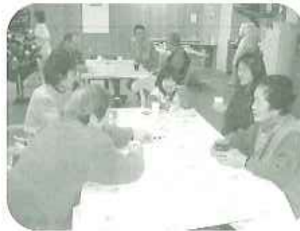
▼子どもたちとおしゃべりしながらおやつの時間を過ごしました