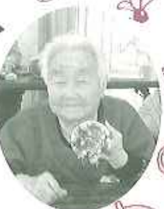
東山ふわあいアイサービスのひとこま。赤坂な笑顔を見せていただきました

昨年は民生委員をはじめ、地域の方々にお世話になりました。本年も、当事業所をよろしくお願ひします。