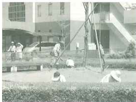
▲とよた苑の庭が美しく整備されました