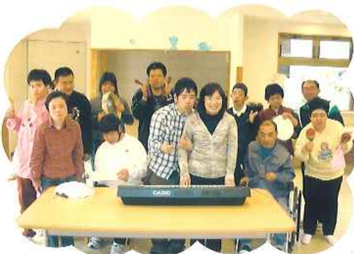
▶先生を囲みマツモにぎやか

利用者の皆さんは毎月2回の先生の訪問をととても楽しみにしていて、先生がお越しになると、さつ