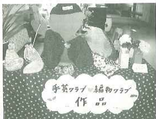
▲かわいい巾着袋や編み物の作品が並んでいます