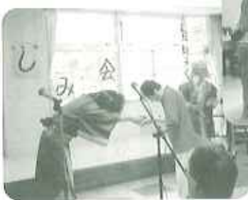
▲勝った人にはプレゼントが、「うれしいな♡ありがとうございます」