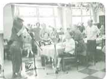
▲「あっくん」とジャンケン大会

6月21日(木)、殿姫チンドン「のボランテイアの皆様にケアハウス豊田へ来ていただきました。鮮やかな衣装を身につけて、ボランテイアさんと一緒に職員もねり歩きました。懐かしい曲が流れてくると、手をたたいて「えー誰が仮装してるの?」、「おもしろいね。」と皆さん大変喜ばれ、「もつとやってほしいねー。」との声もあがりました。職員が参加したこと、おたのしみ会がおおいに盛り上がりしました。