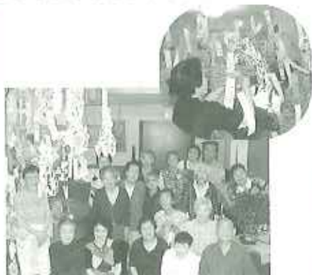
▲「短刊に願いを込めて…」みんなを飾りました