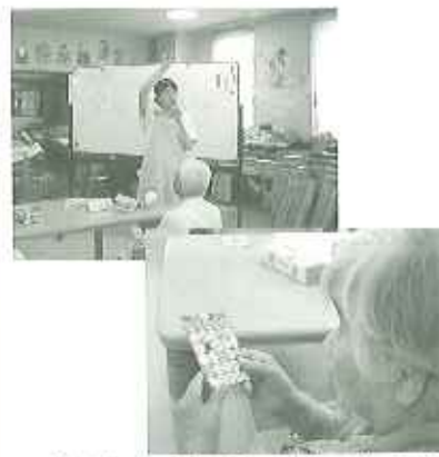
▲読まれた数字、この中にあるかな?

ました。皆さん読上げられる数字とご自分のピンゴカードを照らし合わせて、数字を追っていただきました。早くピンゴされた方には、ちょっとした景品が送られ、楽しい時間を過ごしていただきました。