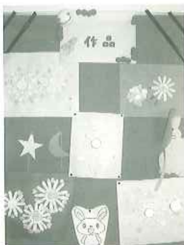
▲紙コップを使ったお花です。目の回りの物をよく使った作品を作ります。

春緑苑の苑内にはたくさんの方の作品が飾られています。その中の一部をご紹介します。