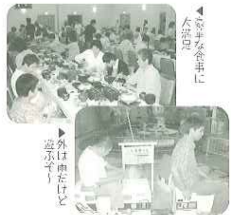
▶外は雨だけど遊んで

たあと、温泉や、ゲームセンター、ロープウェイ、買い物など、皆さん思い思いに過ごされました。