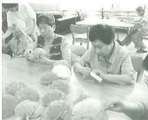
▲「誰はどんなんだったかな〜?」と思い出しながら

また、飾り終わったフロアを見て利用者の皆さんは口々に「華やかだねー」、「七夕らしきが出たね」、「安城にも負けないわ」、「七夕が楽しめたね。」などと言いました。