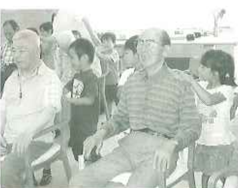
▲「いい女村もだな〜」とご満悦

6月15日(金)と18日(月)に、豊田市立東丘幼稚園の皆様による慰問がありました。歌や踊りの披露と手遊びや肩たたきなど、とても楽しい心と心ひとときでした。