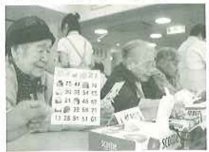
▲あと13が出ればピンゴ!

ました。皆さん読上げられる数字とご自分のピンゴカードを照らし合わせて、数字を追っていただきました。早くピンゴされた方には、ちょっとした景品が送られ、楽しい時間を過ごしていただきました。