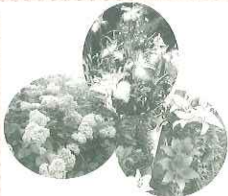
▲上から品揃に紫陽花、ゆりが色鮮やかに咲いています