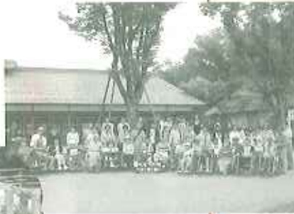
ピクニックの勢いにピクニック