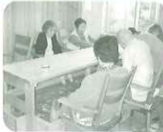
ウッドデッキでお昼ご飯やティータイム