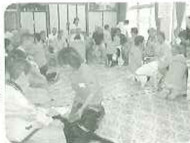
▲早く私のところに来ないかな