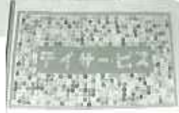
▲こんな華やかなデイサービスになるといいな！