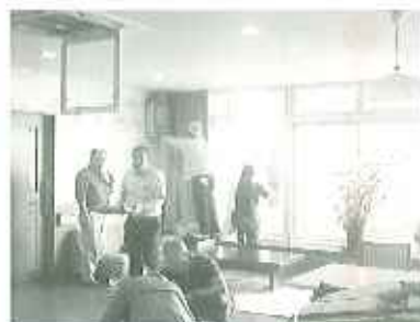
▶利用者さんもおかわりになった苑内外に入替して下さりありがとうございました。

午後は天気がよく、暑い中での外掃除となりましたが、ご家族の皆様のおかげで苑内外がとてもきれいになりました。