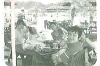
▲青空の下で皆さん笑顔