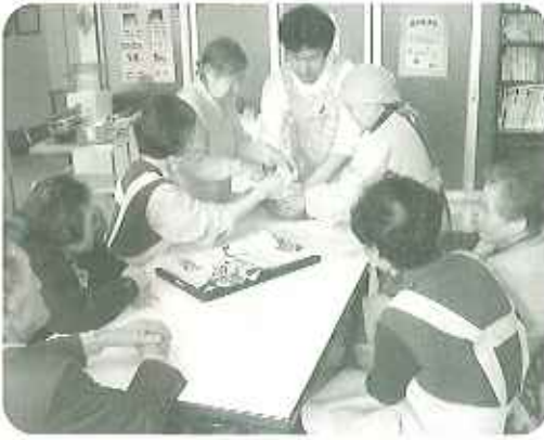
毎日のおやつレシピは10種類以上！皆さん積極的に参加していただいています。

普段、家庭では料理をされたことがない男性の利用者さんもおやつ作りに参加して下さり、やりがいを感じていただいています。