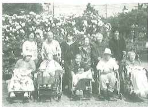
▶きれいなバラの前で「ハイ、ポーズ！」

午後は天気がよく、暑い中での外掃除となりましたが、ご家族の皆様のおかげで苑内外がとてもきれいになりました。