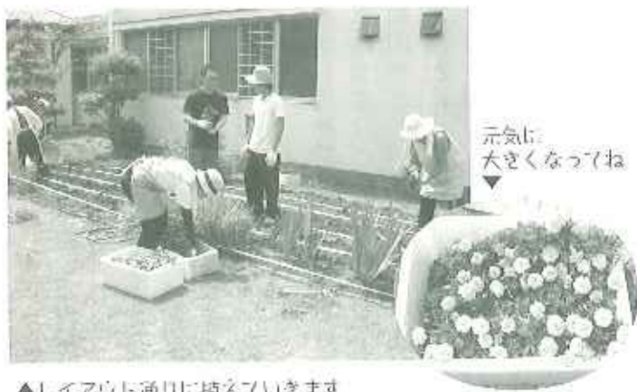
元気に大きくなってね

職員で花壇のレイアウトを考え、現在小さいながらもすくすくと育っています。利用者さんも窓から