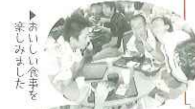
▲おいしい食事を楽しめました

6月20日(水)にバスハイクで、ラグーナ蒲郡へ行ってきました。当日は、梅雨入りしたにもかかわらず、晴天に恵まれ、始終笑顔で楽しめました。