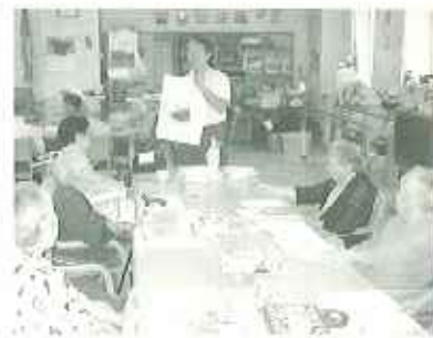
▲食事の前には水口の体操を行います

口癖ケアに入れており、毎食後、利用者の皆さんの歯みがきを欠かさず行っております。また、マッサージチェアが多く整備されており、空いた時間に利用していただき、利用者の皆さんにくつろぎのひとつを提供しております。