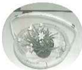
▲蒸気な花が咲きました

費支援の方が咲かされ、たくさん増やされている花の一部です。花は庭いっぱい咲いており、それは見ごたえがあります。ご本人はリハビリの一環としてやっていらっしゃるようですが、さすがに花を育てていただくのは大変なことです。