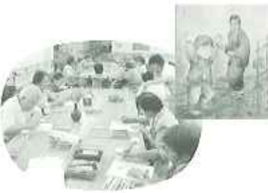
▲皆さん一室に揃ってのリハビリにも効果的

口癖ケアに入れており、毎食後、利用者の皆さんの歯みがきを欠かさず行っております。また、マッサージチェアが多く整備されており、空いた時間に利用していただき、利用者の皆さんにくつろぎのひとつを提供しております。