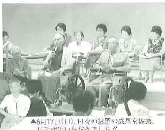
ちょっと緊張してるかな