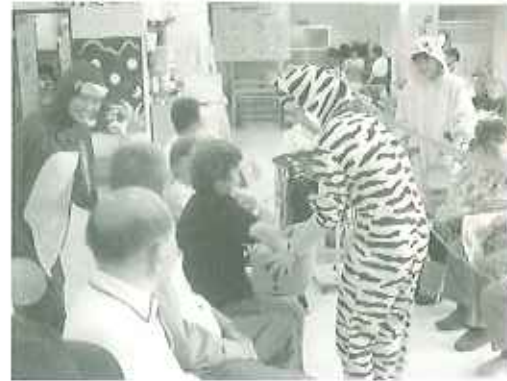
▲着ぐるみをまじった学生さんに利用者さんたち笑顔