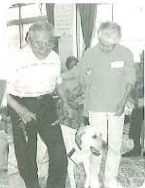
▲エルサはおりこうだね