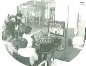
▲リハビリを兼ねたWiiマゲーム大会

広々とした空間の中に、ヒノキの足湯やウッドデッキなどがあり、ゆったりとくつろいでいただけます。また、社交ダンス教室やお茶教室など、ちょっと変わったレクリエーションも取り入れ、利用者の皆さんに楽しんでいただきたいと思います。