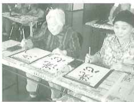
▲6月20日(水)、書道教室を行いました。「夏まつり」、「お水」、「清湯浄水」のお題に、皆さん真剣に取り組みされました。