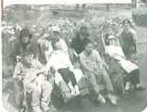
▲たくさんの緑に囲まれて気持ちいい