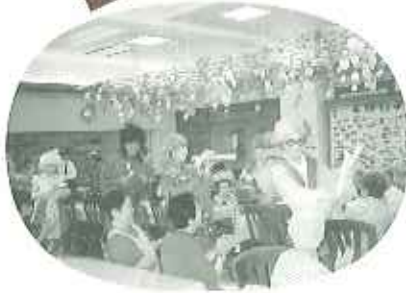
▲誰だか分かるかな?!