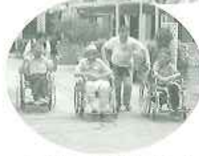
▲ラグーナ蒲郡は広々!