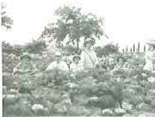
▲たくさんの紫陽花に囲ま

食後には園内を散策しました。皆さん特に喜ばれたのが7万株の紫陽花で、両側に並ぶ紫陽花の花を見て「わー、きれい。」と声を出す方や、1株の紫陽花をじっくり見つめている方などとても満喫されていました。