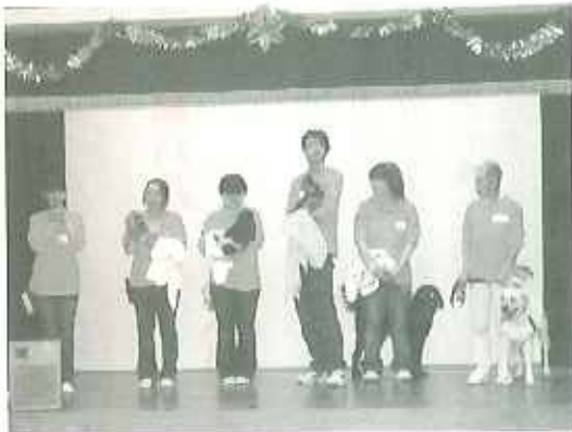
▲ワンちゃん勢ぞろい

第1部はワンちゃんのファッションショーで、夏ということもあり、ゆかた姿で登場。第2部は5頭の犬とのふれあいを行いました。以前にも来苑してくれたゴールデンリトリバーのエルサちゃんのことを覚えている方もおり、「去年も来たよね。」「新園運ぶ犬だね。」と会話ははずみ、あつという間にふれあいは終わってしまいました。利用者の皆さんは、犬とふれあうことで本当にすてきな笑