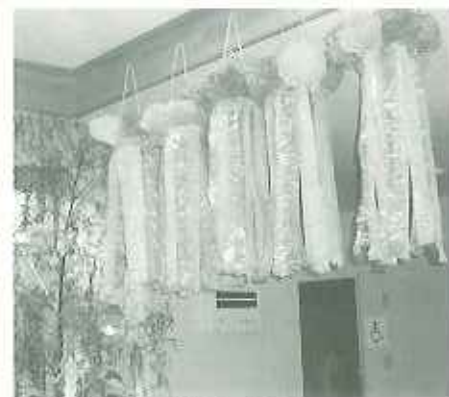
▲「大七夕祭の仲間入り?」