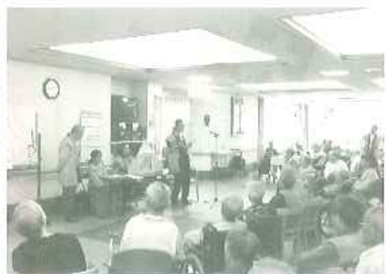
▲紙芝居は懐かしいね～