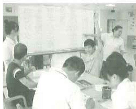
▲う〜ん、なかなか解けないなあ〜

学校を卒業したのに勉強?...と思いつつも、「どうしたら楽しいかな」と、ない頭をひねり、週2回、学習活動を行っています。