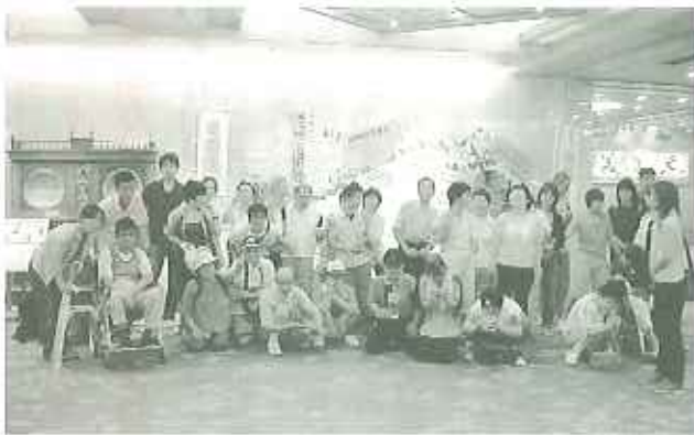
▲ホテルに到着。ハイチーズ!

朝からあいにくの雨となつてしまい、屋外の乗り物を楽しむことはできませんでしたが、隣接するホテルでの豪華な昼食をいただきたい。