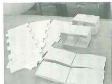
▲ハッフル板(左)とZ-10(右)の完成したもの