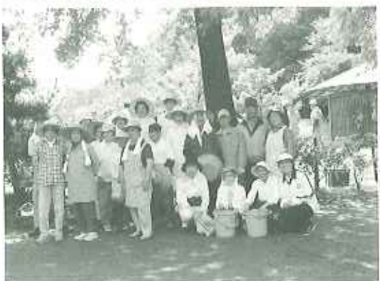
▲皆さん揃って、「いっぱい採れたよ〜!」と満足顔