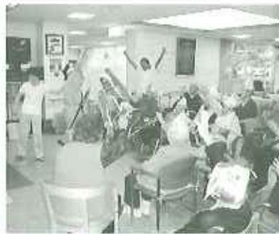
▲様々な季節の行事もにぎやかに盛り上がります

積極的にボランティアさんを受け入れており、フロアが広いため団体の慰問も多くあります。たくさんの人と触れあえるので、利用者の方々に様々な交流の輪が広がっています。また、車イスが通れないところでも利用者さんを抱えて送迎し、どんな方でも安心して利用していただけるように努めています。