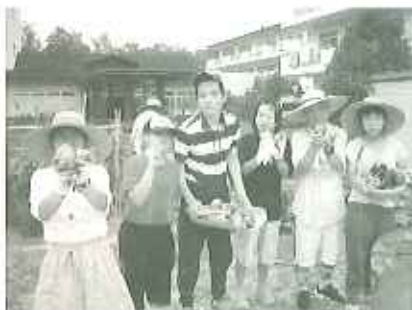
▲こんなに大きく育ったよ〜

収穫した野菜は、利用者の皆さんが召し上がるほか、玄関前で販売もしています。また、別の畑ではさつまいもも育てており、秋に焼きいもを楽しむ予定です。