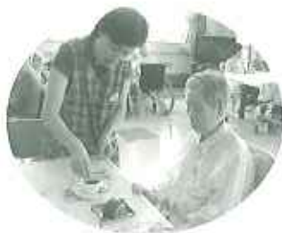
▲おいしいお茶をめしあがわ

「今日は暑いから冷たい物がおいしいわ。」「私は甘い物が大好きなの。」「などと利用者さんとボランティアさんが笑顔を見せながら会話も弾み、楽しいひとときを過ごしていただいております。