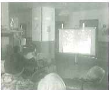
▶毎回、映画の時間が楽しみですよ。

去る5月にDVD一休型映写セットを購入し、6月からいよいよ各ユニットにおいて利用者の皆さんの好きな映画を大画面プロジェクターにて、鑑賞することができるようになりました。さっそく、2丁目1番地で映画が始まる。隣のユニット