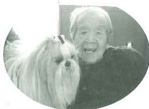
▲2月28日(木) 動物慰問 「かわいいワンちゃん」と笑顔で記念撮影!