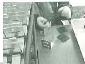
▲ここまでできたらあと少し!

注文は1回で500~600個入ります。多い時は3日連続で注文が入りますが、皆で力を合わせて頑張っています。