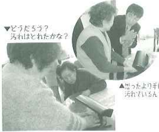
▼どうだろう？ 汚れはとれたかな？