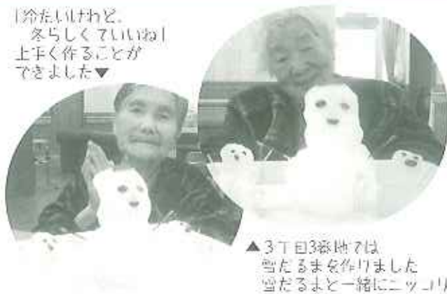
▲3丁目3番地では 雪たまるまを作りました 雪たまるまと一緒にニコリ