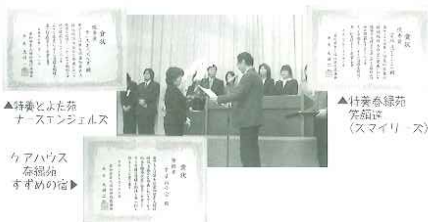
▲特養とよた苑 ナースエンジェルス