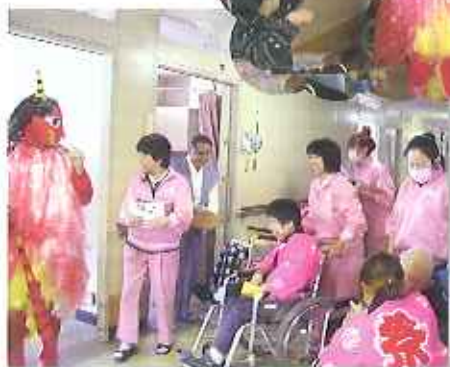
▲春日苑にも鬼が来たよ!!