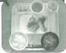
お楽しみ、ハマグリのお吸い物など季節のメニュー▶