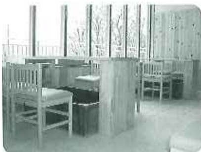
▶1階の足湯コーナー 外を眺めながらゆっくり

3月26日(水)に内覧会を予定しております。興味のある方、お近くの方はぜひお越しください。