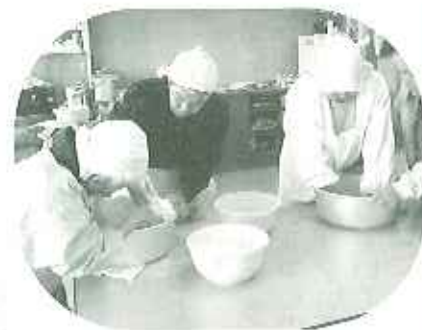
▲「百たぶよりやわらかく…」湯の加減に気を配ります