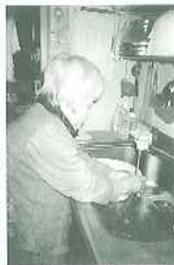
▲丁寧に洗ってくださいます

全員がやってくたさるの、毎食後の食器洗いです。「自分の食べた食器は自分で洗おう。」というので皆さん自分の使った食器は、自分で洗っています。利用者さんの中には、職員の分も「ついでに洗っておくねー。」と言って洗ってくださる方もおり、職員は大助かりです。洗った食器は、布巾で拭いて、食器棚に片付けて完了。たまには片付ける場所を間違える方もいらっしゃいますが、それはご愛嬌です。