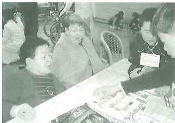
▲すごろくで真剣勝負

2月6日(水)に九久平小学校の5年生の児童さん24名が職場体験学習のために来苑されました。初めは緊張していた様子もありましたが、歌を歌ったり、手作りのプレゼントを渡したり、ゲームをして利用者の皆さんとふれあっていました。利用者さんもかわいい子どもさんとふれあい、元気をもらっていました。