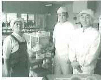
▶スズゼンの皆さん