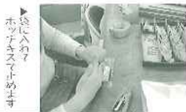
▲袋に入れ、ホッチキスで止めます