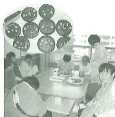
▲2月12日(火) 女性利用者皆でチョコ作り。男性利用者、職員へ愛をこめて