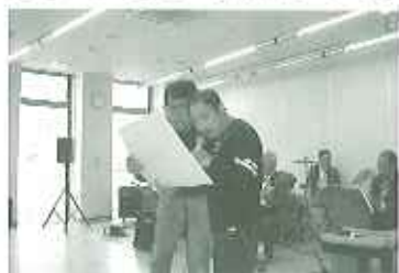
▲利用者さんも飛び入り参加!

奏・ボーカルのボランティアの皆さんが来所され、演歌を中心とした約10曲を披露してくださいました。利用者の方々は、演奏に合わせて歌ったり踊ったりで人騒がせ。たくさん笑顔を見せてくれました。