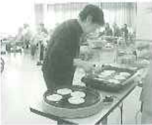
▶うよく焼けたかしら？

2月24日(日)、「手作りおやつに何がいいかしら？」と利用者さんと皆で相談し、寒い時期