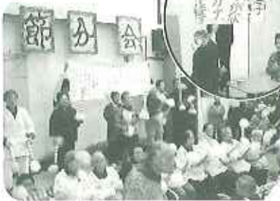
▲一世を回席したあの佐賀のばあちゃんを名占屋科にアレンジ☆

2月29日(金)に作ったおこしものは、米粉・もち粉・砂糖・塩の絶妙な分量でもっちりしたほんのり甘いおこしものが完成★