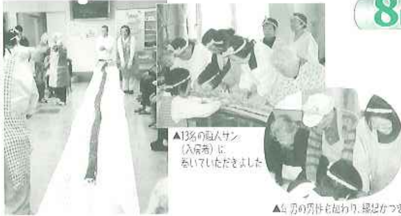
▲13名の入居者(入居者)に巻いていただきました

まず、2mの巻きすに、酢飯1升、のり1枚をつなげ合わせます。次に、かんぴょう・キュウリ・にんじん・下子焼き・花でんぶの