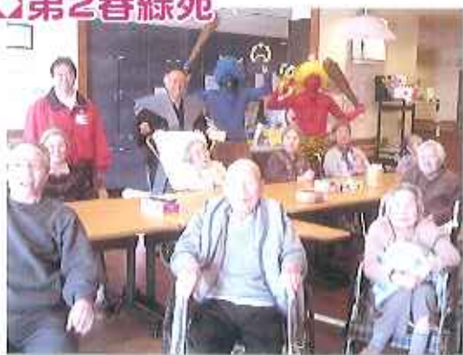
▲「鬼は外! 福は内!」とユニットがにぎやかに