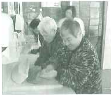
▲きれいに洗ったよ

2月21日(木)、サラヤさんに、利用者さんに対して手洗いの大切さを教えていただいた後、手洗いのやり方について講義をしていただきました。