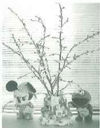
▶こちらが完成したかわいい餅花

「さあ作ろう!!」の掛け声とともに、「手が汚れた。」「気持ち悪い。」「楽しいよ。」と室内からは様々な声が…。好きな色を選び、粘土に捏ねていきます。お団子にし、へびにし、そして枝に巻きつけていきました。なかなか上手に枝に付かず悪戦苦闘の木、できた!!と思ったら、「あっ!!花器がない。」、翌日からさっそく発泡スチロールを使った独創的な花器を作りました。2週間ほどかり出上がった餅花と花器。玄關で毎日皆さんを出迎えてくれます。