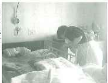
▶丁寧に掃除を していただきました

3丁目1番地に入っていたとき、利用者の皆さんとお話したり、居室の掃除をしたりしていただきました。ひ孫と同じくらしい実習生に利用者の皆さんも「かわいいねえ。」と、会話にも自然と笑顔があふれていました。