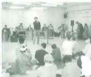
「フジのゆけの歌」演奏! 東郷町吹奏楽会の方と

ホールは、まるでコンサートホールのような熱気に包まれました。保護者の方のご紹介により、18名の楽譜演