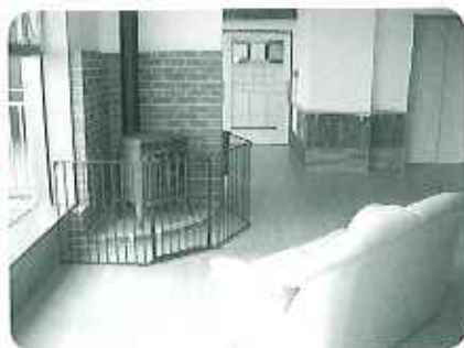
▲4階の談話コーナー 暖炉の前でくつろいでいただけます