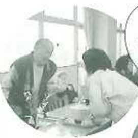
▲入居者さん全員に愛を届けます