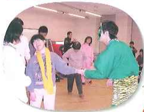
▲利用者さんが鬼と握手!? サンホームでは鬼とも仲良く盛り上がりました