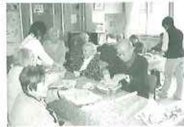
▲個性あふれる植木鉢

デイサービスでは月に1回陶芸教室を開催しています。瀬戸物の町、瀬戸市から粘土を仕入れ焼成まで行っています。