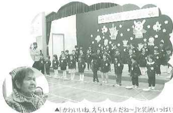
▲「かわいいね、えらいもんだね～」と笑顔いっぱい