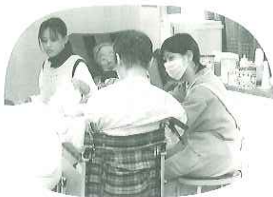
▲初めての食事介助 うまくいきるかな