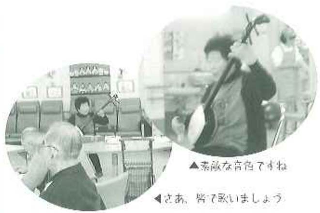
▲素敵な音色ですわ