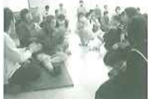
▲次第に笑顔が広がりました

2月22日(金)、益富中学校の生徒さん26名、先生1名が来所され、手づくりの雑巾を寄贈していただきました。また、質問タイムや風船パレーを通じて、利用者の皆さんとの交流を深めることができました。ご寄付ありがとうございました。