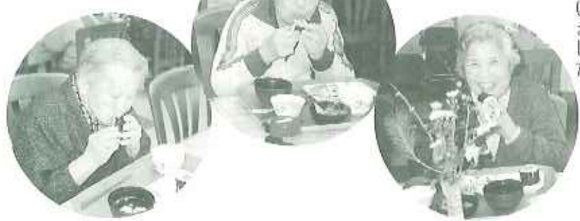
▲大きく口を開けてまるかぶり