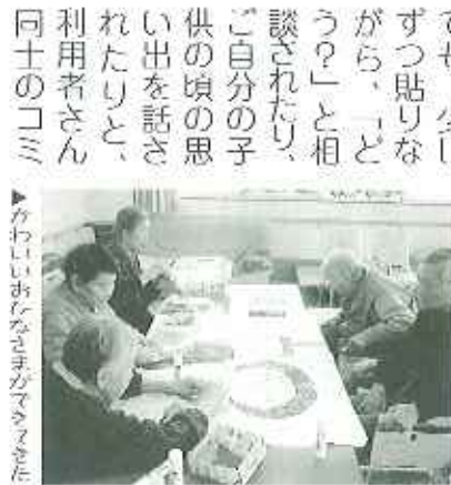
▶かわいなおひなさまがマアアきた

シヨートステイでは、今、おひなさまの貼り絵を作っています。最初は、利用者さんから、「細かいことは苦手なの。」「どうするの?」などの声も聞こえました。でも、少しずつ貼りがら、「どう?」と相談されたり、ご自分の子供の頃の思い出を話されたりと、利用者さん同士の「コミ