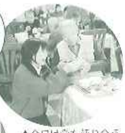
▲今日は愛を語り合う大切な日♡