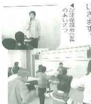
▲保護者の皆さんで健康体操のあいどつ

2月16日(土)、今年度2回目の茶話会が開催され、保護者の皆さん7名との個別面談を行いました。厳しいご指摘もいただき、今後の支援にしっかりと反映させていただきます。