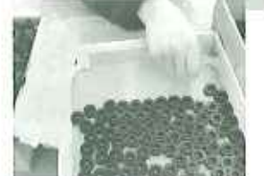
▲たくさん丸ゴム!根気のいる仕事です