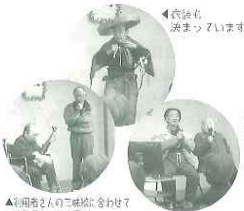
◀大団円仲良く歌いました!!