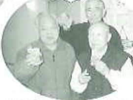
▲皆さんの笑顔が大好きです

8メートルの恵方巻きに挑戦 ケアハウス豊田にて 酢飯1升、のり1枚 かんぴょう、キュウリ、にんじん、下子焼き、花でんぶの具材を順に乗せ、6人の呼吸を合わせたところで、かけ声と共に巻いていきます。恐る恐る巻きすを離していくと、「わあ〜できたできた」と歓声、拍手が沸き上がり、ねじりハチマキをつけた職人さん(入居者)も、できあがり満足気な表情で、「上手にできたわー。」「味も最高に美味しい、天下一品の巻き寿司ができたね。」と、絶賛されていました。