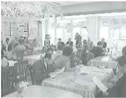
▲たくさんのご家族に参加していただきました