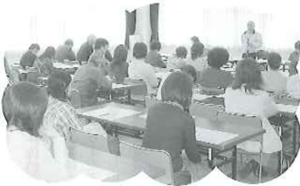
▶大勢の方にお集まりいただいた総会