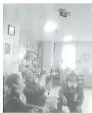
▶「まわった、まわった」

最初は真剣な表情で皿を回していましたが、その内、余裕で笑顔も見られるようになり、「なせばなる」でとても自信あふれたすてきな笑顔になっていました。何回も挑戦される利用者さんもおり、上手にできると拍手喝采で楽しいひと時を過ごすことができました。