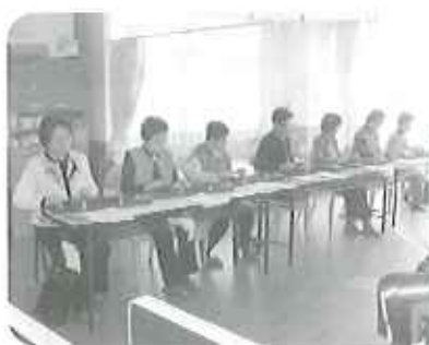
▲童謡や歌謡曲など懐かしい曲を堪能