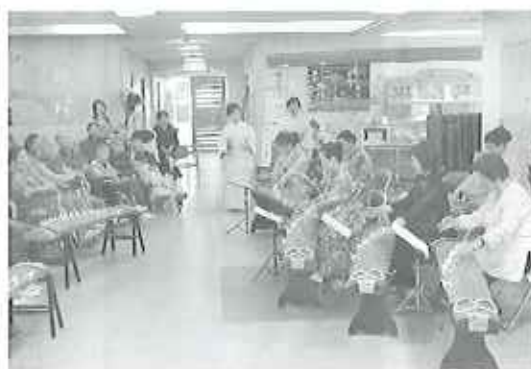
▲聞き入っていました