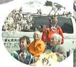
▲桜がこんなに近くに！