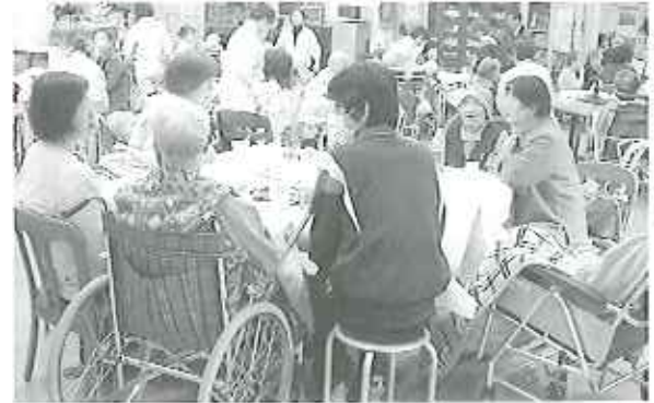
◀ご家族と一緒に昔話に花を咲かせました

年度決算報告、平成20年度事業計画、平成20年度予算について審議され、異議無く可決承認されました。