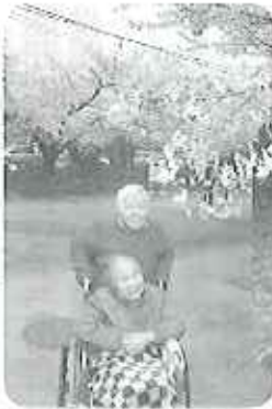
▲本当に桜はきれいだねえ「木当だねえ」