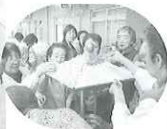
▲朝早くから皆さんで協力