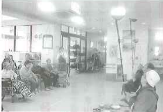
▶見事な皿回し「すごいなあ!」

色々な皿が上手に回されるのを見て利用者の皆さんはびっくり。次に、坂神様から「皆さんもやってみましょう。」と声をかけられると、最初は利用者さんは「とてもできない。」と少し込みきされていました。しかし、