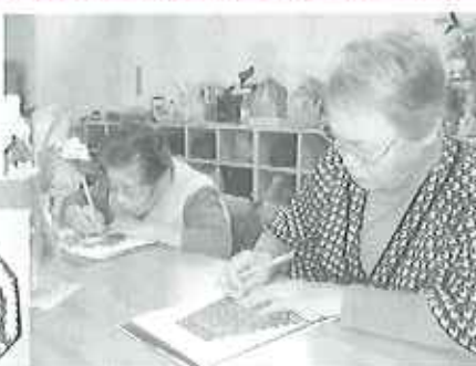
▲出来上がりが楽しみます