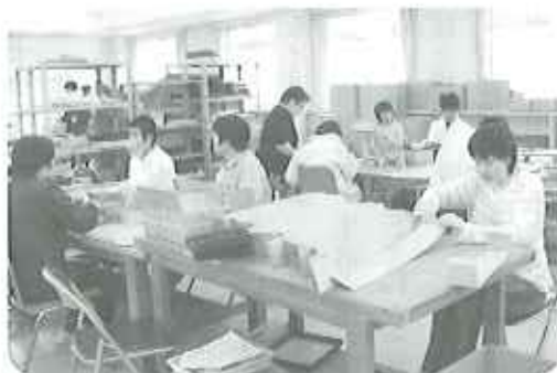
▲仕事が入って大忙し

それぞれ皆さん担当の仕事がありますが、忙しい時は協力して仕事を進めています。急な注文にも、すぐに対応しています。これからも新しい仕事にどんどんチャレンジしていきたいです。