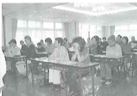
▲多くの保護者の方々に出席いただきました