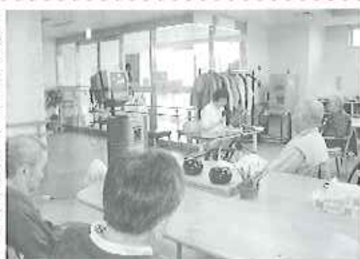
▲お話にどんどん引き込まれます

聴いている利用者さんの中には感極まって涙を流す方もいました。心に響く静かな時間を、これからも大切にしていきたいと思えます。