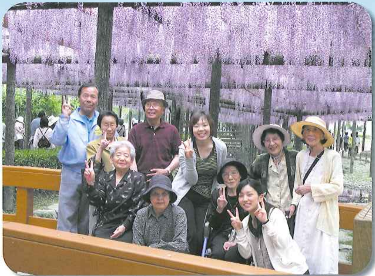
ケアハウス春緑苑の皆さんが天王川公園藤まつりに出かけました