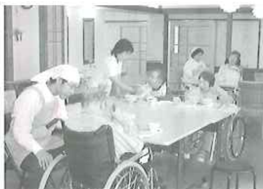
▶おいしい食事の時間 なごやかな雰囲気

ユニットケアということで入居者さん一人ひとりの時間を大切にしたいケアをしていきます。また、利用者さんが楽しんで生活していただけるよう、各ユニットの特色をだし、家庭的な雰囲気作りを目指し、職員も頑張っています。