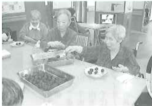
▲皆さん、手際よくあんこを丸めていらっしゃいました

4月15日(火)、4丁目1・2番地の利用者さんでおやつに「うぐいす餅」を作りました。 「あんこを丸める作業は比較的簡単で「もうないの?」と、とても積極的な利用者さんや味見