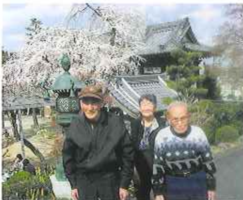
▲安長寺の桜をバックに

▲とよた苑では様々な場所にお花見に出かけました。平戸橋公園の桜の前で笑顔も満開！