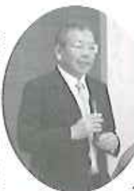
▲後藤会長よりあいさつをいただきました