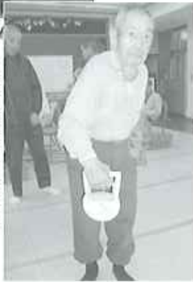
▶私は85歳。握力右16kg左18kgだよ