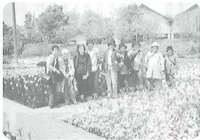
▶日本の花まつりへ！ 何度かも足を運びたくなるすばらしいところですよ

で見事な作品を製作してくださいます。今年も人形を十数体製作。動きのわるい右手も一生懸命動かして人形の部品を折り集め、時間を掛けて丁寧に作りました。