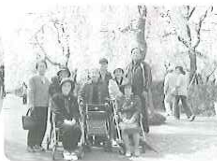
▲見事なしたわ桜の前でハイチーズ☆

「こんなに見事な枝垂れ桜初めて見た!」と大感激しつつ、「花より団子」と言わんばかりに屋台のみたらしや焼きそば、お土産を食べ歩き、大満足で帰路につきました。