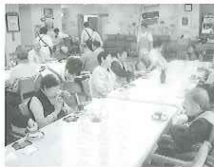
▲お飲み物は何にとれますか?