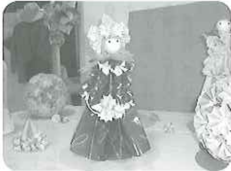
▲フランス人形みたいでしょ