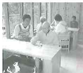
▲午後の穏やかなひととき

足湯コーナーの隣には喫茶コーナーもあります。コーヒーを飲みながら足湯はいかがでしょうか。疲れた時や寒い時、ぜひ使ってください。ご家族の方もお気軽にどうぞ。