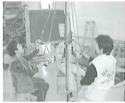
▲ボータブルマシンワックスを使っておました