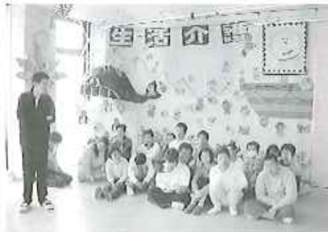
▲力を合わせて頑張ったぞー!

「キレイ!」「僕これやる!」そんなみんなの声が聞こえてくるのは、記念祭の準備活動。フラスチックにマシックで色を塗ったり、鉛筆立てに皮をボンドで貼ったりして作っているのは、バザーで売るための作品です。時には、思ったような作品が作れずに、「記念祭に間に合うのかなあ?」なんて、不安な言葉も聞こえてきました。1年の中でも、とても忙しい時期で慌ただしいですが、この記事が読まれる頃には、みんなの笑顔でいっぱいだと思います。