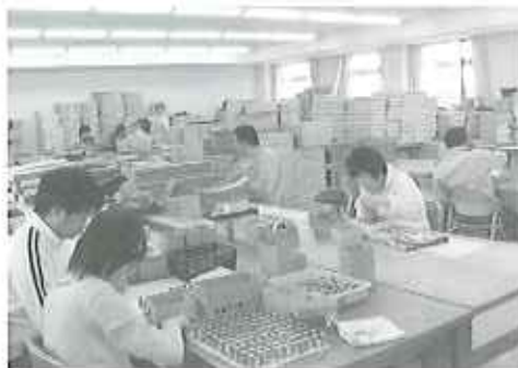
▲みんな、一生懸命です

開設して1年が経ちました。1年前に比べて仕事も増えて、皆さん張り切って仕事に励んでいます。