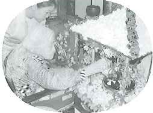
▶4月21日(日)花まつり 花御堂に抹茶をかけてあげてあげたいです