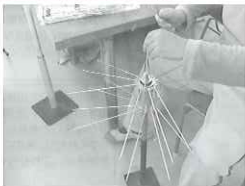
▶これがリアカーの車輪になります