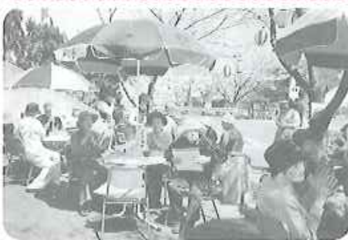
▲会食もカラオケも盛り上がりました

田菜・ねま・焼きそば・豚 汁・おにぎりなどのご馳走が気 分を盛り上げてくれました。食 事をしながらのカラオケ大会で は、皆さん自慢の歌声を披露し てくださいました。隣に座った 方のおしゃべりでは、「昔は、 近くの川沿いにおにぎりと水筒 を持って出かけたものだよ。」 「わしは、散歩道に桜がいつぱ いあったよ。この時期はええな あ。」などの声がかたがた、春の 楽しいひと時を過ごされました。