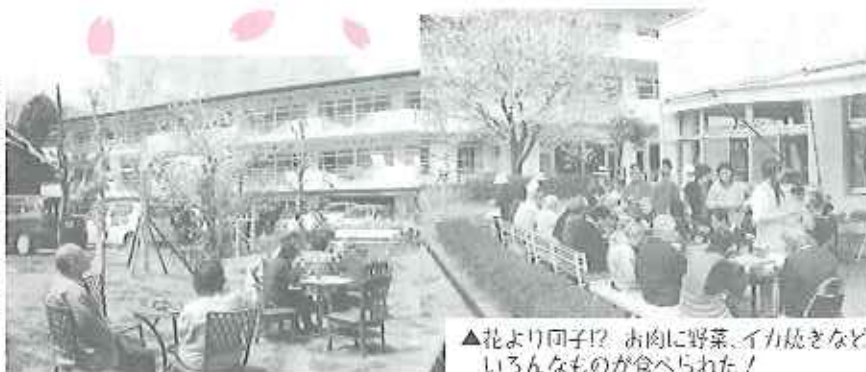
▲花より団子!? お肉に野菜、イカ焼きなどいろいろなもの食べられた!

満開の桜の下、昼食にパーベキューを行いました。「明日はごちそうだね。」と前々から楽しみにされていた方も多く、屋外での食事は、みんなの食のすすみもよかったです。