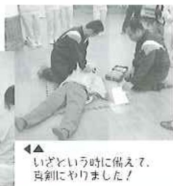
いざという時に備えて、真剣にやりました！