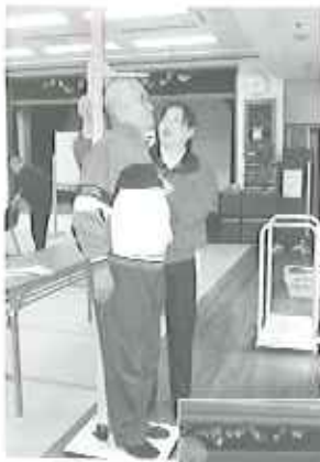
▶わしはまだまだ成長するぞ