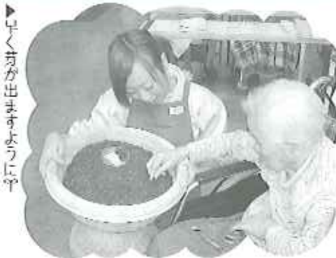
▶早く芽が出ますように

4月17日(木)、園芸クラブであさがおの種まきを行いました。まずはプランターに土を入れ、