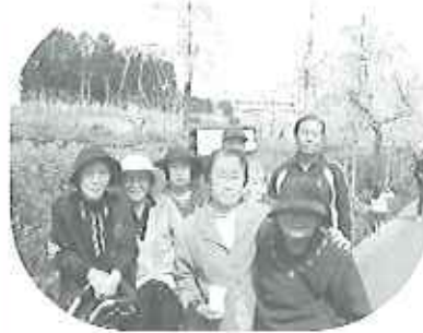
▲春のフルーツパークはとってもにぎわっていました