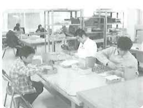
◀静かに仕事に集中します