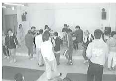
▲リズムに乗ってラララがの