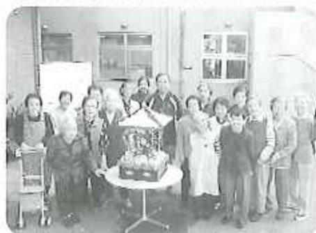
▲完成☆きれいになりました

「こんなに見事な枝垂れ桜初めて見た!」と大感激しつつ、「花より団子」と言わんばかりに屋台のみたらしや焼きそば、お土産を食べ歩き、大満足で帰路につきました。