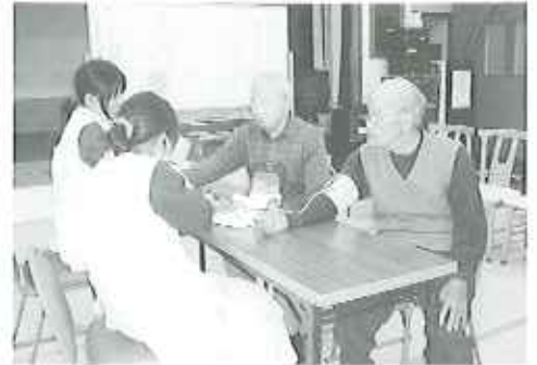
▲かわいい子。目の前で血圧があがるな