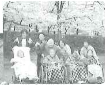
▲満開の桜の下で「ハイ、チーズ!!」

今月は近くの王子製紙や落合公園、東谷山フルーツパークに定光寺とユニットごとで思い思いの場所へ花見に出かりました。