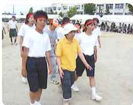
▲中学生と入場行進

6月1日(日)、美里中学校体育祭の地区別玉入れに、4名の利用者さんが参加しました。利用者さんと生徒さん2名でグル