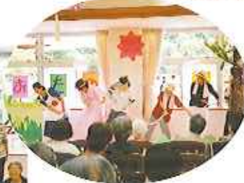
▲うんとこしょ! どっこいしょ!

当日は雨上がりの花見りで散策するには最適。色とりどりの隣接して動物園があり、象のふじや、ミニアキアットの愛らしさにしばし足が止まり、単心に帰って魅入っていました。真福寺での竹膳料理では竹の子のフルコースを堪能され、その後、本堂でのお参りで、お払いをして頂き「今日はいよいよを過ごした。」と喜ばれました。