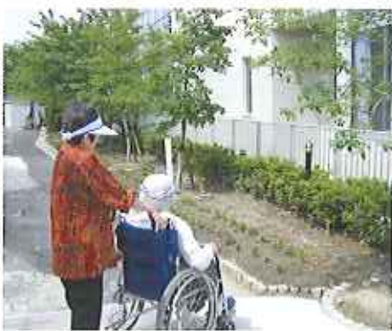
▶お散歩が楽しくなりました

演奏や歌も披露していただき、利用者さんも昔懐かしい音楽に思わず口ずさまれ、拍手喝采となりました。