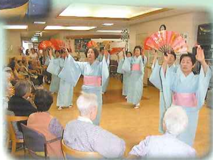
松平銭太鼓様(左)、いきいき民舞様(右)がとよた苑デイサービスセンターに来苑