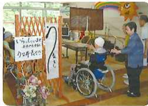
▲とよた苑の出前店にお客様来店です

当日はのれんや看板を掲げ、若物を着た店員さんがお出迎え。皆さん、うなぎや割子弁当など、思い思いのものを食べられ、「とてもおいしかった。」「またこのお店に来たい。」と大変満足され笑顔が絶えませんでした。