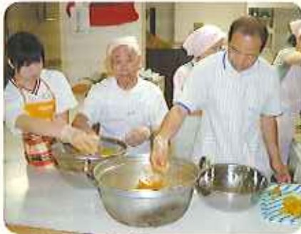
▲出来上がりを楽しみ♪

その後、取ってきた梅でジャムを作りました。一つずつ丁寧に洗ってへたを取る細かい作業も集中して行いました。みんなで協力して作ったジャム