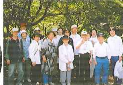
▲夢中になって収穫しちゃいました!