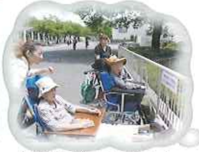
▲6月17日(日)、東山動物園へ! 暑かった 色々な動物に会えたよ