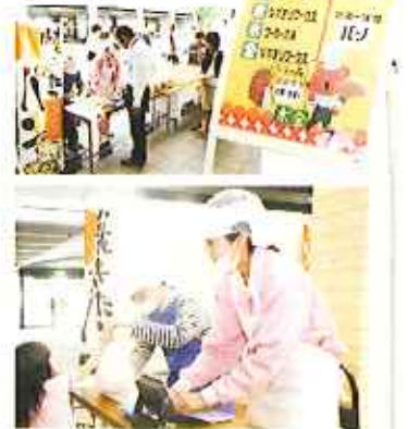
▲広報春日井 平成20年6月1日掲載

1年たって、ますます元気! (市役所市民ホール) 授産施設などを利用している人たちが作った商 品を、市役所で販売する「元気ショップ」が平成19 年5月に開店してから1年がたちました。 販売されているパンや豆腐、スカーフなどの商 品は、市役所を訪れた人たちに人気で、出店して いる1店舗での売り上げはこの1年同様に伸びて きています。6月13日(金)～14日(土)に行われる エコライフフェアにも2つの施設が出店すること となり、元気ショップ以外での出店機会も増えて います。 開店当初は販売時に、時間がかかってしまいト ラブルになったところもあるようですが、今は販 売する量も増えつつあり、元気な声で通り掛か った人に呼びかけていました。