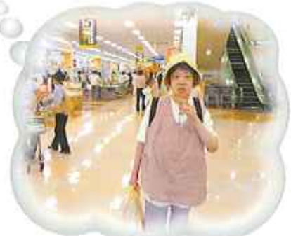
▲6月19日(木)、5人でアピタへ お買い物♪