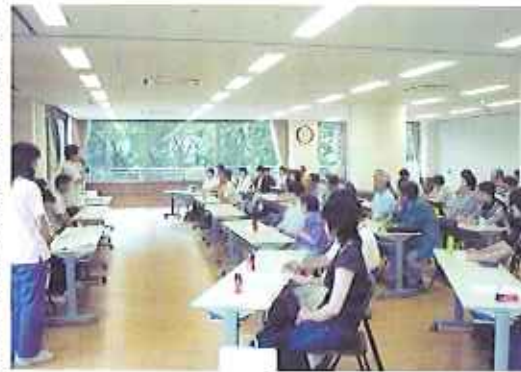
▶多くのご家族の出席をいただきました

6月28日(土)に第2とよた苑 家族会設立総会を行い、多くのご家族の出席を得て、家族会の設立が承認されました。