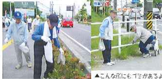
▲こんな所にもゴミがあるよ