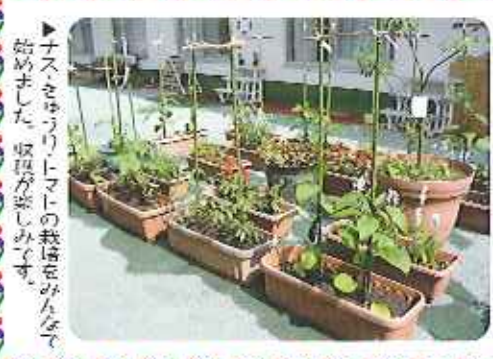
ナスをやりとりトマトの栽培をみんなが 始めました。収穫が楽しみです。