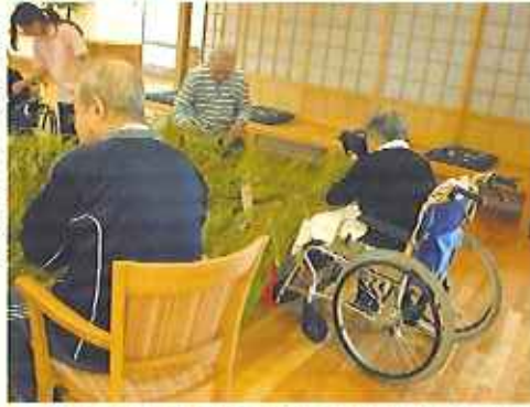
▶願いを叶うといいな