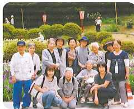
▶初夏の風に揺れるお花を楽しみたいとき