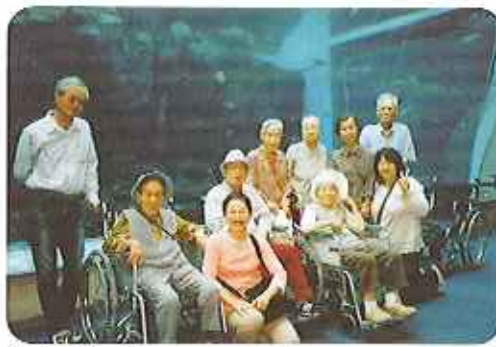
▲水槽の前でたくさんの魚たちと