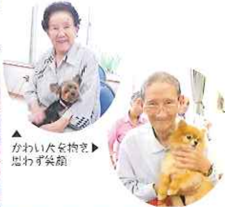
▲かわいい犬を抱き 思わず笑顔