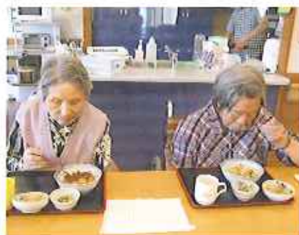
▲味噌カツ、たまご丼どちらも美味しいよ!