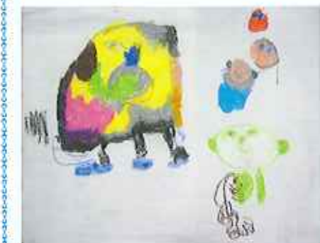
▲ウの絵を描きました

午前を「個別活動」、午後を「全体活動」とし、団体生活の中で「仲間と力を交わせる喜び」、「仲間を思いやる気持ち」を大切に、自分の意志を表すことが目標です。利用者さん・職員、みんなのひらめきでどんどん発