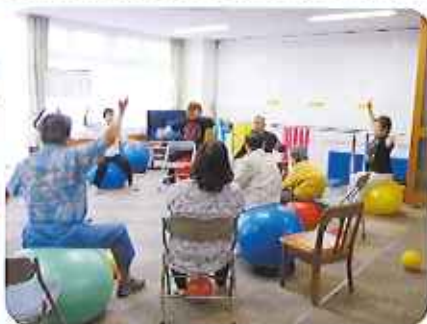
▲フィットネスでいい汗かきます

健康維持に欠かせないフィッ トネスマシン、カフオケルーム、足湯、囲碁、将棋、麻雀、全身体 マッサージ機などがお一人おひと