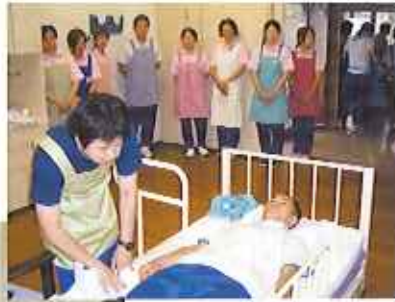
ベッドでのオムツ交換