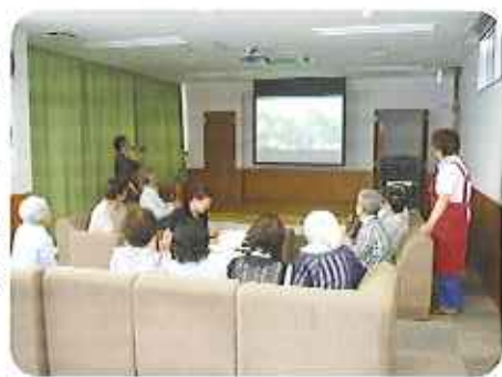
▶カラオケルームで熱唱