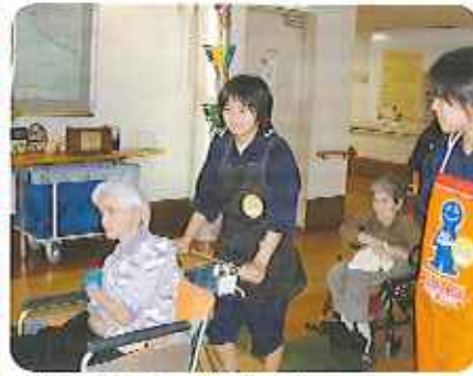
▲笑顔で頑張っています！