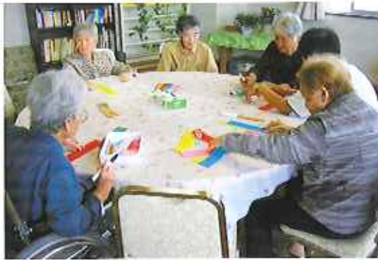
にぎやかに短冊を書きました