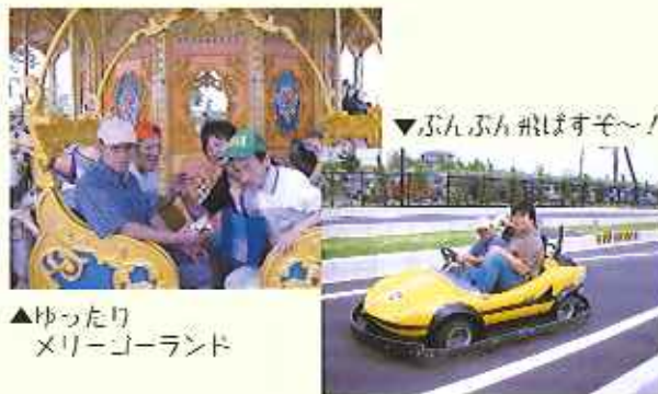
▼ぶんぶん飛ばすぞ〜!

黒流し染め体験では、色々な色をハンカチに染めて、世界に一つだけのハンカチを作り、皆さんとても楽しむことができました。