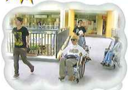
▲6月30日(日)、ジャストリーム長島へ 観光バス2台で出かけました。 たくさん買い物するぞー!