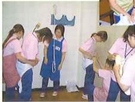
実際に演習しながら学びました