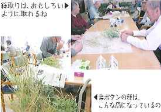
種取りは、おもしろいように取れるね