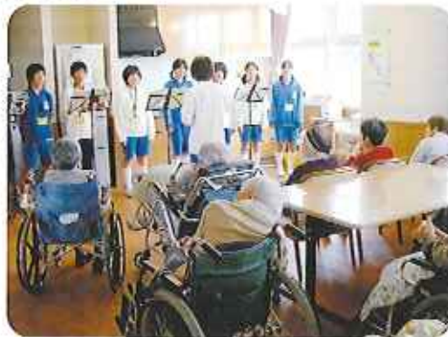
▶利用者さんから拍手喝采