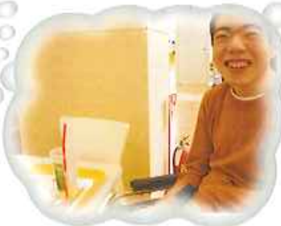
▲6月20日(金)、 アピタで昼食 おいしかった!