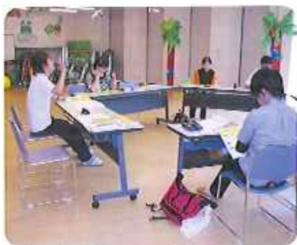
▲サンホームについて説明中

この講座は一般の方を対象に、サンホーム豊田の説明や障がいについての話をさせて頂いたいただきました。参加してくれたスタッフは4名でしたが、「こういう物利用者さんが作れそう。」「などの案をいただいたり、「時間をみつけて(ボランティアに)参加させていただけます。」といった前向きな意見をいただいたりしました。