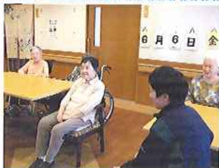
▲休憩時には楽しくお話

6月2日(月)～6日(金)の5日間、春日井高等養護学校の生徒さんが体験学習に来ました。初日は、緊張している様子でしたが、利用者の皆さんからの温かい声かけで最終日には緊張もほぐれていました。また来てくださいね。