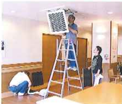
▲隅々まできれいになりました!

今回は83名61家族の方が参加してくださり、苑内外、隅々までピカピカになりました。ありがとうございました!