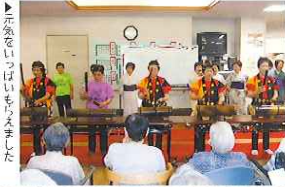
▶元気をいっぱいもらえました

そして、最後に利用者さんと職員・慰問の方達全員で踊るピンコロ音頭では、皆さん元気に、そして笑顔で踊られていました。皆さん銭太鼓の友達が来られることをとても楽しみにしています。