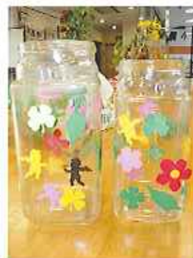
▶かわいいピンになりました