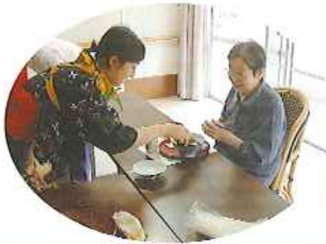
▲うなぎや割子弁当、思い思いの健康に過ごしましょう