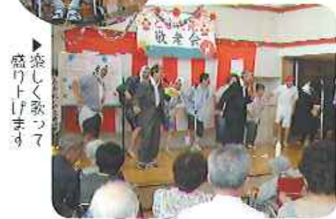
▶楽しく歌って盛り上げます