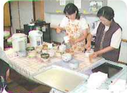
▲9月11日(木)、鞆園 お茶の純平の方々が茶の湯の慰問に来てくださいました。