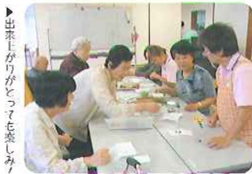
▶出来上がりがとっても楽しみ!