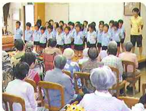
▶かわいらしい歌に拍手喝采