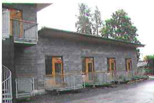
▲自然に溶け込むようなアースカラーの外観(リコヒト)

今回視察した6施設のなかで、もっともユニークで印象深い施設であった。個の重視とフレキシブル性をモットーとしているだけあって、利用者のニーズや能力に応じて、プログラムを常に見直しているとともに、スタ