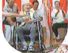
◀長寿おめでとうございます