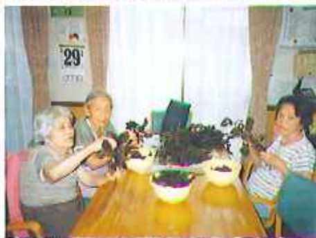
▲たくさんのおしその葉を選別

選別した葉をきれいに洗い、お湯で煮出して砂糖で味付け。少し温度が下がってから、クエン酸を入れると、鮮やかな赤に変化しました。周りで見守る利用者さんからは、拍手や驚きの声が上がりました。皆さんで楽しみながらおいしいジュースが出来上がり、おやつなどに飲んでいきます。