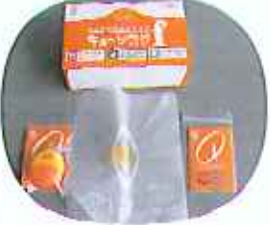
▶人工呼吸用のマスクです

マスクを手順に従って小さ く折り、卵形の入れ物に入れ ます。さらに、袋 に説明書 とマスク を入れて て、箱詰 めをして 完成です。