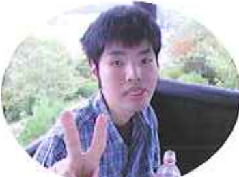
▲展望台アイエーイ

昼食は、お弁当を購入して鞍ヶ池公園の展望台にて景色を見ながら食べました。利用者さんに感想を聞くと「楽しい。」という意見が多かったです。