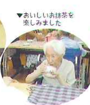
▼おいしいお抹茶を楽しみました