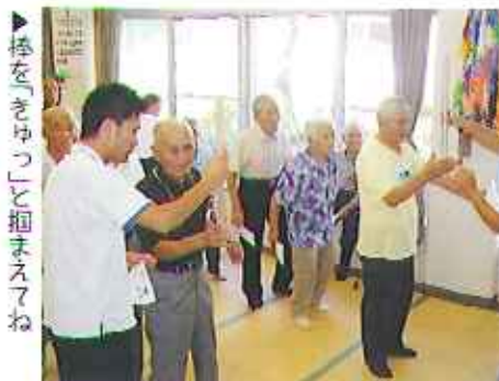
棒を「きゅっ」と掴まえてね