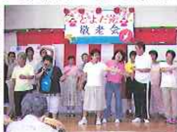
▶喜んでもらってよかった。

楽器演奏も、練習の成果を出すことができ、とよた苑の職員さんや利用者さんが拍手をしてくれましたことにより、笑顔でより一層楽しんで参加できました。