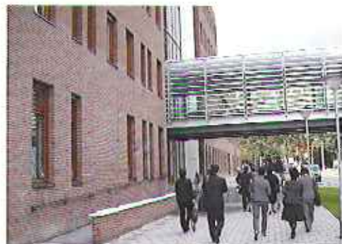
▲大規模な総合精神ケアセンター「ドゥ・バスクル」の外観

9月8日(月)PM 次に訪れたのは、ドイフェンドレイヒトにある「DE BASQUE(ドゥ・バスクル)」という総合精神ケアセンターである。この組織の対象者は、0歳から23歳までの精神障がい児・者およびその家族であり、付属学校を2校、精神科病棟、デイケアセンター等の施設を有している。職員数は700名、利用者数は約4,300名と大規模な公的機関である。