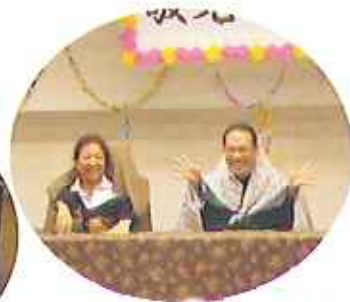
▲二人羽織、上手くできたかな？