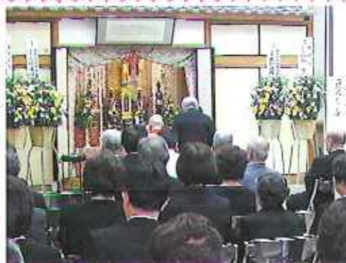
▶物故者の方のご冥福をお祈りしました