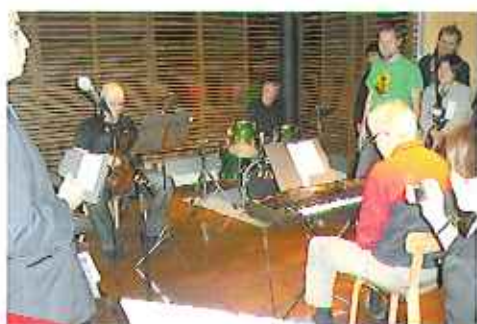
▲音楽工房メンバーによる見事なジャズ演奏に感動(リコヒト職業訓練施設)