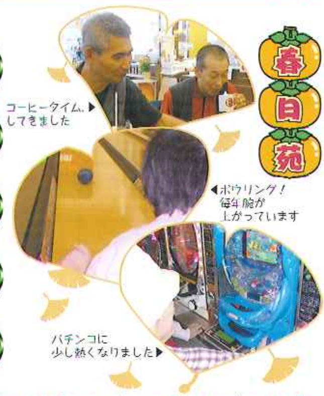
コーヒータイム、 してきました