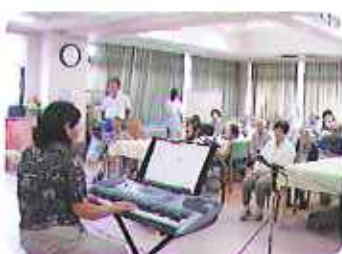
▲キーボード演奏、愛の讃歌に酔いました

9月15日(月)から19日(金)までの1週間、敬老会として様々な催しを行いました。