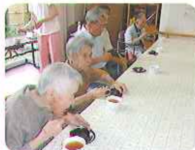
▲みんなで作った「おはぎ」美味しいね

「昔は家族分の倍ほど作ったね。」と利用者さんが話されているのを聞き、子供の頃、何でもたくさん作りすぎていた母を思い出しました。