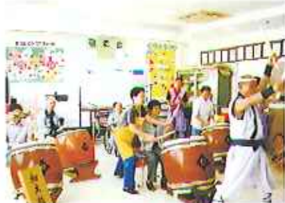
▲皆さんはりきって和太鼓演奏!

9月10日(水)〜13日(土)の4日間、敬老会を行いました。三味線・ハーモニカ・ウクレレ、和太鼓の方々の華やかな演奏を