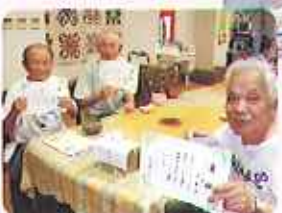
▲紅白まんじゅう、抹茶、桜茶をいただきました

これからも楽しくすごしていきますようにね。 ケアハウスでは、90歳以上の方が8名、85歳以上の方は15名もいらっしゃいます。まだまだ若い者には負けていませんよ!