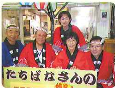
◀たちはな寿司の皆様、おいしいお寿司をありがとうございました