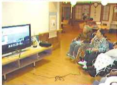
▲はりきって歌います

いずれはクラブを立ち上げて、他のフロアーの利用者さんも参加できるように計画をしています。