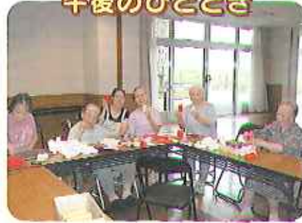
▲赤玉白玉、たくさんできました!

9月に入り、10月に行われる運動会の準備も着々と進んでいます。その中でも、玉入れ競争の玉の製作を利用者さんを筆頭に進めています。