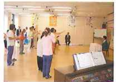
▲利用者の皆さんによる合奏