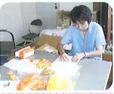
▶マスクが柔らかく難しいよ