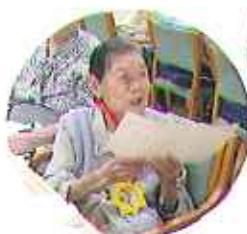
▲毎日、その日の最高齢者に表彰状を送りました