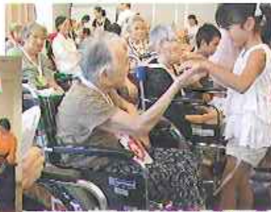
▲かわいい押し花のペンダントをプレゼントしてくれました!

9月12日(金)、敬老会を開きました。演芸会では、下津保育園の年長さんが歌や手遊びを披露してくれました。とても可愛い演技に利用者さんの表情も和らいでおられました。その後のあらしは会さんによ