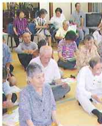
グッズを体験しながら真剣に聞き入る

で評価した結果を受け取ると、「まだまだ大丈夫。」と自信をつけた方や、「この低いレベルでは、もう少し動かないとね。」と決意されている方など、改めて体力を知る機会になりました。