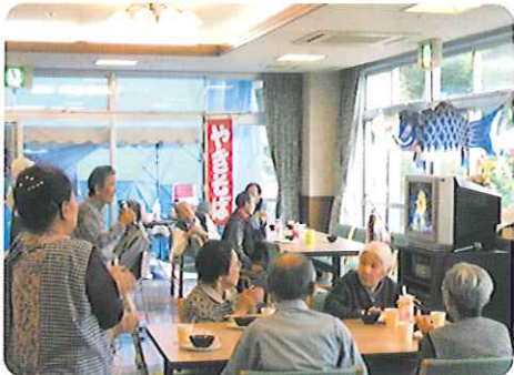
▲お腹もふくれたところで陽気にカラオケ♪(ケアハウス)