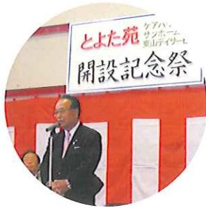
▲倉知会長あいさつ

4月25日(土)、とよた苑14周年・ケアハウス豊田12周年・サンホーム豊田10周年・東山デイサービス6周年、4月29日(水)、第2とよた苑1周年の開設記念祭を開催しました。大勢の方にお越しいただきました。利用者さんのたくさん笑顔がみられました。