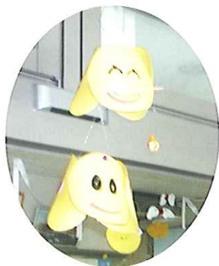
◀ショートステイ「笑」