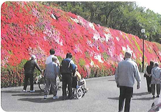
▶つつじの壁みたい!

日に日に暖かさも増し、たくさんの花が見られるようになりました。当センターでは、4月末から5月半ばにかけて、つどいの丘へつつじを見に、豊田市西山公園へバラを見に出かけました。季節の花を眺めていると、自然に笑みがこぼれていました。春の風や日差しから、夏への移り変わりを肌で感じることで、デイルームでの話題にも花が咲き、とても賑やかな時間を過ごすことができました。