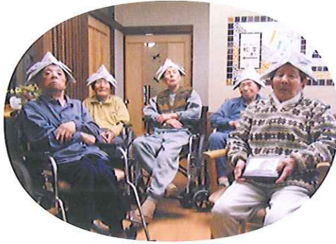
▲よくお似合いです

5月5日(火)、こどもの日に端午の節句会を行いました。かぶと作りや菖蒲湯を楽しんだ後、職員の出し物やカラオケ大会などを行いました。カラオケでは利用者さんのご家族にも