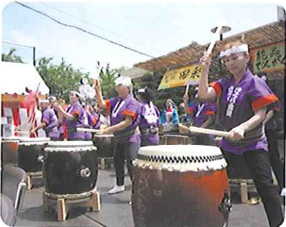
▲太鼓演奏 さくら太鼓の皆様