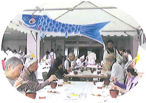
▲楽しい食事の一時(ショートステイ)