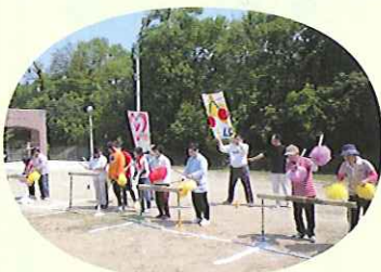
▶竹太鼓に拍手喝采

5月30日(土)、豊田市立美里中学校からご招待いただき、今年も体育祭に参加してきました。サンホームの精鋭5名が、地区別対抗玉入れに参戦。生徒の皆さんの温かい声援とサポートをいただき、気合い十分で取り組みました。