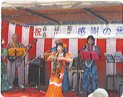
▲アロハエコースの皆様