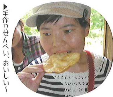
▶手作りせんべい, おいしい!