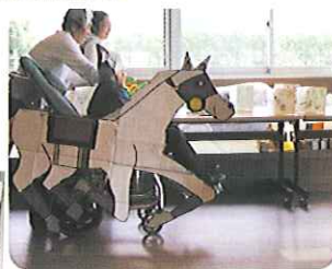
上手的に当たるかな?

職員が1か月がかりで作った流鏝馬の馬に乗り、ピストル型の弓を使って厄落としに書いた的に発射していただきました。最近、世間を賑わしているインフルエンザ等、旬の話題を的にし、利用者の皆さんは楽しそうに狙いを定めていました。