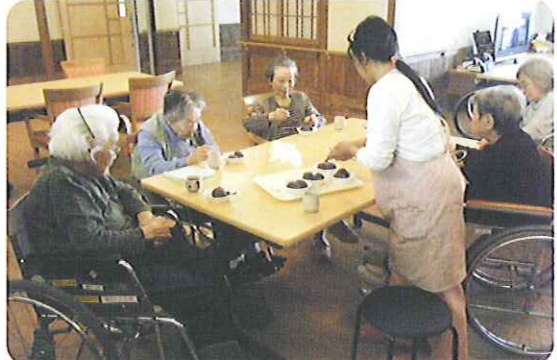
▶おはぎを皆さん上手に作っています

5月20日(水)、おやつのお時間におはぎをユニットで作りました。おはぎを丸めてあんこを作る作業は、さすがに皆さん昔やっていただけあって、慣れた手つきでした。とてもおいしそうなおはぎでした。手作りのおはぎはおいしさも格別だったようで、「美味しいね。」「昔はよく作ったね。」と会話もはずんでいました。