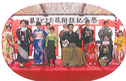
▲とよた津軽三味線の皆様