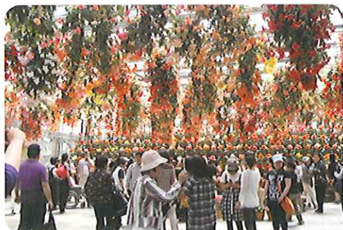
▲一面、花畑みたいだね

なばなの里に行きベゴニアガーデンを散策しました。赤バラソフト・黄バラソフト・ベゴニアソフトなど珍しいソフトクリームがありました。「おいしいかった。」といいつつ食べている利用者さんもいました。