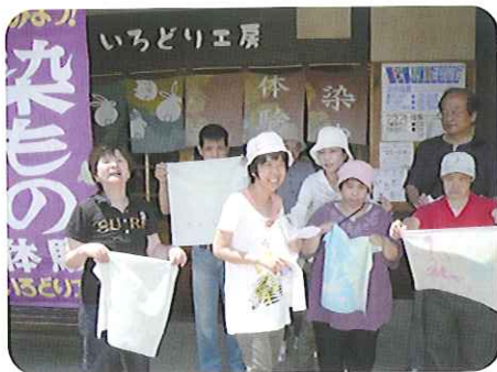
▲きれいに染まりました◎