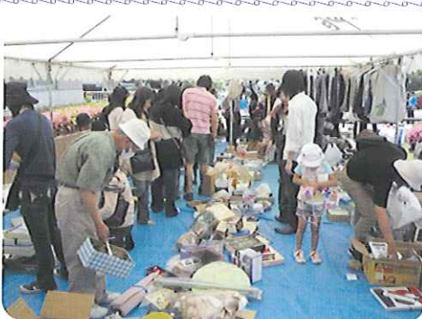
▲みなさんの善意でたくさん集まりました!!