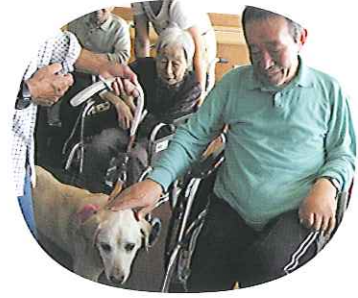
笑顔が素敵ですね!