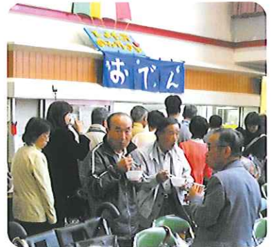
▲模擬店はどこでも長蛇の列