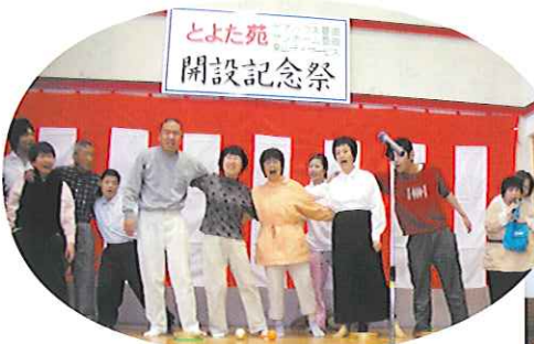
▲サンホーム豊田の合唱団の発表