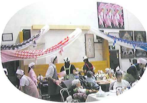
▲室内でも元氣よく泳ぐ鯉のぼり(特養)

5月5日(火)、こどもの日に各施設において端午の節句会を行いました。こいのぼりを泳がせて楽しみました。