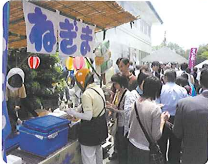
▲大行列がまきるほどにぎわう模擬店の数々

5月23日(土)、春緑苑23周年・春日苑18周年感謝の集いを開催し、当日は、17000名を超える多くの皆様においていただき、多くのお客様でにぎわいました。