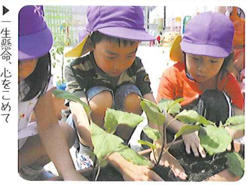
▶一生懸命、心をこめて