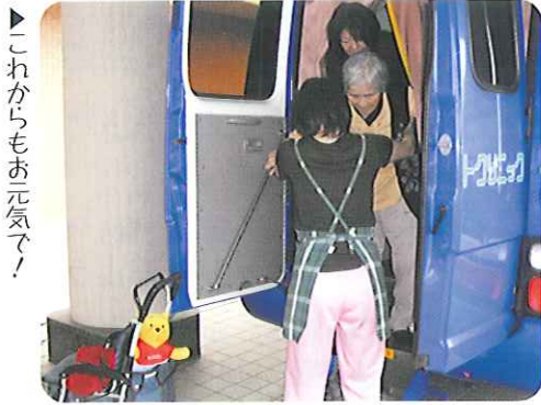
これからもお元気で!

5月8日(金)、春の健康診断を実施しました。午前中は歩く方、午後からは車椅子の方のレントゲン撮影を行いました。ある利用者さんは、「どっこも悪いところはなないけどなあ。」「とりあえずは看といてもらおうか。」と冗談交じりに話されていました。和気あいあいの雰囲気の中、検診もスムーズに終わることができました。 これからも、利用者の皆さんの健康管理を行っていきます。