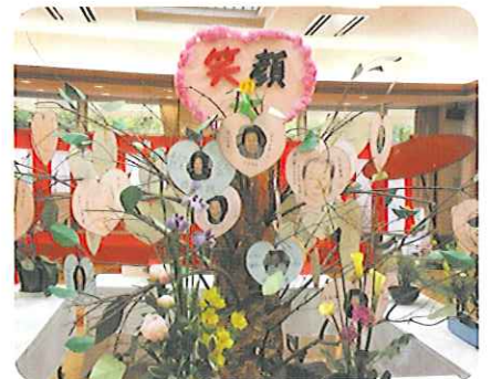
▲今年のテーマは「笑顔」