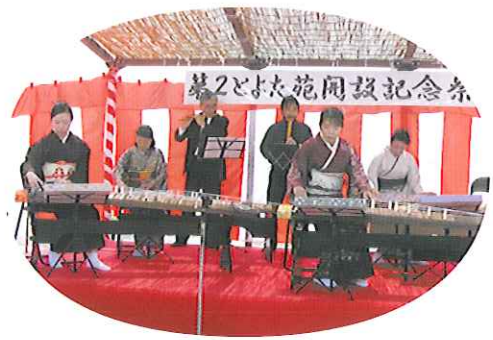
▲心地よい琴の音色が響き渡ります