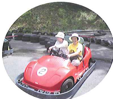
▲あまり飛ばさないで~