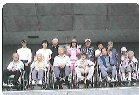
▲4階から豊田の街を見おろして、ハイ!チーズ!