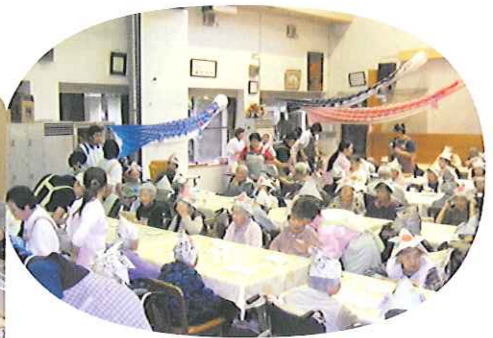
▲皆で作ったかぶとをかぶって乾杯(特養)