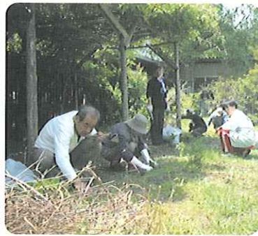
▲隅々まできれいにしていただきました

5月9日(土)、記念祭前の苑内大掃除と保護者会バザーの値段付けを行い、9名の保護者の皆様に「ご参加をいただきました。当日はお天気も良く、皆さん手際よく作業のお手伝いをしていただき、記念祭でお客様をお迎える準備が順調にできました。お忙しい中、ご協力をいただきましてありがとうございます。