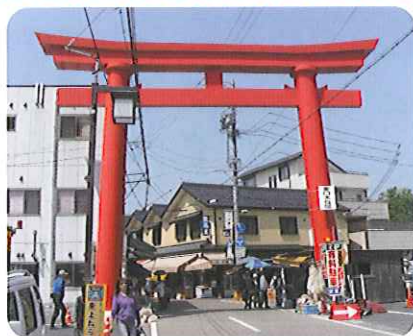
▲大きな鳥居にビックリ!!

5月20日(水)にお千代保稲荷となばなの里に行ってきました。昼食はお千代保稲荷にていただきました。うなぎや海老など豪華な料理が並んでいました。