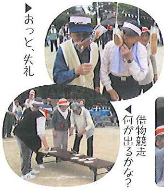
借物競走 ◀何が出来るかな?