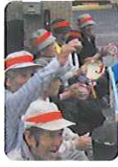
◀がんばれ!がんばれ!

競技の結果は赤組の勝ち!「もう一度やりたい。」「来年こそ負けないぞ!」と次の開催に向けて意気込んでいる利用者さんもありました。