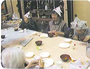
▼焼肉・焼きそば・お好み焼きに舌鼓(特養)