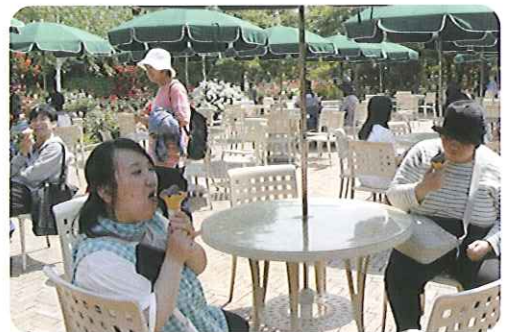
▲バラのソフト はじめて食べたよ