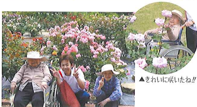
▲きれいに咲いたね!!