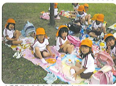
▲手作りのお弁当、おいしいね!!

楽しかったね！遠足 爽やかな青空の下、子どもたちは朝からハイテンション。リュックを背負って登園してくる姿はみんな笑顔いっぱいでした。 2歳児のみんなは、地域へお散歩に出かけるということで、誘導ロープを握り、お菓子を持って足取りも軽く歩きだしました。 「あつ、お花。」「こつちに白い鳥がいるよ。」「と歩きながらいろいろな発見をしました。時々、通る電車に「はいはい！」「と手を振るなどかわいらしい姿の2歳児の子どもたち、保育園