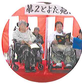
▲第2とよた苑詩吟クラブの皆様