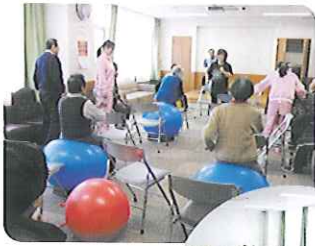
▲腰痛にも効果が ありますヨ！▶