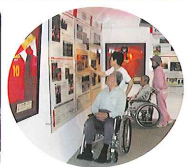
▲ギャラリーも見せて!!