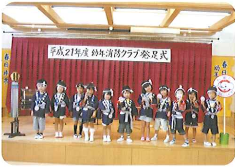
▲メダルをもらってポーズ!

子どもたちは、はつぴを着て、少し緊張ぎみの様子でしたが、代表の子がまといやプラカードをもらい、みんなで「よいこのぼっかのちかい」を大きな声で言うことが出来ました。