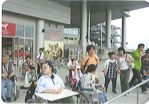
▶エアポートウォーク名古屋