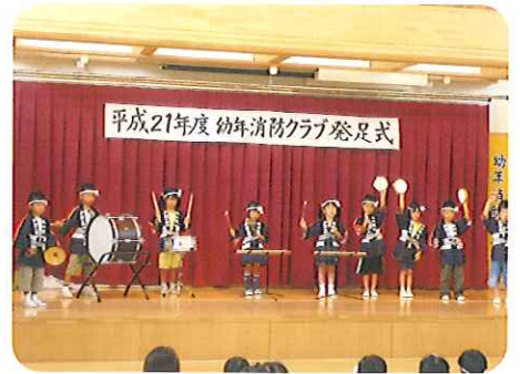
▲さすが、年長組さん

年中組、年長組は楽器で「ミッキーマウスマーチ」や「小さな世界」を演奏しました。子どもたちは、いろんな楽器に興味を持ち、初めは遊び感覚で練習し、時には上手く演奏ができて自信をなくしてしまつこともありました。次第に上手く演奏ができるようになるにつれ自由遊