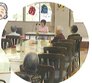
▲読み聞かせ昔を思い出しながら聞いていました