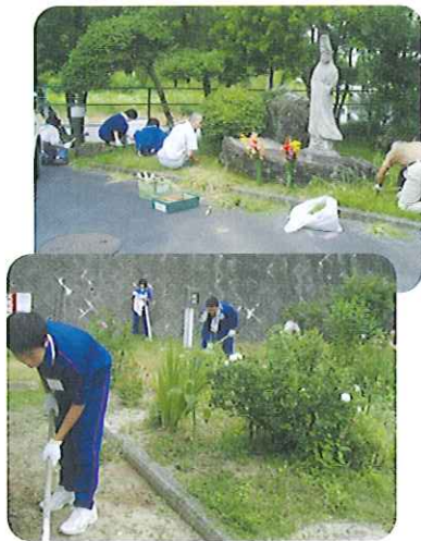
▲草むしり 大変助かるね

6月28日(日)、梅坪台民生委員、梅坪台交流館ボランティア中学生と先生、交流館職員総勢29名が清掃仕活動に来てくださいました。利用者さんとふれあいながら草むしり、ガラスふきを行い、苑内はとてきれいになりました。ありがとうございました。