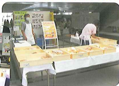
▲たくさんのパンを用意しました

6月13日(土)、春日井市役所1階ホールにて「かすがいエコライフフェア2009」に参加し、市役所販売で使用しているスペースをお借りしてパンを販売したり、様々な団体や参加者にチラシを配るなどの広報活動を行いました。