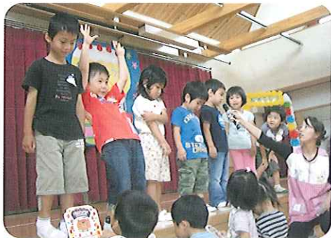
▲大きくなりました!

その後、年長組の合唱、年中組の楽器演奏、保育士によるパネルシアターと続き、思い出に残る素敵な誕生会になりました。