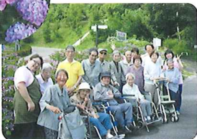
お花の前でハイ、ポーズ!