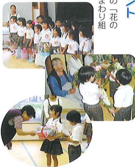
▲花束ありがとう 園児さんに雑巾をプレゼント!

園児たちのかわいらしい笑顔に、利用者さんは自然と笑顔になります。元気いっぱい、その歌のプレゼントもあり、そ