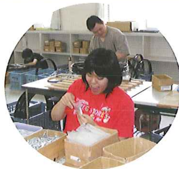
▲お仕事いっぱいであうらしい!!

本格的な夏が近づき、暑さとの戦いになってきました。作業には、熱接着するものもあるのですが、作業室はとても暑いのです。しかし、その中でも納期に遅れないようにと、みんなで協力して仕事をしています。