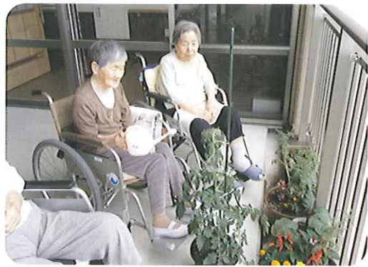
▶早く大きくなりますように

聞いて、今後の支援を検討しました。その後、家族の方から「色々話せて良かった。安心してこれからもお任せできます。」と笑顔で言われ、会議の重要性、大切さを感じた1日でした。