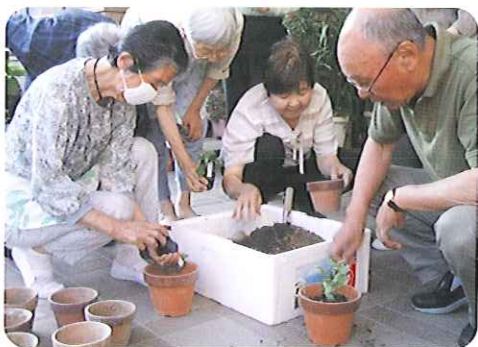
▲希望者の方に1人1本の菊の苗