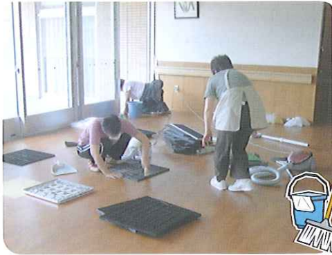
▶隅々まできれいになりました!

6月6日(土)、平成21年度、春の家族ボランティアが行われました。51家族67名のご家族様が清掃活動に参加していただきました。手の届かないエアコンや窓ガラスなど、普段ではなかなか掃除ができない所まで、きれいにすることができました。利用者さんからは「きれいなところで気持ちいいね。」という声が聞かれ、職員からは「気分一新、すがすがしい気持ちで業務