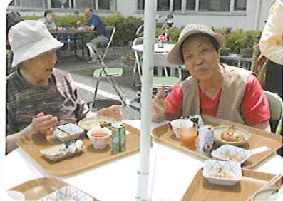
▲屋外での食事は食欲がすすみます

6月2日(火)、ケアハウス玄関前でバーベキュー会を行いました。心配された天気もなんとかもち、新緑を楽しみながらお腹いっぱいいただきました。