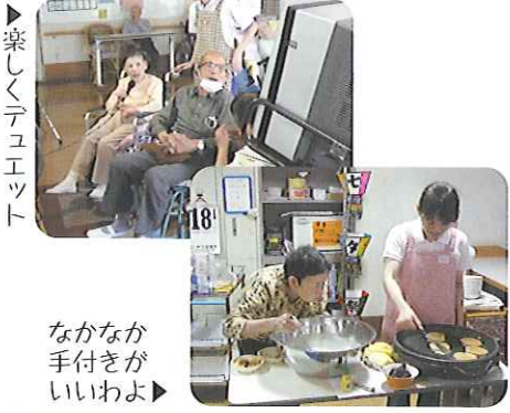
▶楽しくテュエット

6月18日(木)、3階のあおぞらフロア、ひだまりフロアで「お楽しみ会」が行われました。それぞれカラオケ会と、今川焼きづくりをし、皆さん楽しんでおられました。