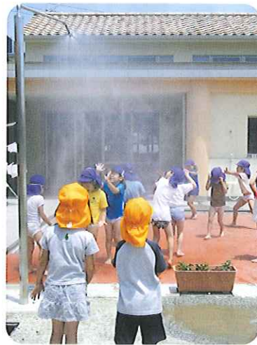
▲ミスト、気持ちいい~

いに外に駆け出し、しゃぼん玉や色水遊び、泥んこ遊びに夢中になって楽しんでいきます。裸足になり、足の裏から直接伝わってくる砂や水の感触に大はしゃぎの子どもたちです。