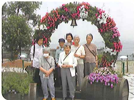
▲ブルーポネット花いっぱい心癒されました

6月16日(火)、6名の利用者がさんが日帰りツアーに参加しました。珍しいブルーポネットの