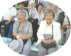
▶イルカのパフォーマンスに思わず拍手

花を見て、心癒されました。立体感をもった庭園で、また、違う季節に來たいなあとと思うお庭でした。水族館では、大きな水槽で多くの魚たちを見ながらの食事を楽しみました。イルカショーでは、訓練されたパフォーマンスに拍手と歓声でしばし童心に戻り楽しむことができました。