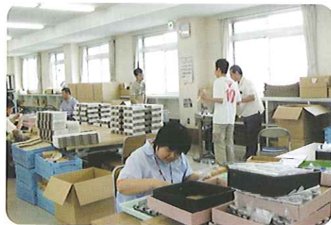
▲暑いけど、手は止めないよ