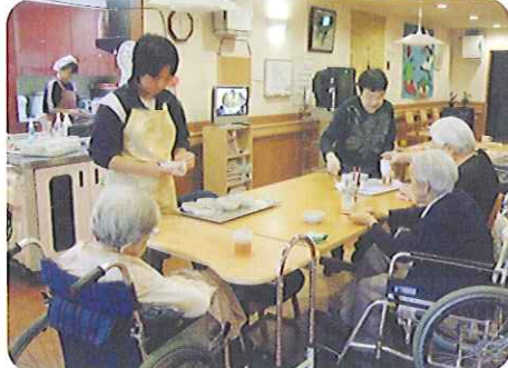
▲今日のご飯は何か、配膳も丁寧に出来ました!

6月1日(月)～5日(金)、近くの養護学校から生徒の方が実習に来て下さいました。4階のユニットにて、コミュニケーションや食事の配膳、下膳、掃除など実習活動を行っていただきました。迎える利用者さんも、優しく声をかけてくださり、短い実習期間でしたが、学んでもらえたことはたくさんあったと思います。声をかけると「楽しいです。」という笑顔の実習生さんがとても印象的でした。笑顔を大切にこれからも頑張ってください。