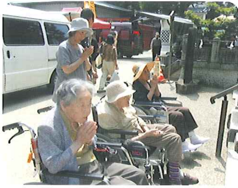
▶お買い物前に一礼

毎月、楽しみにしている利用者さんもおられ、「いろんな店があつて楽しいね。」「また行こうね。」などの声が聞かれました。参拜と買い物を楽しんだ1日でした。