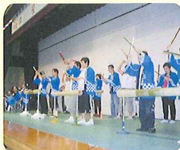
▲みなさん緊張しながら頑張っています