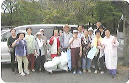
▲おいしい梅干しつけるよ!!