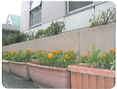
◀玄關先で皆さんをお迎えします