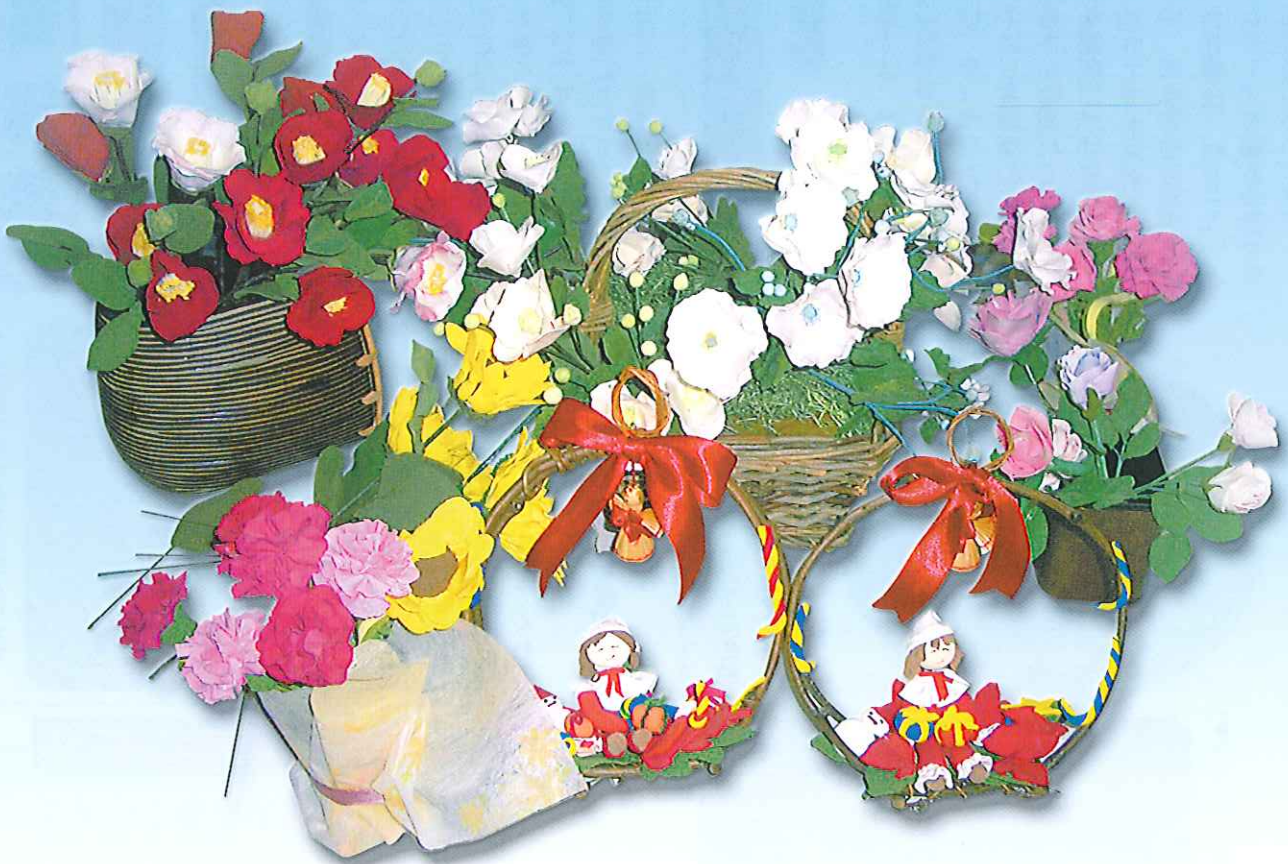
ケアハウス春緑苑利用者協同作品