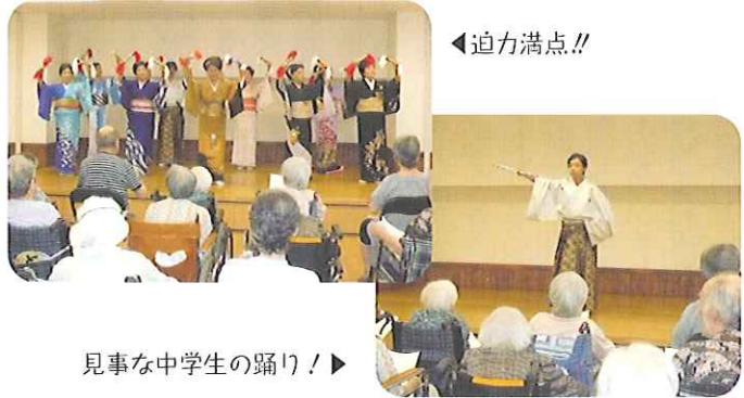
見事な中学生の踊り!▶