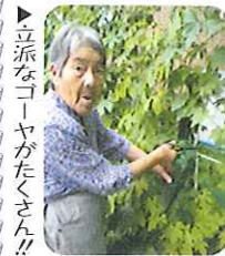
立派なゴーヤがたくさん!!

利用者さんは、力強く育つゴーヤを収穫し、おいしく食べ、ゴーヤから元気をもりました。