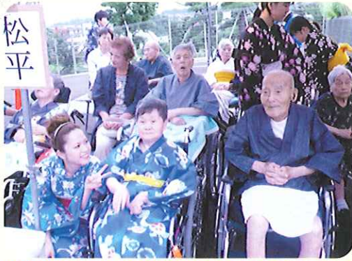
▶浴衣がともお似合いです

当日、いつも以上の笑顔で夏祭りを楽しんでいる利用者さんの姿がとても印象的でした。また、利用者さんや家族から「楽しかったよ。」などの声も聞かれ、たいへんうれしく思いました。この笑顔を励みにこれからも頑張っていきます。