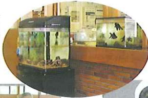
大きいのと小さいの♪

外へ運び出し、フィルターを洗う係、水そうに敷く石を洗う係と役割分担を決め、細かいところまできれいにしました。水を替えたことで、魚たちも気分転換になりました。