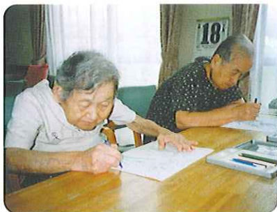
▲上手に塗っていますね!!

完成品は廊下に展示してあり、利用者さんは作品の前で足を止めて「とてもきれいに塗られているわね。」と、花の彩りを楽しんでいただいています。