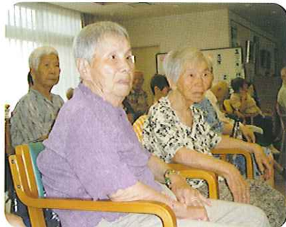
▲どうなってるんだ?

軽快な音楽に合わせて、空っぽの紙袋や箱から、色鮮やかなハンカチ・花束・人形が出てきたり、消えたはずの水が、またコップに現れるなど、次から次へとマジックが披露されました。利用者さんからは歓声と拍手が起きていました。