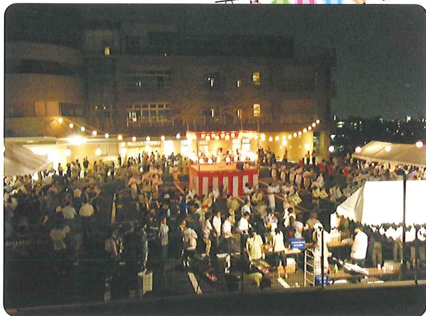
▲今年は去年よりも増え702人の方々に参加していただきました

梅坪民謡クラブ 様 西川友美津会 様 西山さつき会 様 天太鼓舞夢一座 様 菊香流 菊香会 様 浄水小学校 和太鼓クラブ 様