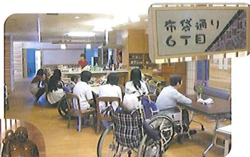
▲8月1日(土)よりユニット2号館がオープンしました。新しい建物でひろびろゆったりです。