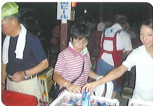
▶大きな声で、笑顔で、売るぞ!!