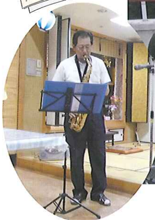
▲サクソの演奏もあり 雰囲気最高!!