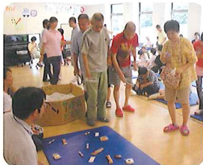
▲「おいしそうなのを釣るぞ〜」

お盆期間中に帰省をされなかった利用者さんに楽しんでいただくこと、8月9日(日)、お楽しみ会を行いました。ゲーム内容は、ヒモにお菓子を付けて引