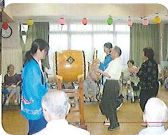
◀「アラ・エッサッサー!」

また、輪投げや懐かしい風船つりも行いました。風船つりは、一人で2つも3つもすくう利用