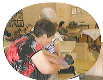
▲きれいに洗ったつもりでも... 汚れが残っていてびっくり!!