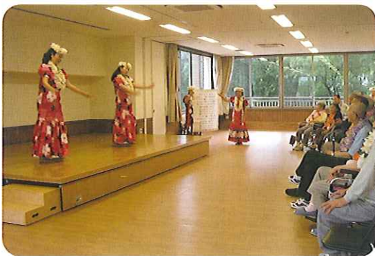
▶きれいな衣装ですね!!