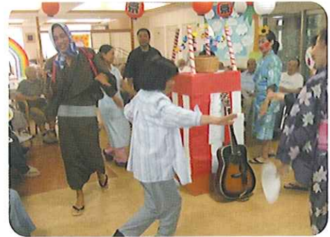
▲みんなであどろまい!!

とよた苑デイサービスでは、8月9日(日)から1週間続けて盆踊り大会が行われました。職員が着物を着て、やぐらを囲み、恒例の東京音頭を踊っていたところ、利用者さんも自分から踊りの輪に参加され、昔を懐かしむかのように楽しんでいらっしゃいました。また、利用者さんの踊りがとても上手で、職員も感心するほどでした。