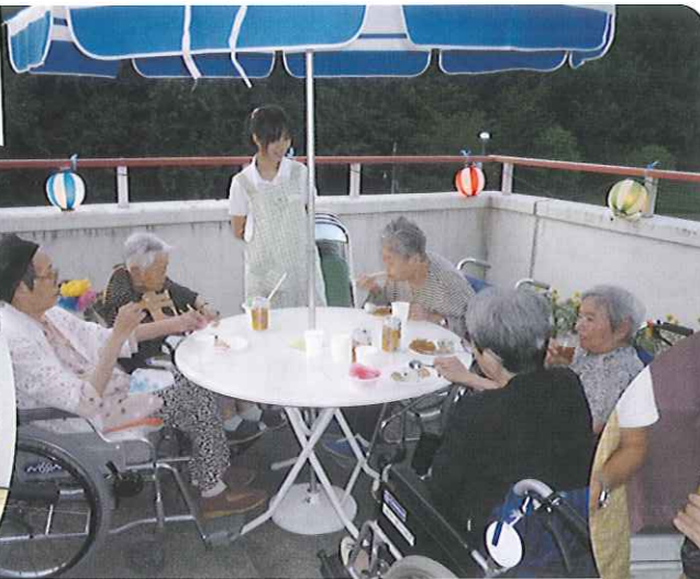
▲皆さん思い思いのものを注文され 楽しまれました