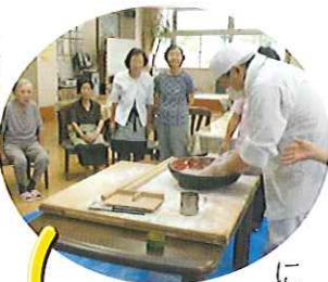
▶北海道産 二八そば粉をこねて