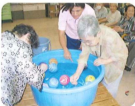
▲たくさんとれるといいな?

軽快な音楽に合わせて、空っぽの紙袋や箱から、色鮮やかなハンカチ・花束・人形が出てきたり、消えたはずの水が、またコップに現れるなど、次から次へとマジックが披露されました。利用者さんからは歓声と拍手が起きていました。