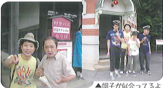
▲帽子が似合ってるよ