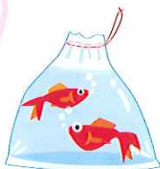
▶1162人の方々に参加していただき、盆踊りや模擬店を堪能していただきました