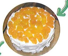
▶きれいに できあがり ました