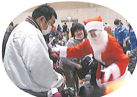
▲サンタさんにプレゼントもらったよ

太鼓の演奏を聴いたり、サンタクロースと触れ合ったりして、楽しいひと時を過ごしました。