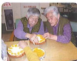
▶おいしくできるかな？