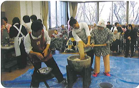
◀上手にできました

利用者さんからは、「おいしかったよ。」「楽しかったね。」などの声が聞かれました。