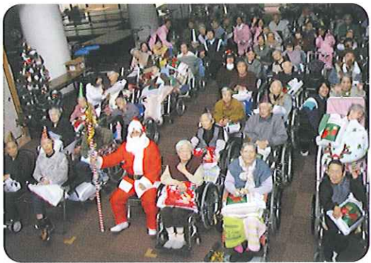
▶みんなプレゼントを抱えて記念撮影

二力演奏会が行われ、クリスマス ソングを聞き、クリスマスマ ーキを食べて、クリスマス気分 を存分に感じていただいた1日 となりました。