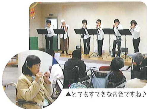
▲とてもしずやかな音色ですね♪