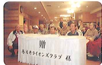
12月6日(日)、春日井ライオン スクラブ様からもちを寄贈して いただきました。