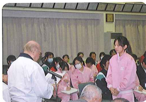
◀見事!!最優秀賞受賞