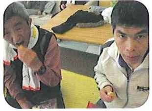
▲自分で作ったクッキーかな?

利用者は、クッキーの型抜きを行い、ツリーやハートなどのいろいろな型を「どれにしようかな?」と楽しそうに選び、上手に形ができると、「できたよ。」とうれしそうに見せてくれました。焼きあがったクッキーにラッピングをして、おやつにみなさんに配ると、「おいしい。」と喜んでおられました。