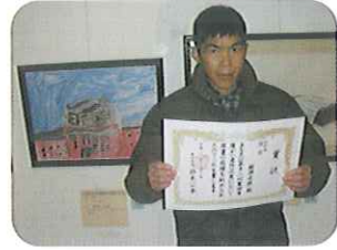
▲樹神さんおめでとう!!