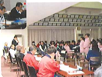
審査員による講評▶