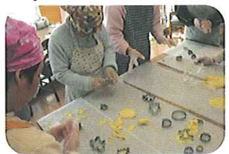
▲いろんな型で挑戦!

利用者は、クッキーの型抜きを行い、ツリーやハートなどのいろいろな型を「どれにしようかな?」と楽しそうに選び、上手に形ができると、「できたよ。」とうれしそうに見せてくれました。焼きあがったクッキーにラッピングをして、おやつにみなさんに配ると、「おいしい。」と喜んでおられました。