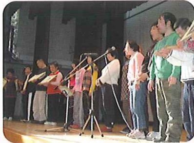
▲すてきな歌声です

11月23日(月)、音楽交流会を行いました。はじめに、豊田東高等学校の吹奏楽部のみなさんに、迫力のある演奏をしていただきました。同校の琴部のみなさんにも演奏をしていただき、生の演奏を聴くことができました。最後は生活介護のみなさんが、歌と、曲に合わせたメッセージボードを使った発表を行いました。利用者さんは「緊張したけど頑張った。」と達成感に満たされていました。また来て下さった方からも大きな拍手と「感動しました。」という温かいお言葉をいただき、音楽を通じて会場が一体になったように感じました。