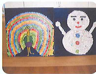
▲完成です! すてきですね

今年度の製作レクリエーション第4弾は、ペットボトルのキャップを使った、「くじやく」と「雪だるま」の製作に決まりました。キャップを下絵に貼り付け、その後、色塗りを行い、完成です。見事、2か月かけての超大作となりました。利用者さんが作った作品は、デイサービスセンターに飾らせていただきました。