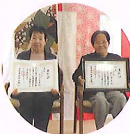
レース編み：銀賞 パッチワーク：佳作 をいただきました☆