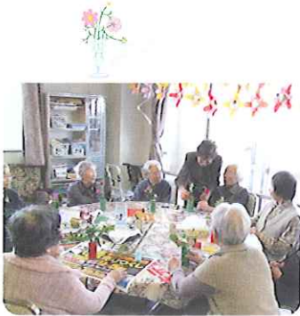
▲みなさん真剣です！

たくさんのボランティアさんに支えていただいています。11月21日(土)には、一輪挿し作りを指導していただきました。利用者さんは空き缶を利用して、思い思いの花瓶を作り、花を生けて楽しめました。