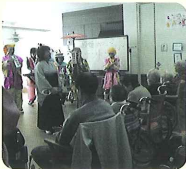
▲とても楽しい時間でした

大変身。自己紹介をしても利用者さんには分かってもらえず、化粧を落とし素颜に戻ると「あなただったの?」と納得。笑顔の絶えない一日でした。