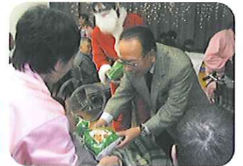
▲プレゼントをどうぞ!!