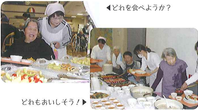
どれもおいしそう！▶