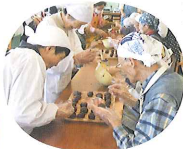
▲大福用のあん丸めも手際よく♪

ちを大好きな具材で、ついつい「おかわり！」。おながが満たされたところで米花作りと愛情たっぷりの大福作り。おいしかったネ！