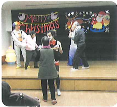
▶利用者さんと楽しくダンス♡