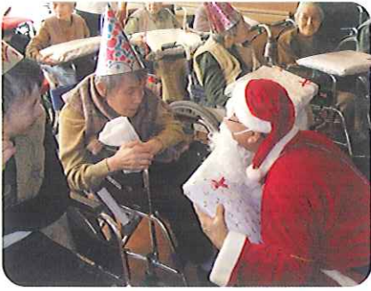
▲みなさん大変喜ばれました!