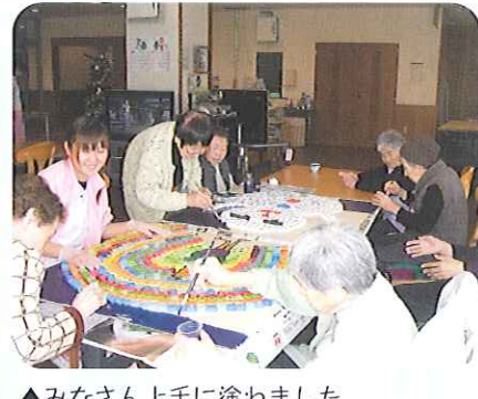
▲みなさん上手に塗れました