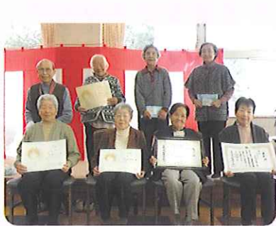
▲受賞者、出品された方全員で記念撮影