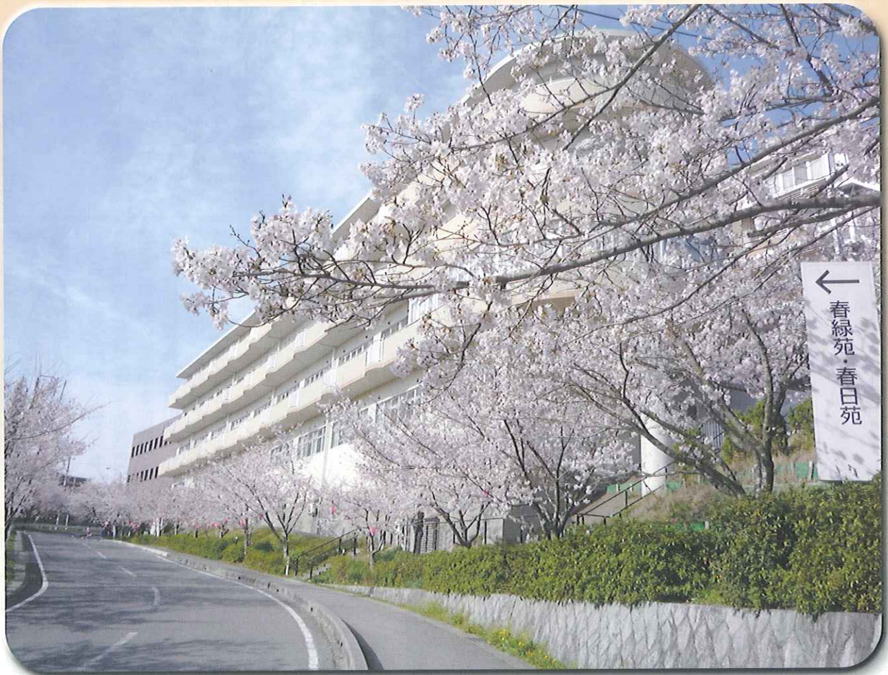
「桜街道」(特別養護老人ホーム春緑苑)