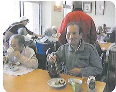
▲お寿司とビール！いいですね〜！

3月17日(水)より2階から4階の順番に寿司バイキングを行いました。マグロ、エビ、サーモン、うなぎといったおなじみのネタに加えて、ナスやシメサバも新登場、全部で12種類の寿司ネタで、にぎり寿司を楽しみました。「昨日から楽しみにしていた。」とおいしそうにお寿司をほおばりながら話される方や、普段は食の細い方が「もっと食べたい!」とお腹いっぱい召し上がっていました。今回初めてデイサービスでも寿司バイキングを提供させていただきました。みなさんの喜びはひとしおで、ご自宅へ送った際、「今日はいざり寿司パーティーがあり、とてもうまくいった。毎日でも行ってみたい。」との話をされた利用者さんもいました。