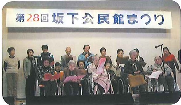
▲みんな大きな声で元気よく歌いました

3月7日(日)、坂下公民館まつりの演芸部門へ特養・ケアハウス・グループホームの利用者さん15名でカラオケ発表に出演しました。