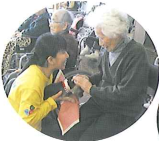
▲「かわいいね〜」思わずにっこり

2月24日(水)、地域交流センターにて、ボランティアの桜犬工房さんによる動物慰問が行われました。ワンちゃんの一発芸披露では、笑いも起こり、きちんと飼い主さんの言うことをきくワンちゃんに「かしこいねー」とみなさん感心されていました。触れ合いタイムでは、おとなしいワンちゃんを膝の上に乗せ、優しい表情で頭をなでている利用者さんが印象的でした。