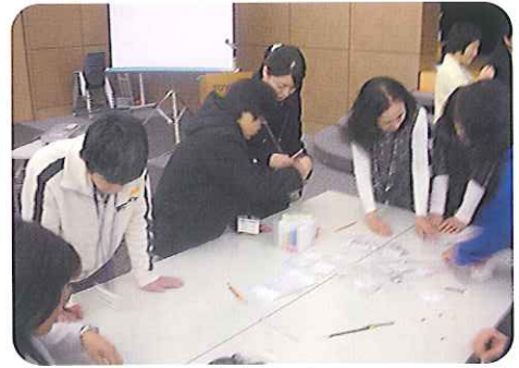
▲切手ゲームに熱中!

先月号でもご紹介したとおり、男性の利用者さんは、2月に女性の利用者さんからバレンタインデー