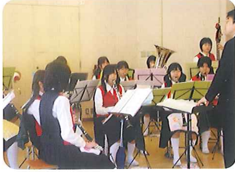
▲いろいろな曲が聴けました♪