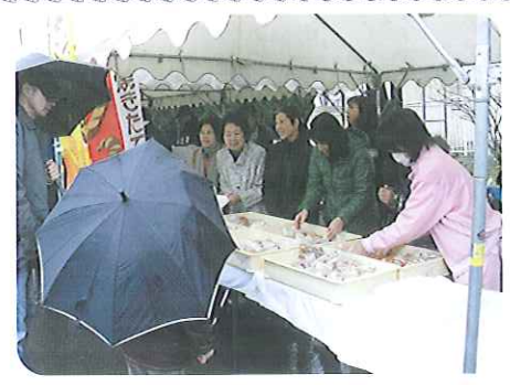
▲いらっしやいませ