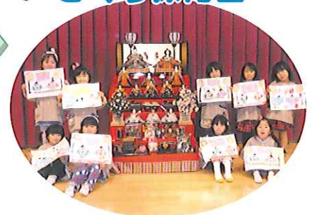
▲おひな様と子どもたちで記念撮影