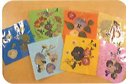
▶きれいな作品ができました