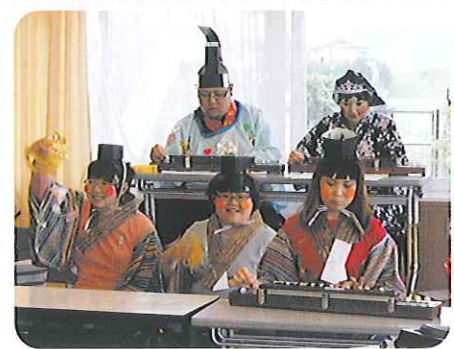
▲「みなさんも一緒に歌ってくださいね〜」

3月1日(月)、ひなまつり会を行いました。職員が手製の衣装を身にまとい大正琴・木琴・タンバリン・カステネット・ハーモニカ・キーボードを演奏しながら、春の小川・さくら・うれしひなまつりを熱唱しました。お内裏様とお雛様・右大臣と左大臣・三人官女・五人囃子総勢12名の演奏は、時代絵巻を見ているようでした。