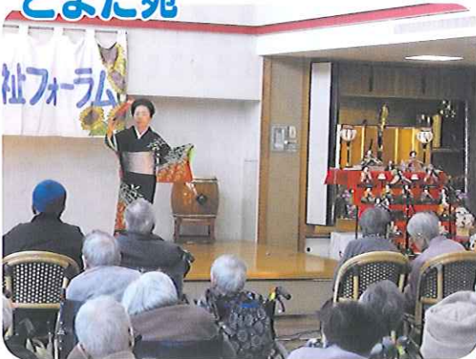
▲踊りにみなさん見入っていました