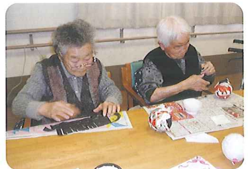
▲こうやってやるのかな?