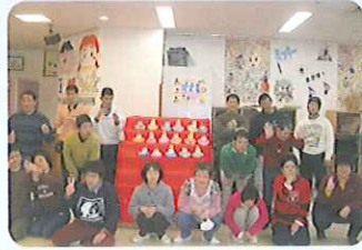
▶灯りをつけましょほんほりに〜♪

3月8日(月)、「ひな祭り会」を行いました。今年は一入ひとつひな人形を作りました。みなさん好きな色画用紙を選び、「どんな着物にしよう?」などお話をしながらペンや折り紙で装飾していきました。顔を描くといよいよ完成です。ひな壇にできあがったひな人形を飾りつけました。17体の個性豊かかわいらしいひな人形をかこんで、ひな祭りの雰囲気味わいました。「かわいくできい〜」とお母さんに見せる。「とみなさん笑顔でひな人形を見つめていらっしやいました。」