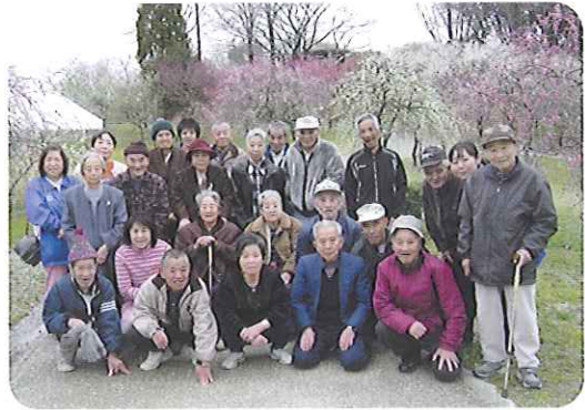
▶梅の花に囲まれ笑顔です