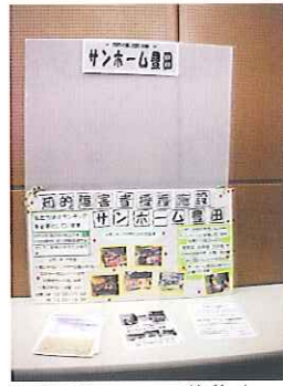
▲ボランティア募集中

3月6日(土)、トヨタ会館で行われたトヨタ自動車ボランティア交流会に2名の利用者さんが参加しました。