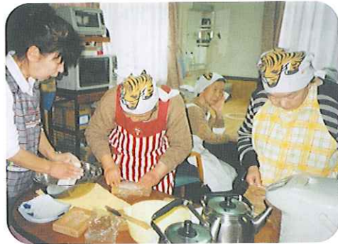
▲みんな真剣な手つきで