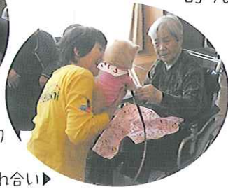
おとなしいワンちゃんとの触れ合い▶