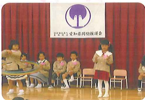
▲上手にできるかな

フラフープやなわとび、あやとり、みつ編み、こままわしなど得意なものをみんなの前で披露しました。自信に満ち溢れた顔の子、失敗してしまった子は再度挑戦し成功するとほっとした表情でした。