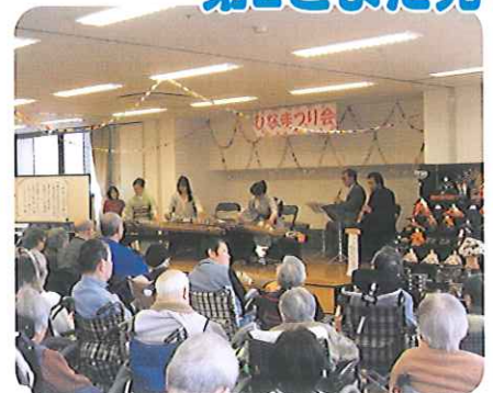
▲琴のすてきな音色にみなさん聞き入っていました