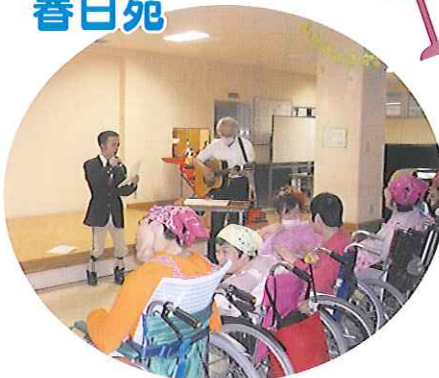
▲歌を熱唱し、楽しいひとときを過ごしました