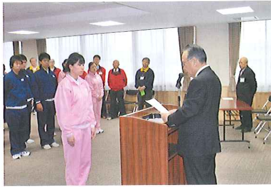
▶辞令を受け取る新人職員

4月1日(木)、春緑苑交流館において、辞令交付式を行いました。倉知会長から、昇格者、新規採用者に辞令が交付されました。職員への激励の言葉をいただき、一同、新しい年度に向けて気を引き締めました。