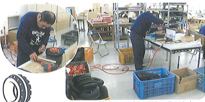
▲けっこう難しい!1度に100個は作ります

藤田フロッキング様より新しい仕事をいただきました。一輪車の業務用タイヤを組み立てる作業です。ホルトを締めるのに専用の機械を使うため、慎重に作業を行います。「ガシャン! プシュー!」と機械の音が響きわたり、活気に満ちています。