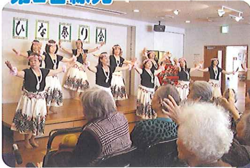
▲すてきな踊りに大感激!!