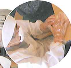
▲生地を上手にはめこんで...