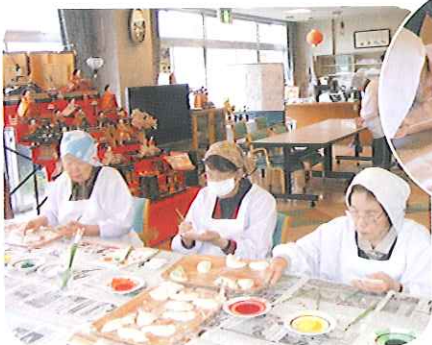
▶慣れた手つきで素早く色付け完成!!