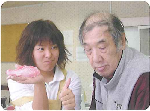
▶真剣な眼差しで作成中