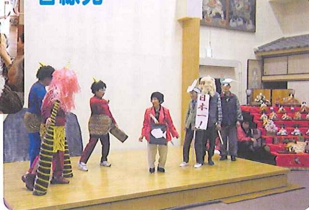
▲演劇でみなさん大盛り上がりでした