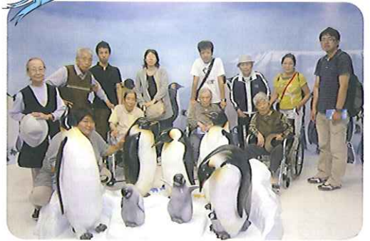
▲ペンギンさんとハイポーズ！