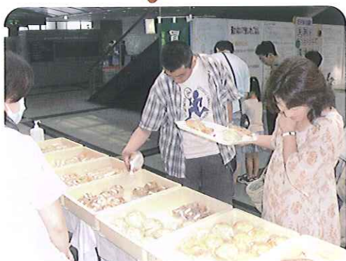
▶どれにしようかな?

焼き上げたパンを車に乗せて出発。11時よりパン販売を開始しました。例年より来場者が少なかったので心配しましたが、完売することができました。