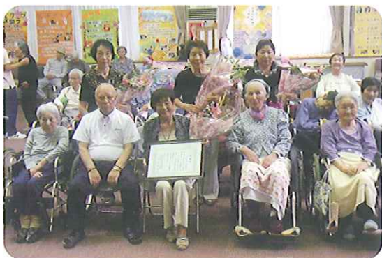
▶最後にみなさん笑顔で記念撮影です

最後のカラオケクラブとなった6月21日(月)には多くの利用者さんが集まり、懐かしい曲を楽しくに歌われました。その後、感謝状の贈呈・利用者さんから花束を手渡され、みなさん涙をこぼされながら最後を惜しまました。本当に長い間ありがとうございました。