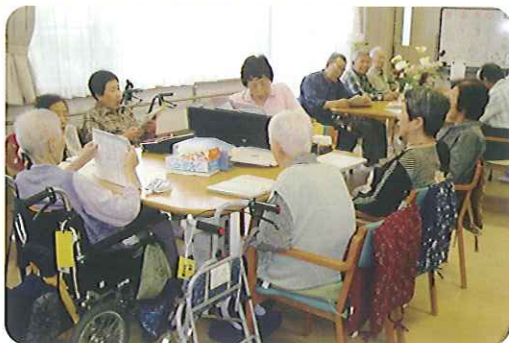
▲大正琴を囲んで癒しのひととき

現在は、踊りやカラオケの練習などで使用されることも多い相談室ですが、今後は茶話会の