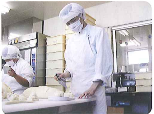
◀おいしいパンを作るぞ!

焼き上げたパンを車に乗せて出発。11時よりパン販売を開始しました。例年より来場者が少なかったので心配しましたが、完売することができました。