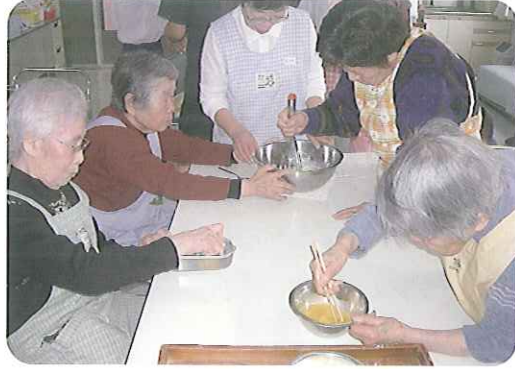
▶おいしくできるかな？

利用者さんに楽しく利用していただくために、色々なレクリエーションを行っています。認知型では、毎日おやつを作っています。ただいております。ご自分で作ったおやつはおいしさも倍増するそうです。おやつつのに時間を召し上がっていただき、みなさん、たいへん満足されています。