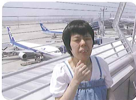
▲飛行機に乗りたいなあ

た。「お風呂が気持ち良かった。」という声が聞かれ、充実した時間を過ごせたようです。