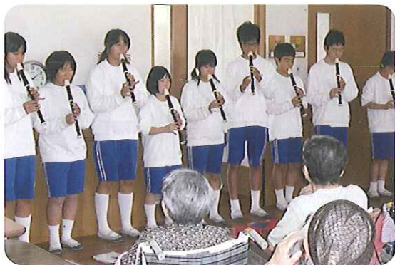
▶リコーダーと歌を披露し利用者さんから拍手をもらいました

6月1日(火)・2日(水)、石尾台中学校の学生さん9名が福祉体験のため、来苑されました。お部屋のお掃除や台車拭きなどのお手伝いをした後、利用者さんとお話や折り紙やけん玉、お手玉、あやとりなどを行いました。「昔はよくやったね。」と、楽しそうにされていました。みなさんご自分のお孫さんやひ孫さんを思い出され、かわいいねと目を細めていらっしやっただのが印象的でした。