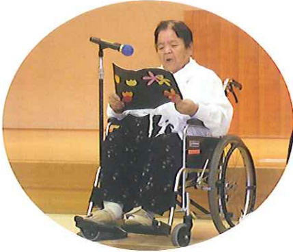
大きな声で上手にできました

6月20日(日)、春日井市、福祉の里レインボープラザにて、明峰岳風会神屋支部の交歓吟詠会が行われました。当苑の詩吟クラブからも初参加をさせていただきました。日頃の練習の成果を披露しました。会場は終始和やかな中にも緊張感があり、参加者は「ドキドキしたけど、上手くできました。」と精一杯、吟じることができたようです。終了後、先生から、お褒めの言葉をいただき、次の発表を目指して、張りきっています。