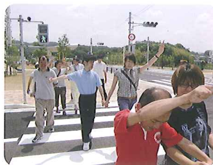
▲車に気をつけて渡ろうね☆

講習後はセンター内にあるミニSに乗りました。みなさん、楽しそうに乗っていて、交通の講習と合わせて大満足の1日でした。