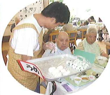
▲どれにしようかな