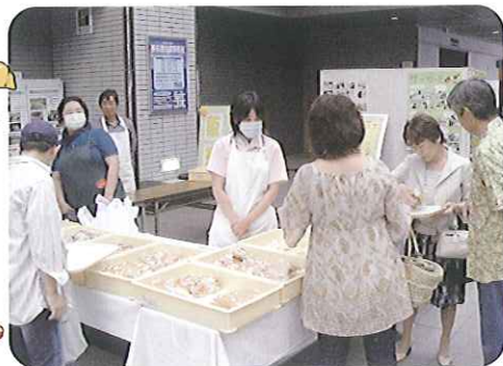
▲昼時はにぎわいました

6月12日(土)、春日井市役所1階のホールにて消費生活展が開催されました。前日からパンの仕込みを始め、おいしいパンになるように、みんなで一生懸命作りました。