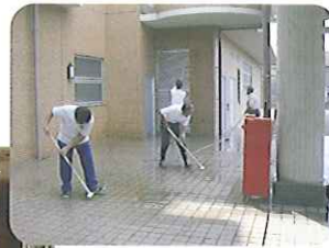
隔々までキレイになりました！