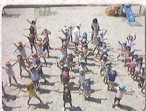
▲遊び前の準備体操OK!!