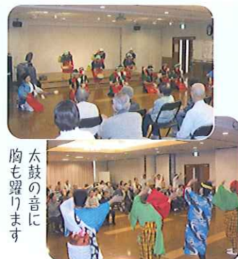
太鼓の音に胸も躍ります

『炭坑節』、『サザエさん』の曲に合わせて踊ったり、最後は『星影のワルツ』を全員で大合奏。