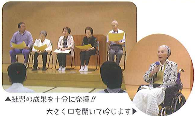
▲練習の成果を十分に発揮!!