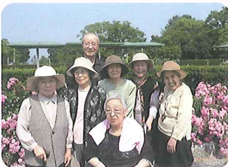
▲花に囲まれハイ、チーズ

外の空気に触れ、お茶を飲みながら散歩することで「気分転換になった。」「気持ちいいな。」という声を聞くことができました。