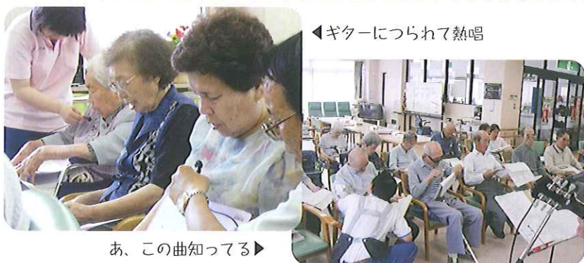
あ、この曲知ってる▶

生演奏に、普段あまり歌を歌わない利用者さんも、歌詞カードを見ながら大きな口で歌わっていました。