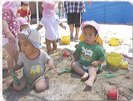
▲どろんこ気持ちいい!