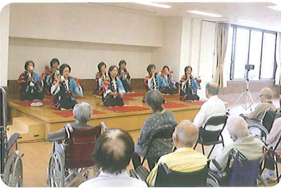
息のあった楽しい演奏でした

利用者さん全員が銭太鼓を持つ体験をし、意外に重たいことに驚いた利用者さんも多くいらっしゃいました。